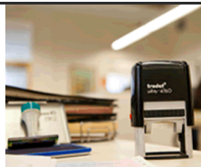
Bústia de factures