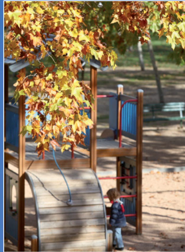
A dalt, la zona de jocs infantils de la plaça Maria Aurèlia Capmany mostra l'esplendor de la tardor i dels seus colors. A la dreta, un infant al parc de Torrelblanca i a sota, curiosos contrastes de colors de les capçades d'arbres al parc de Torrelblanca