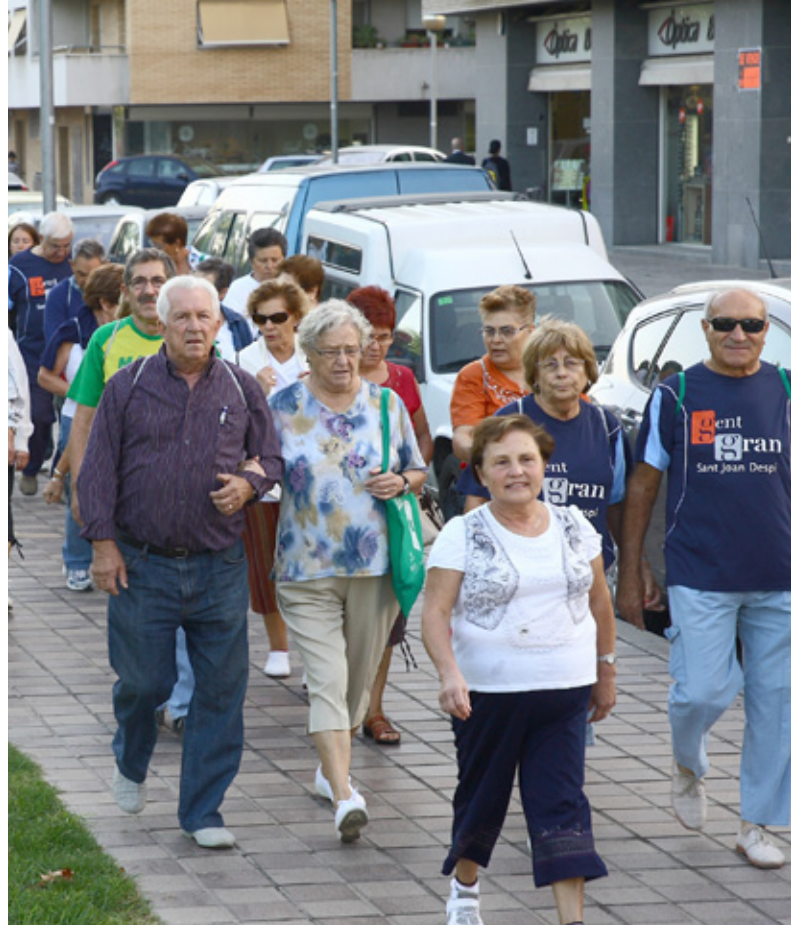
Una de las salidas del itinerario de la 'gent gran'

Con el tiempo, el itinerario se ha enriquecido con nuevas propuestas y desde hace un año, un monitor deportivo acompaña al grupo y les enseña, una vez finalizado el recorrido, a realizar una tabla de ejercicios y de estiramientos. Es importante prevenir las lesiones. Además y