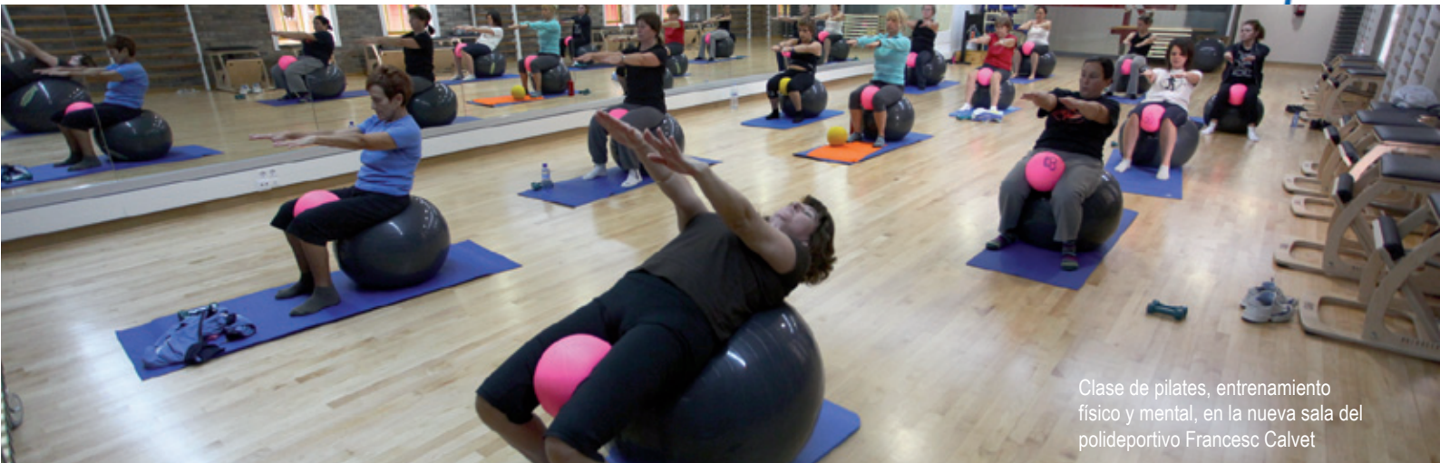
Clase de pilates, entrenamiento físico y mental, en la nueva sala del polideportivo Francesc Calvet