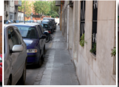
Imatge actual del carrer. A la petita, detall de la vorera més estreta del carrer, de tan sols 80 centímetres

l'obra hagi estat declarada d'interès públic ja que el pla director de renovació del clavegueram ho recomana, tal com s'està fent a Camí del Mig. Els treballs permetran adequar la xarxa aèria existent (línies elèctriques de baixa tensió i de telefonia) en funció de la normativa vigent de les companyies instal·ladores i de