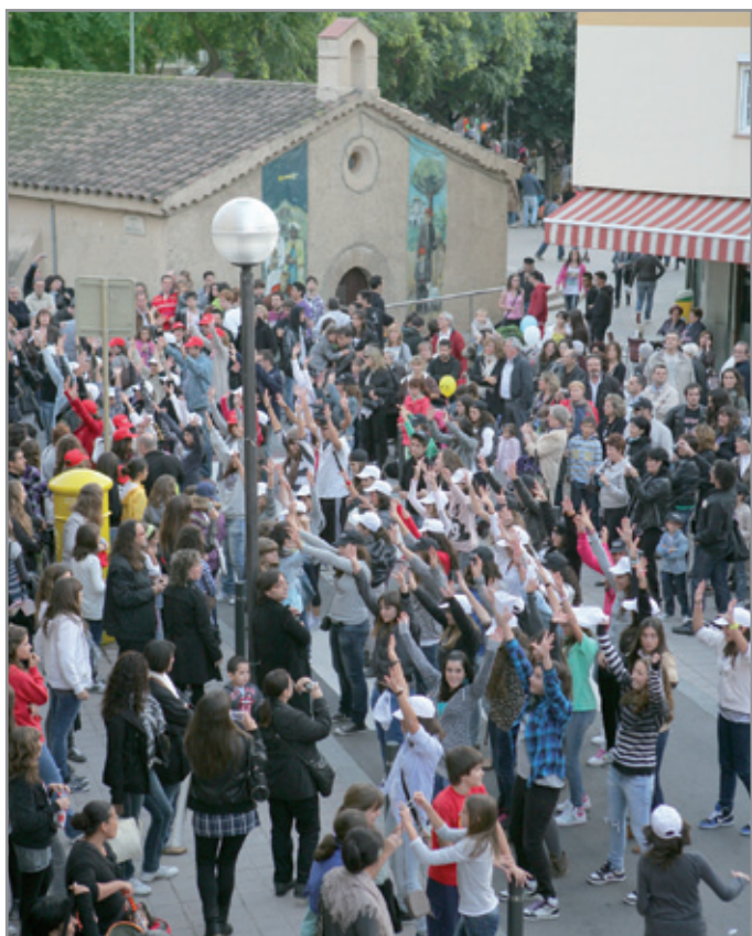
L'Espai Físic EscoladeDansa i Ràdio Despí van organitzar una flashmob, un acte que congrega nombroses persones en un mateix lloc per fer alguna activitat, en aquest cas ballar a un mateix ritme