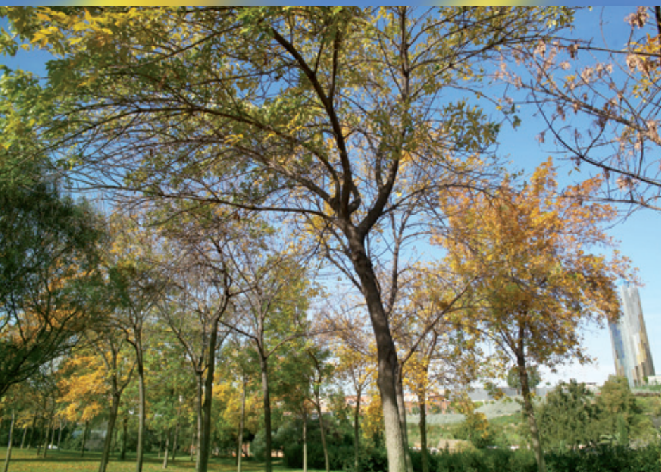
El contrast d'arbres de fulla caduca i perenne també es pot apreciar perfectament al parc de la Fontsanta. A l'esquerra, la Torre de l'Aigua mig amagada entre el fullatge de les capçades. A sota, un home passeja al bell mig de l'espai verd més important i visitat de Sant Joan Despí, el parc de la Fontsanta