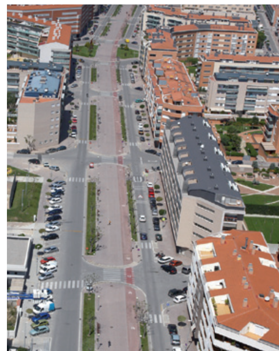
El tipo del IBI se rebajará el próximo año

Respecto al resto de tasas y precios públicos, se incrementarán un promedio del aumento previsto del IPC, un 2,5% (por ejemplo, la tasa de recogida de basuras subirá de 61 a 63 euros) y se mantendrán las bonificaciones que se aplicaban hasta ahora, como aquellas que promueven la creación de ocupación entre las empresas o las rebajas por la instalación de placas solares, por ejemplo.