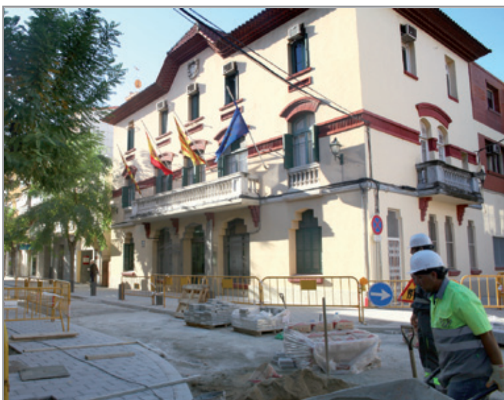
A mitjan novembre es tallarà el trànsit a Frederic Casas per continuar els treballs

L'Ajuntament preveu que les obres, amb un termini d'execució de tres mesos, es puguin iniciar el proper mes de gener.