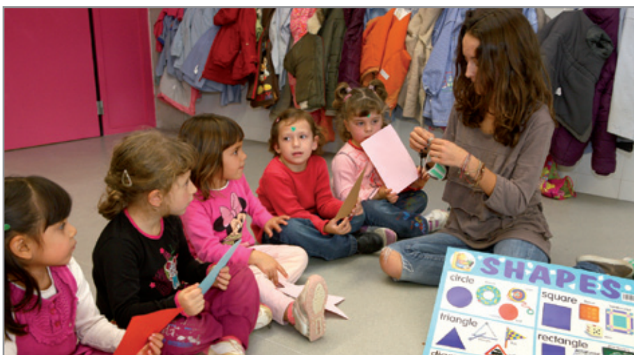
Una de les alumnes voluntàries de l'Escola Americana en una classe, l'any passat

L a feina per impulsar l'ús de l'anglès continua a Sant Joan Despí. Enguany, el consistori ha tornat a posar en marxa el projecte de col·laboració amb la Generalitat i l'American School of Barcelona -ubicada a Esplugues- que permet a estudiants de secundària d'aquest centre reforçar l'ús oral d'aquest idioma als cicles d'infantil i de primària a totes les escoles públiques de la ciutat. L'any passat, i com a experiència pilot, els estudiants van participar en el mateix projecte però només amb els nens i les nenes de P4. La bona acollida ha fet que es torni a fer el projecte però ampliant-lo també als de primària. Els alumnes participen, un cop a la setmana, principalment en activi-