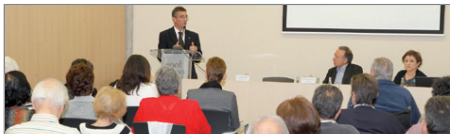
Uno de los momentos de la presentación de la nueva asociación

Organizará actividades de sensibilización y prevención que ayudarán a las personas que padecen esta enfermedad