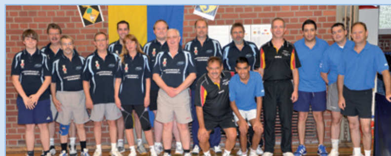
Els participants en el torneig: alemanys (blau fosc), francesos (blau clar) i santjoanencs (negre)

A la final, disputada entre els santjoanencs i els francesos, es van imposar els gals de forma molt ajustada.