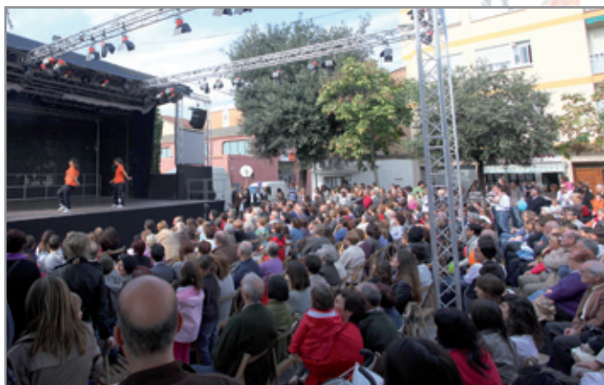
Totes les actuacions -a la imatge, la de l'Espai Físic EscoladeDansa- van aplegar a la plaça de l'Ermita nombrosos ciutadans i ciutadanes