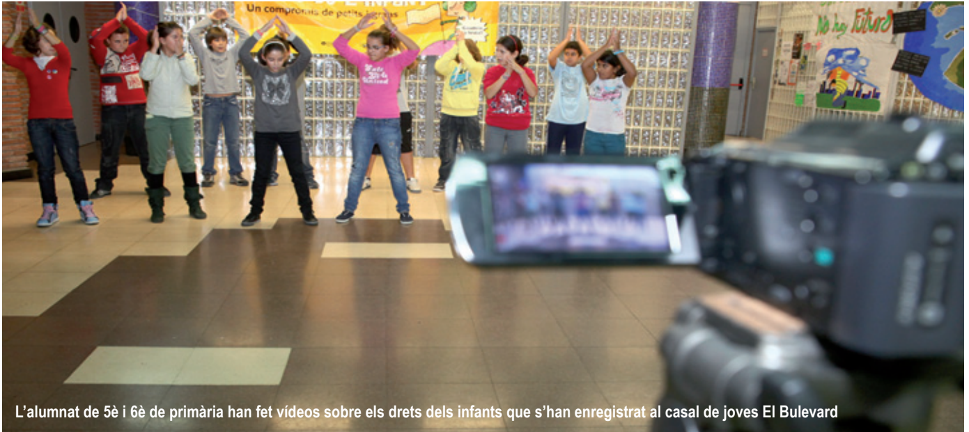
L'alumnat de 5è i 6è de primària han fet vídeos sobre els drets dels infants que s'han enregistrat al casal de joves El Bulevard

El grup Macedònia actuarà, el 18 de novembre, a l'Auditori Miquel Martí i Pol en el marc dels actes commemoratius del Dia Internacional dels Drets dels Infants