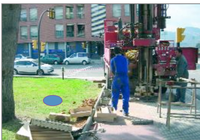
A la ciutat ja s'han realitzat algunes cates per a l'elaboració dels estudis previs a la construcció del metro

La xarxa de transport públic de la ciutat millorarà gràcies a l'arribada del metro i la posada en servei del sistema 'bicing'. Mentre s'inicia el procés per a la construcció de l'allargament de la Línia 3, s'ha presentat el projecte per instal·lar a la ciutat el sistema de transport en bicicleta. Moure's per Sant Joan Despí i per l'àrea metropolitana serà molt més fàcil