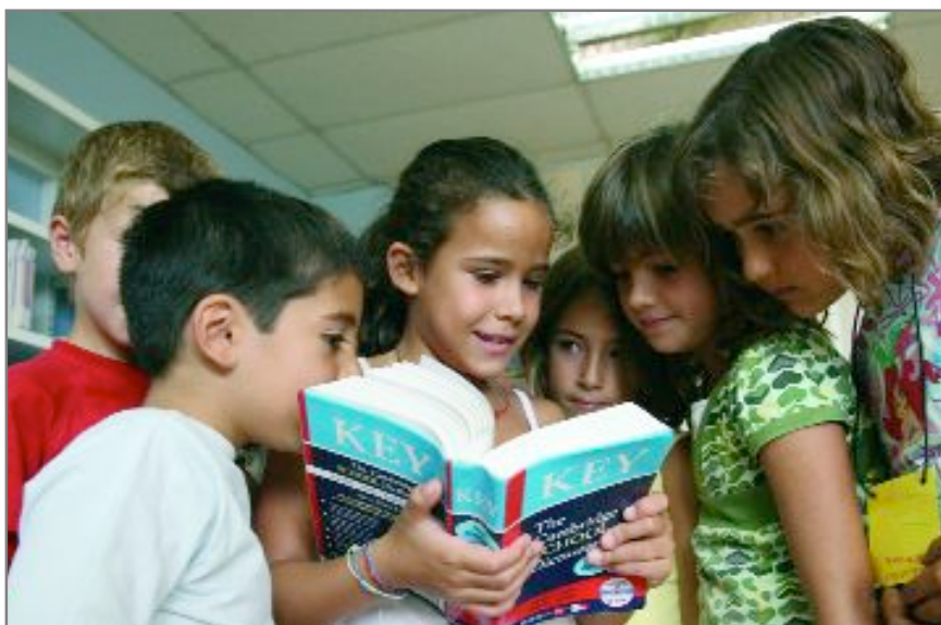
La fotografia de dalt mostra un grup d'infants fent una consulta al diccionari mentre que a la de baix veiem el grup dels grans assajant l'obra Ali Babà i els 40 lladres