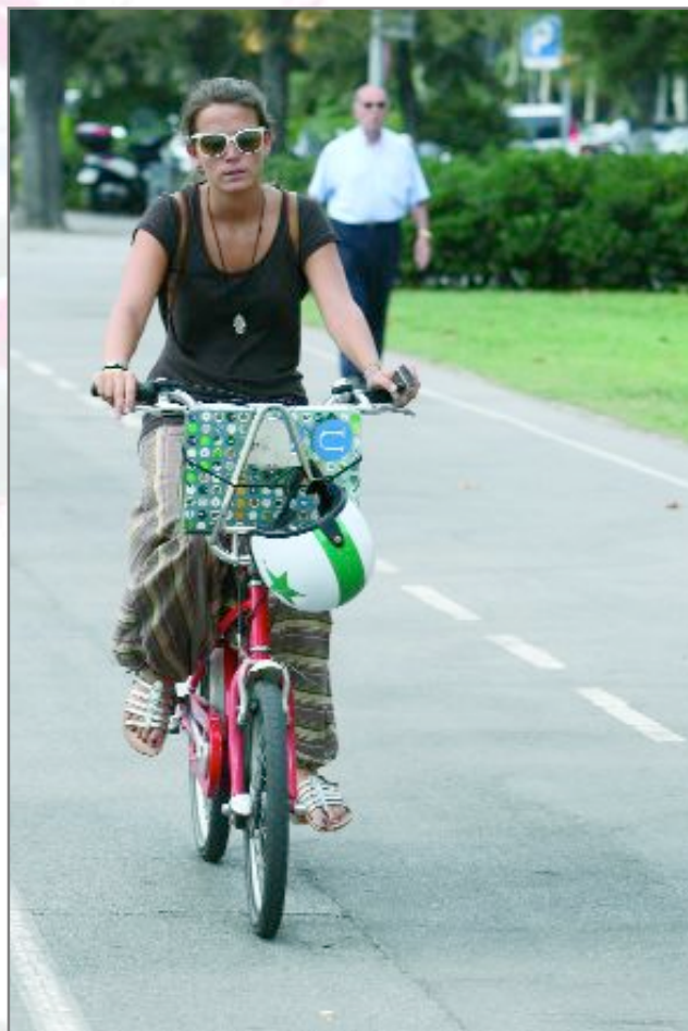
El bicing ha aconseguit una bona resposta ciutadana a Barcelona en afavorir uns desplaçaments urbans més sostenibles

Inicialment el sistema tarifari de l'Àrea Bicing preveu una fracció inicial de temps d'ús gratuït mentre que les fraccions posteriors seran de pagament. El preu encara està per definir, però des de l'Àrea Metropolitana del Transport ja s'ha avançat que es podran fer abonaments anuals, mensuals i diaris. També es valora la incorporació de publicitat a les bicicletes o el patrocini de les