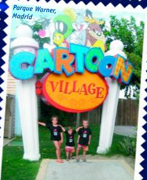
Parque Warner, Madrid