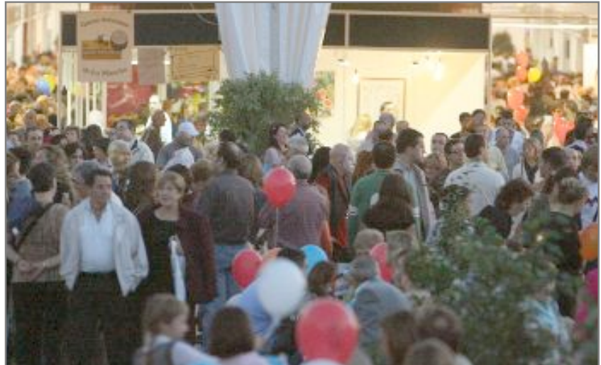
FiraDespí oferirà un ampli ventall d'activitats per a tota la família

L'oferta d'activitats de la fira es complementa amb una granja escola; una mostra d'oficis artesanals, expositors d'artesanaria i alimentació, la possibilitat de muntar en globus i de participar en activitats culturals i lúdiques (vegeu quadre