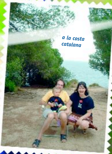
a la costa catalana