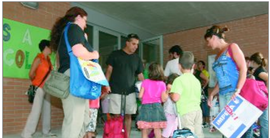
El 15 de setembre van tornar a les aules milers de nens i nenes

Per cicles, 1.037 nens i nenes faran estudis d'infantil, 1.703 de primària, 1.101 de l'ESO als centres educatius públics i concertats de la ciutat. Enguany 225 alumnes s'han matriculat als IES Francesc Ferrer i Guàrdia i Jaume Salvador i Pedrol i a l'Ateneu Instructiu, per iniciar estudis de batxillerat. El dia 22 de setembre va ser el torn dels 157 estudiants de dels cicles formatius de grau mitjà i superior.