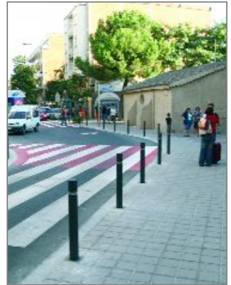
Les obres han millorat la mobilitat al carrer, ara més accessible

En els propers dies finalitzaran els treballs d'arranjament del Torrent d'en Negre, al barri Centre, que també han afectat un tram de Previsió (fins al carrer de Baltasar d'Espanya) i de Catalunya. Les obres s'emmarquen en el Pla de Millora Urbana que s'està duent a terme per millorar l'accessibilitat.