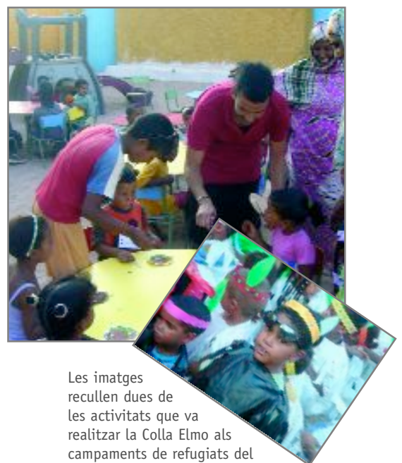
Les imatges recullen dues de les activitats que va realitzar la Colla Elmo als campaments de refugiats del Sàhara aquest estiu

Les vacances d'estiu es poden viure de moltes maneres i, per què no també poden ser un moment per a la solidaritat. Almenys així ho han dedicat 9 integrants de l'entitat solidària Colla Elmo que han viatjat fins als campaments de refugiats sahrauís per dur a terme accions relacionades amb els projectes educatius que desenvolupen. Com a experiència pilot l'associació ha fet activitats de lleure amb 90 infants de tres a vuit anys per tal de donar una alternativa a aquests infants, que per la seva edat no poden marxar de vacances. A més, l'entitat ha decidit engagar un nou projecte: l'electrificació de l'escola de cecs de Smara. D'aquesta manera el centre comptarà amb energia per poder impartir classes d'informàtica amb equips adaptats en Braille. Enguany la Colla Elmo ha dotat de material cinc escoles per a infants amb discapacitats visuals i l'escola bressol d'Omar Sidi Kamaz, en la qual s'ha renovat el mobiliari i el dipòsit d'aigua que abasta l'equipament.