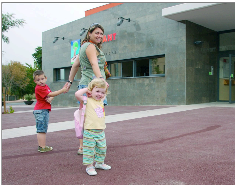
Una nena a punt d'entrar a l'escola bressol El Gegant del Pi

També han començat un nou curs els 527 infants que enguany estan matriculats en alguna de les quatre escoles bressol públiques que hi ha a Sant Joan Despí: El Gegant del Pi, Sol Solet, El Timbal i La Pomera. L'Ajuntament ha fet una important aposta per cobrir la demanda de les famílies en aquest cicle educatiu i enguany s'ha aconseguit donar resposta a més del 98% de les sol·licituds de les famílies santjoanenques. Per aconseguir cobrir gairebé el cent per cent de les places el consistori va reorganitzar i ampliar grups i places en els centres municipals. L'impuls de polítiques que ajudin a conciliar la vida familiar i laboral és una de les prioritats del govern municipal. Per això en els darrers cinc anys s'han construït tres escoles bressol municipals: El Timbal (2003), Sol Solet (2006) i El Gegant del Pi (2008).