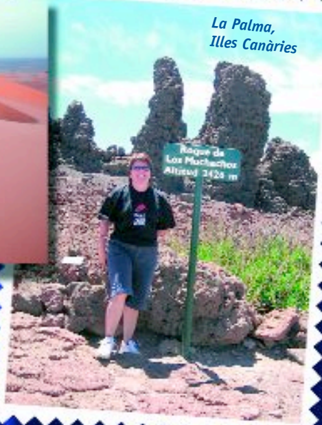
La Palma, Illes Canàries