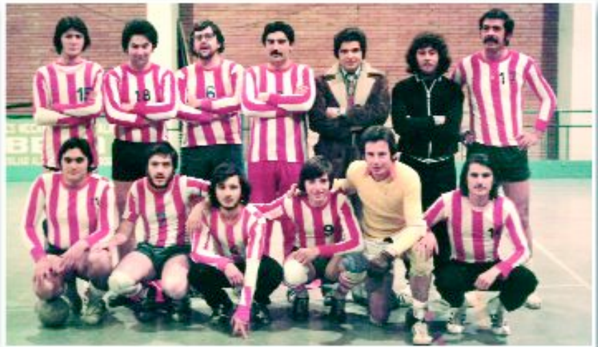
Foto històrica de l'Handbol Sant Joan. Sens dubte, la trobada possibilitarà recordar vells temps

A l'octubre està prevista una exposició a Can Negre commemorativa de l'aniversari.