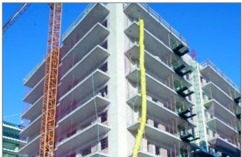
Próxima promoción: El siguiente proceso de adjudicación de vivienda pública será el relativo a los 72 pisos de la calle de la Font Santa, número 48, cuyas obras están ya avanzadas, tal y como se puede observar en la imagen superior