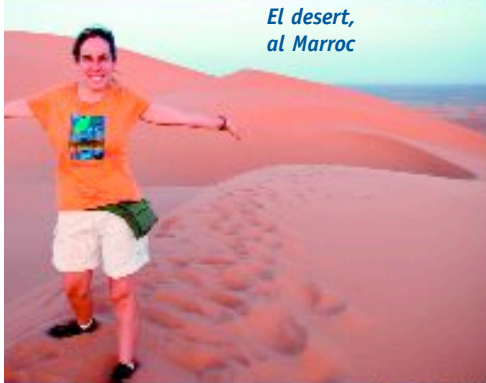
El desert, al Marroc