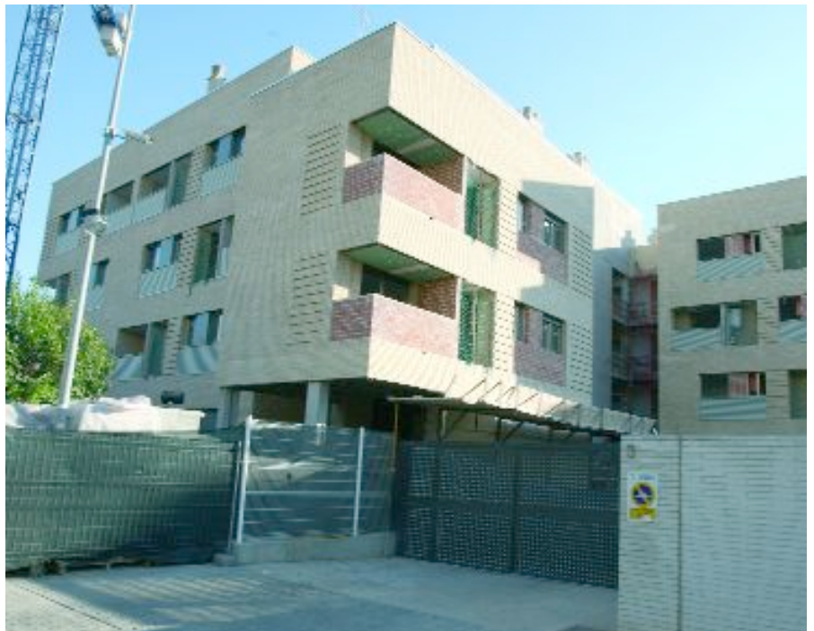
Las obras de las viviendas de alquiler que promueve el Ayuntamiento de la ciudad han entrado ya en la recta final

Tras la adjudicación de estos pisos, la promoción de vivienda a precios asequibles por parte del Ayuntamiento continuará con nuevas promociones como las 72 viviendas que ya se construyen en el número 48 de la calle Font Santa y que, en esta ocasión se destinarán a la venta. También en breve está previsto el inicio de otros proyectos en el eje de la avenida Barcelona, en el que ADSA trabaja en la construcción de tres edificios más, de 12, 25 y 28 pisos. Además, en la confluencia de la calle Creu d'en Muntaner con la avenida de la Generalitat se edificarán 43 viviendas más, éstas dedicadas a alquiler.