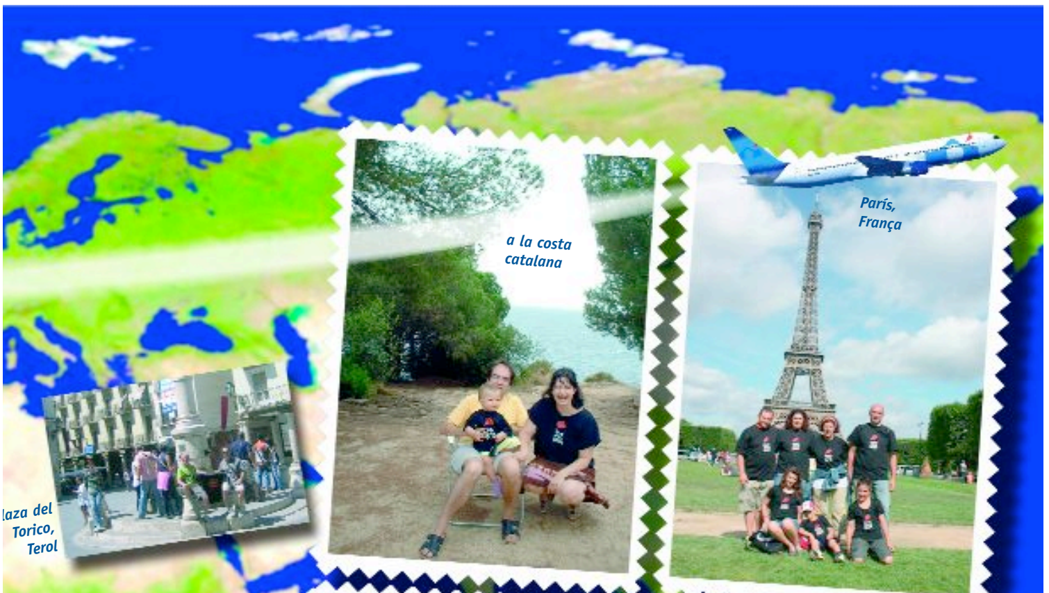
Plaza del Torico, Terol