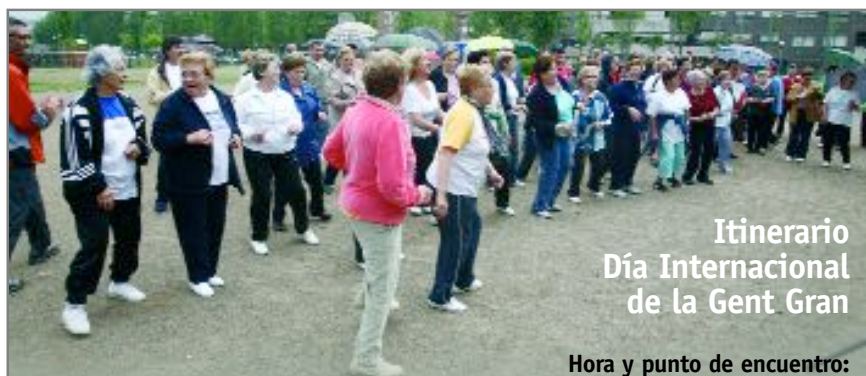
Itinerario Día Internacional de la Gent Gran

Primeras visitas culturales del Pack Senior. Un centenar de personas visitaron el pasado mes de julio el recinto de la Exposición Internacional de Zaragoza en el marco del proyecto Pack Senior, una iniciativa que tiene como objetivo impulsar actividades lúdico-formati-