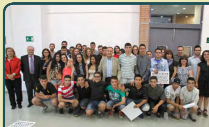
Qualificació i transició al treball (PQPI-PTT)

32 alumnes han finalitzat el Programa de Qualificació Professional Inicial-Pla de Transició al Treball (PQPI-PTT). Aquest ha permès que aquests joves, sense els estudis obligatoris acabats, es formen en auxiliar de vendes, oficina i atenció al públic, i en auxiliar de muntatge d'instal·lacions electrotècniques, durant 925 hores, 225 de les quals han estat pràctiques en diferents empreses. Les responsables del projecte han valorat molt positivament l'evolució de l'alumnat que, no només ha assolit els objectius, sinó que a més s'ha implicat en la vida del barri amb diferents projectes, com un mercat d'intercanvi que a partir de setembre es farà setmanalment. Més informació, a partir del setembre, a les dependències de Promoció Econòmica.