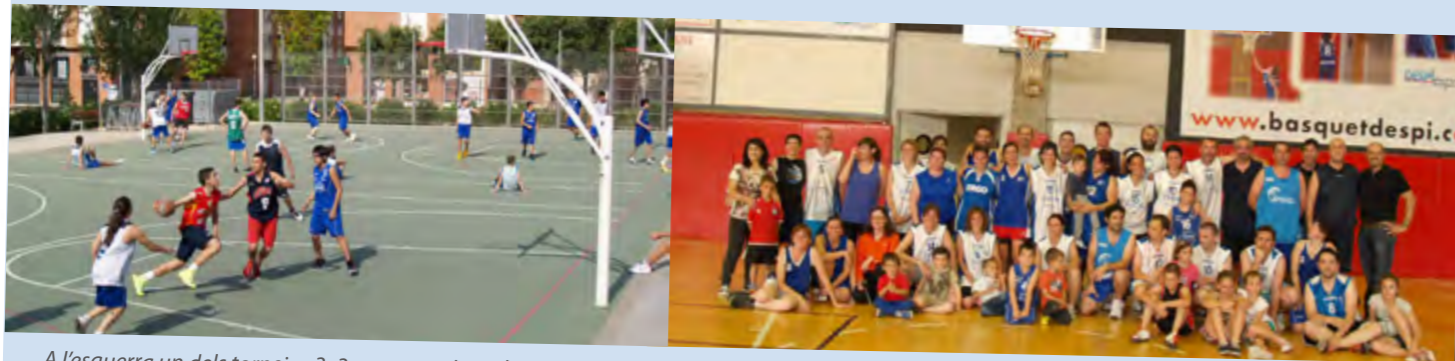
A l'esquerra un dels tornejos 3x3 que organitza el club en diferents pistes. A la dreta, trobada d'exjugadors del club amb motiu de l'aniversari.

El Bàsquet Sant Joan ha fet una temporada molt satisfactòria que reafirma la bona salut dels equips de l'escola del club, consolidant-se com una de les entitats amb més participants i que cada temporada gaudeix d'una massa social més gran.