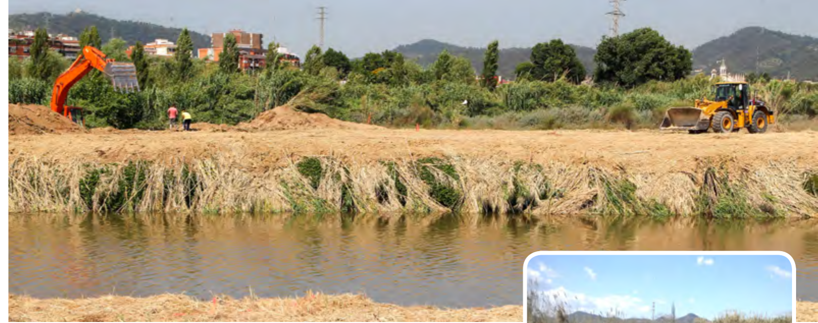
En la fotografia superior, el lloc on se està construint el pas, entre el pont del Ferrocarril i la torre mirador, on es veuen els primers treballs. A la dreta, una imatge virtual de com quedarà la pasarella una vegada construïda