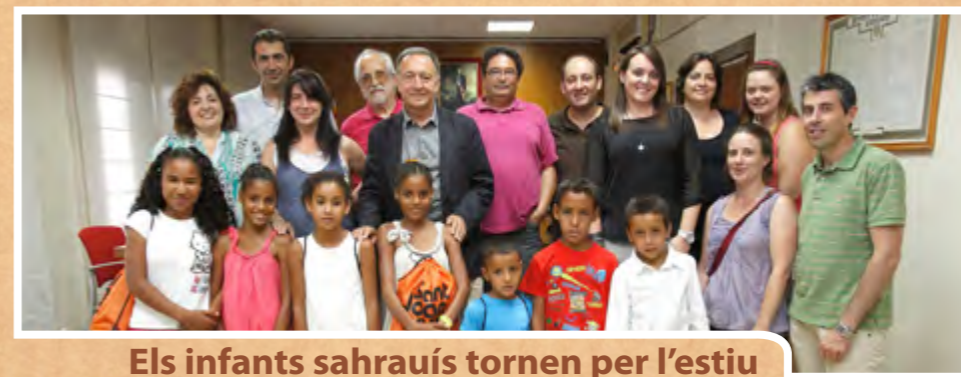
Els infants sahrauís tornen per l'estiu

El col·lectiu Cycle Chic va proposar una sortida pels parcs de la ciutat el 29 de juny, amb un concurs fotogràfic inclòs. Aquesta fotografia, de J. Pedro Carretero, va ser la guanyadora.