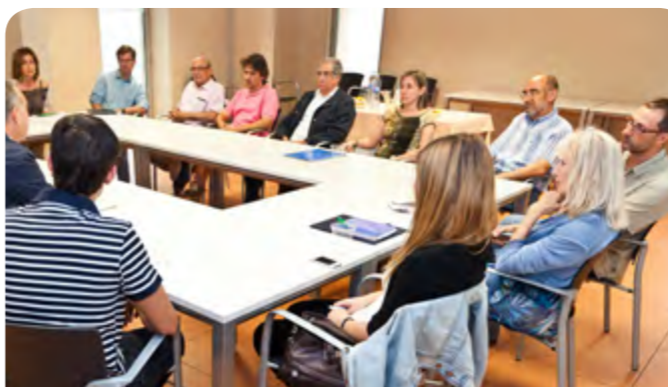
Els participants van fer una trobada per tancar el curs dels grups de conversa

propostes, com una verema, el proper mes de setembre, adreçada a tots els infants que estudien 3r de primària. Els 700 ceps de les varietats merlot i macabeu es van plantar al parc de la Font Santa l'any 2011 amb l'objectiu d'esdevenir un espai educatiu, però també per recordar a la ciutadania aquest cultiu que temps enrere era molt habitual a Sant Joan Despi.