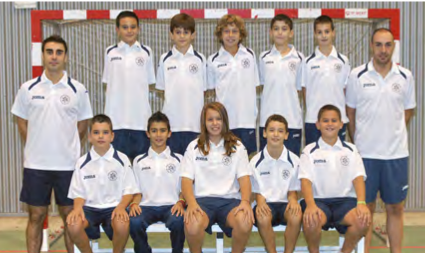
L'Aleví A ha culminat una extraordinària temporada amb l'ascens a Divisió d'Honor