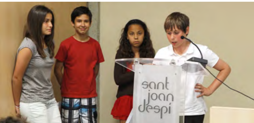
Alguns dels nois i les noies que han participat aquest curs al projecte van explicar la seva experiència durant la cloenda

67 infants i joves participen en la segona edició del programa Acompanyament a l'estudi