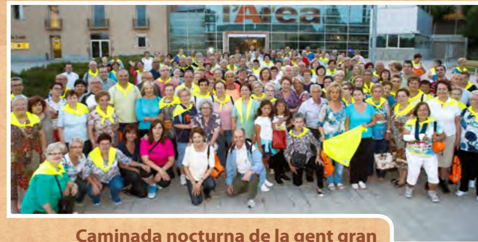
Caminada nocturna de la gent gran

Els joves que enguany celebren la majoria d'edat van participar el 5 de juliol a la Festa 18! a les piscines de la Font Santa. Els 200 joves van participar en concursos per aconseguir entrades al teatre, tallers gratuïts al Bule, i fins i tot, un d'ells va guanyar una bici. Remullada a la piscina i tallers de còctels sense alcohol, de capoeira, etc. van fer de la festa una nit inoblidable.