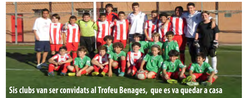
Sis clubs van ser convidats al Trofeu Benages, que es va quedar a casa

El 8 de juny es va celebrar el III Torneig Cebrià Benages, en què sis equips visitants es van enfrontar als sis alevins de la UE Sant Joan Despí. L'Aleví B es va proclamar campió després de guanyar una molt disputada final l'Aleví A (els dos equips a la foto). Van participar-hi com a convidats Ódena, Santboià, Cornellà, Mira-sol Baco, Esparreguera i Europa.