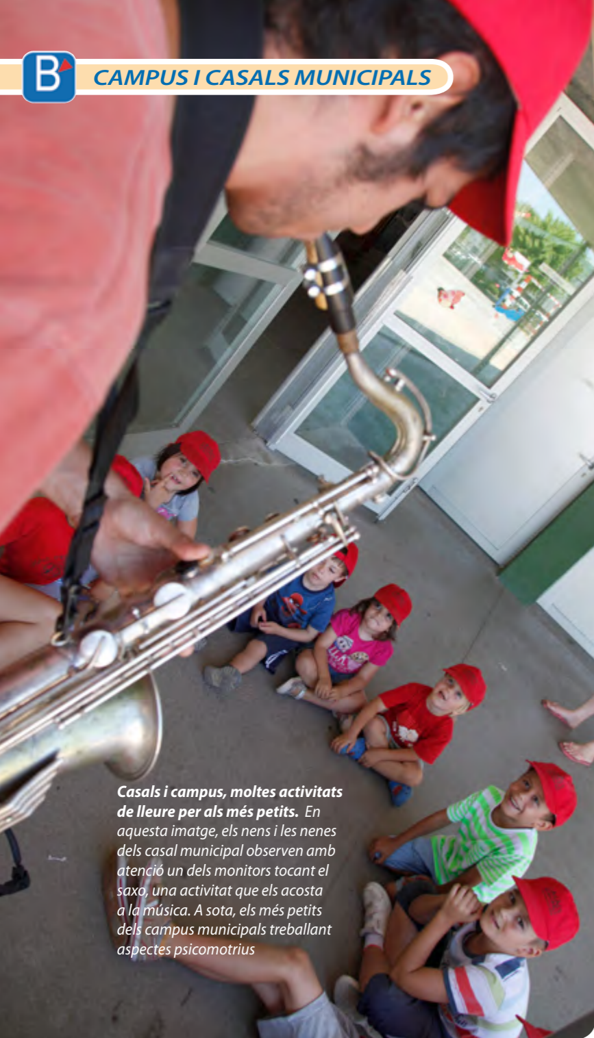
Casals i campus, moltes activitats de lleure per als més petits. En aquesta imatge, els nens i les nenes dels casals municipals observen amb atenció un dels monitors tocant el saxo, una activitat que els acostava a la música. A sota, els més petits dels campus municipals treballant aspectes psicomotrius

Festa de cloenda 26 de juliol al parc del Mil·lenari