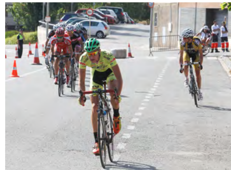
El nou circuit va ser valorat molt positivament pels ciclistes

Enguany s'estrenava circuit, de 90 quilòmetres (45 voltes) amb sortida i arribada a l'avinguda de la Mare de Déu de Montserrat, i era desconegut pels participants. Aquests van quedar molt contents i van comentar que era un circuit molt exigent.