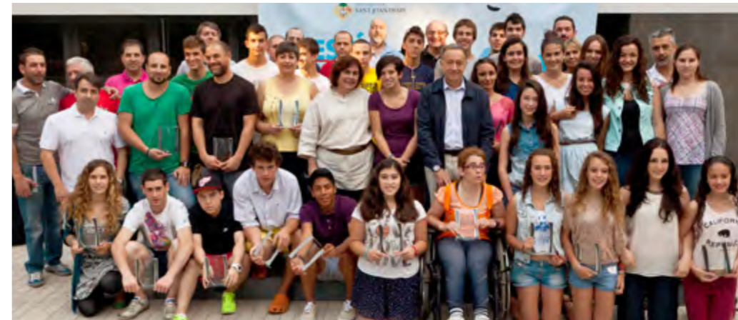
Els premiats, amb l'alcalde i els regidors municipals

El consistori va oferir un acte de reconeixement a esportistes i entitats esportives que van aconseguir ascensos o fites importants durant la temporada 2012-2013