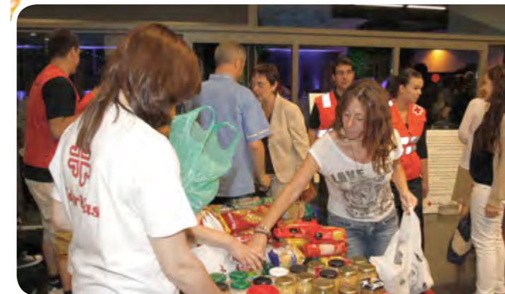
Imágenes solidarias. De arriba a abajo: voluntarios clasificando los alimentos que la Taula Social ha reunido en los últimos días; recogida en la recepción de entidades, y gala benéfica organizada por Balldespí