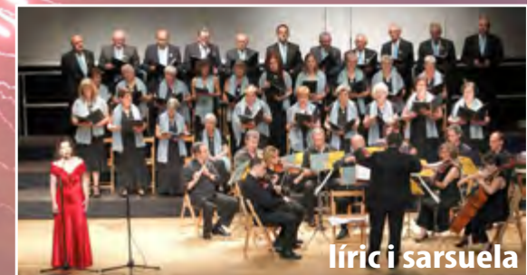
líric i sarsuela