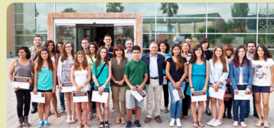
Premis d'excel·lència educativa

22 nois i noies de l'ESO, batxillerat i cicles formatius de grau mitjà i superior van rebre, el 27 de juny, els premis d'excel·lència educativa que acrediten que els seus han estat els millors expedients acadèmics dels centres educatius on han estudiat. Aquests guardons van sorgir ara fa quatre anys amb l'objectiu de posar en valor una feina constant que l'alumnat realitza durant tot el cicle educatiu. Per premiar aquest esforç, els nois i les noies reben un diploma i abonaments a la piscina, una entrada de teatre i la possibilitat de participar en un taller d'El Boulevard, depenent del cicle educatiu. Una altra manera de fer ciutat.