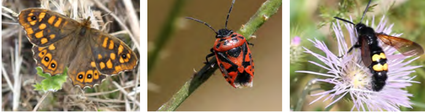
Aquestes són algunes de les espècies que es van catalogar durant el testing de biodiversitat que van fer al maig els ciutadans. D'esquerra a dreta veiem la Pararge aegeria (papallona de l'agram), la Eurydema ornata (xinxsa roja) i la Megascolia maculata flavifrons (vespa)