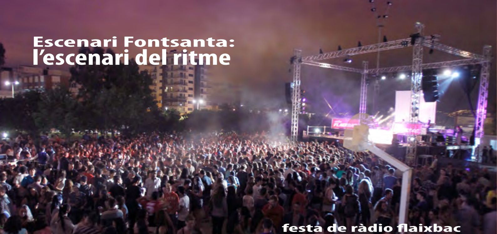
festa de ràdio flaixbac