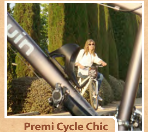
Premi Cycle Chic

Al voltant de 250 persones grans es van sumar, el 2 de juliol, a la cloenda de la temporada de passejos per la ciutat amb una caminada nocturna que va acabar amb un sopar de carmanyola al parc de la Font Santa. La nova temporada s'encetarà a l'octubre.