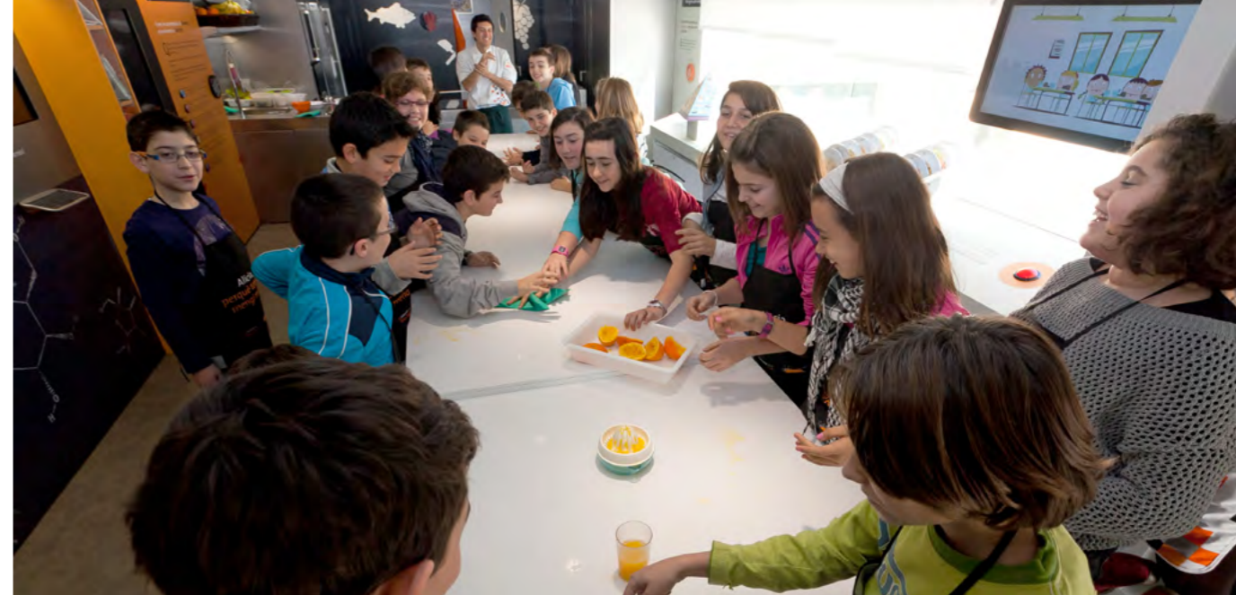
Escolars de la ciutat, en un dels tallers per aprendre bons hàbits alimentaris

Dins de les activitats commemoratives del Dia Internacional de les Dones, el 4 de març, a les 19 hores s'organitza una sortida al concert d'Espirituals Negres "The Gospel Viu Choir" al Palau de la Música Catalana. Si vols participar cal fer reserva a l'Àrea de Serveis a la Persona fins al 31 de gener. El preu de l'entrada és de 15 euros. El grup de dones sortirà des de l'estació de Rodalies a les 18 hores.