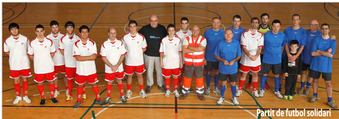
Partit de futbol solidari

La campanya de recollida de joguines de Creu Roja Joventut i Ràdio Despí va recollir més d'un centenar de joguets • 12.747,84 euros per a la investigació del càncer • Entitats, empreses i ciutadans i ciutadanes recullen una tona d'aliments per a les persones més vulnerables de Sant Joan Despí