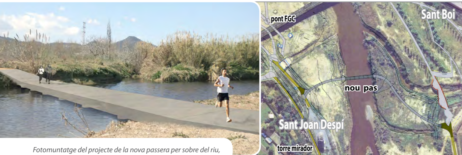
Fotomuntatge del projecte de la nova passera per sobre del riu, a la dreta, l'espai on s'ubicarà

La previsió és que la passera, per a ciclistes i vianants, es construeixi el proper estiu • L'accés permetrà millorar la connexió amb l'estació dels Ferrocarrils a Sant Boi