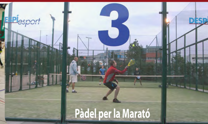
Pàdel per la Marató

26 de gener, festival solidari a l'Auditori Miquel Martí i Pol