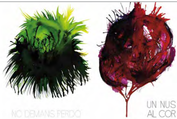
Sobre aquestes línies algunes de les obres que podrem veure a l'exposició. A la dreta, imatge de Clàudia Torner