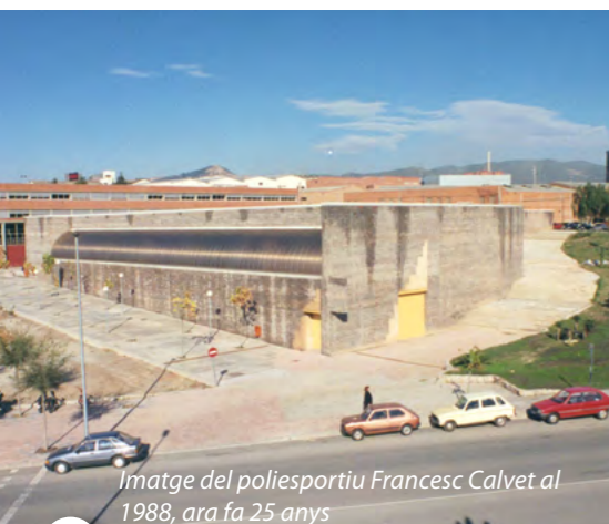
Imatge del poliesportiu Francesc Calvet al 1988, ara fa 25 anys

D'altra banda, el poliesportiu Salvador Gimeno compleix 10 anys de servei de qualitat a l'esport de la nostra ciutat. Fruit de la gran dinàmica de demanda esportiva que va generar el Calvet, va néixer per complementar i millorar l'oferta esportiva de la ciutat, tot donant una gran salt en la quantitat però, sobretot, en la qualitat de l'oferta esportiva de la ciutat. Per celebrar aquests aniversaris es realitzaran al llarg de l'any actuacions destinades a donar a conèixer tota la seva àmplia oferta d'activitats, campanyes per potenciar-ne la utilització i, tot plegat, que la ciutadania de Sant Joan Despí gaudeixi, encara més, d'aquestes dues instal·lacions que són, des de fa anys, els equipaments més utilitzats de Sant Joan Despí.