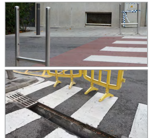
Dos ejemplos de actos vandálicos sufridos en los últimos meses

Desgraciadamente Sant Joan Despí también está siendo víctima, como otras poblaciones de Catalunya, de un tipo de actos vandálicos que se atribuyen a la crisis: el robo de elementos del espacio público. En los últimos meses ha proliferado el robo de papeleras, tapas o rejillas del alcantarillado que, a pesar del aumento de la vigilancia policial, es difícil erradicar. Este material es vendido después como chatarra. Precisamente, y gracias a la colaboración ciudadana y de la Policía Local, los Mossos d'Esquadra han detenido al presunto autor del robo de papeleras en Sant Joan Despí y otras localidades. A pesar de que los robos no son numerosos, sí que suponen un problema de civismo que reduce el servicio que el Ayuntamiento ofrece a la ciudadanía. Precisamente este tipo de robos tan específicos han provocado otro problema: las empresas proveedoras han visto desbordadas las peticiones de reposición por lo que hay una falta de stock. No obstante, el Ayuntamiento trabaja para intentar buscar otras alternativas y recobrar la normalidad en los servicios afectados que, pese a no ser graves, sí alteran la calidad habitual que se ofrece en este ámbito.