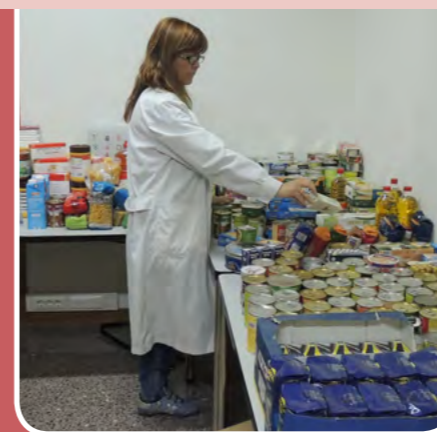
Els treballadors i treballadores de l'empresa Invent-Farma van recollir 550 quilos d'aliments

Però la solidaritat, per sort, no és només cosa de Nadal. En el seu primer any de feina, la Taula de Coordinació Social va recollir més de 4.000 quilos d'aliments, i en els darrers sis mesos empreses i col·lectius han continuat fent lliuraments per ajudar els més necessitats. Gallina Blanca ha lliurat 3.482 quilos de macarrons i 150 d'altres productes; l'Associació La Nau ha donat 150 lots de productes d'higiene personal; els treballadors de l'empresa Invent-Farma van recollir 550 quilos; l'empresa Lamirsa ha aportat 60 lots d'aliments; la sabateria Sabatana ha lliurat calçat, i l'associació de veïns i veïnes El Pi 60 lots de menjar i 300 euros per a l'adquisició d'electrodomèstics de segona mà. Encara, però, ens queda una cita solidària: el 26 de gener, a les 18.30 h, a l'Auditori Miquel Martí i Pol, l'Associació de Veïns i Veïnes de les Planes farà un festival solidari amb les actuacions de l'Esbart Dansaire i el Centro Cultural Vicente Aleixandre. Els diners es destinaran a la compra de productes bàsics d'alimentació.