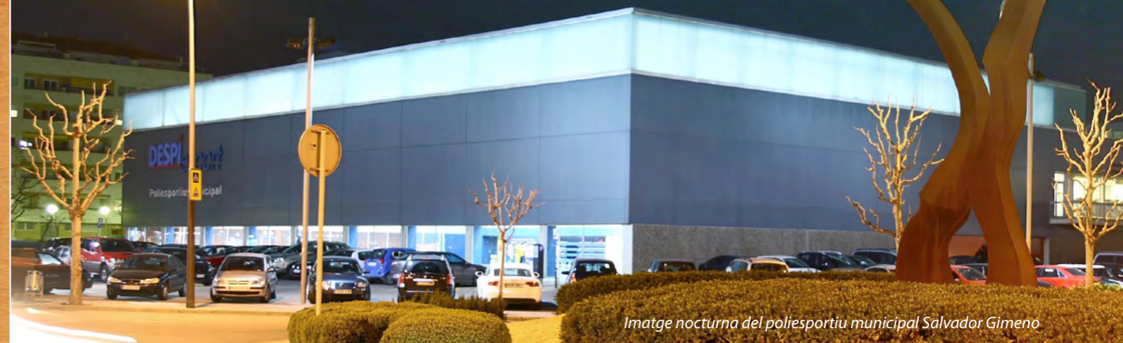
Imatge nocturna del poliesportiu municipal Salvador Gimeno

E ls poliesportius municipals de Sant Joan Despí enceten la campanya A l'hivern fés esport. No et quedis a casa . Durant els mesos de febrer i març la matrícula als poliesportius Francesc Calvet i Salvador Gimeno serà gratuïta per a totes les inscripcions que es facin, per qualsevol dels tipus d'abonaments existents i per a qualsevol modalitat.