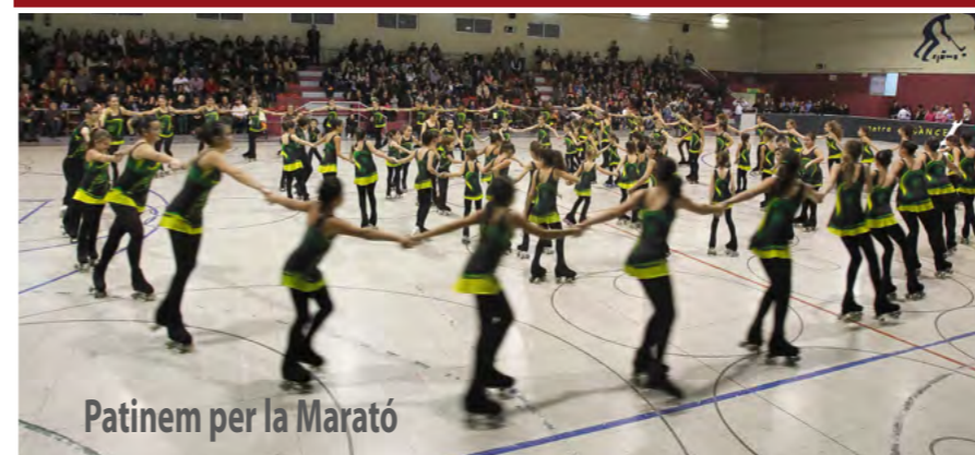
Patinem per la Marató