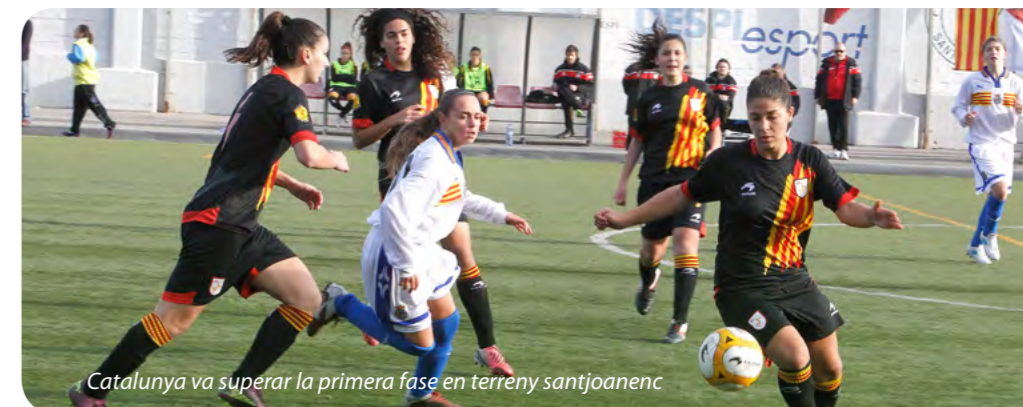
Catalunya va superar la primera fase en terreny santjoanenc

Era la tercera ocasió que la Federació Catalana de Futbol escollia la instal·lació santjoanenca com a seu del campionat nacional i el FC Levante Las Planas per organitzar conjuntament l'esdeveniment. Una vegada més Sant Joan Despí va donar sort a les nostres seleccions, ja que Catalunya va fer el ple de punts, sis, en derrotar Astúries i Aragó amb comoditat. Durant els dos dies hi va haver un gran ambient a les grades, sobretot quan van jugar les catalanes, amb gran presència també d'asturians, aragone-