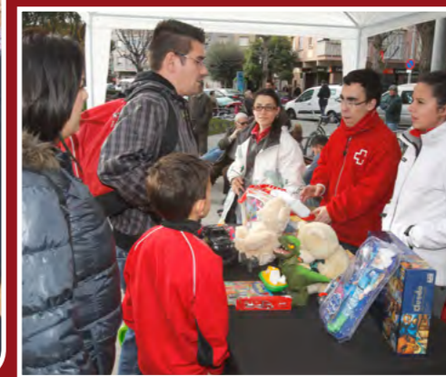
Recollida de joguines i aliments