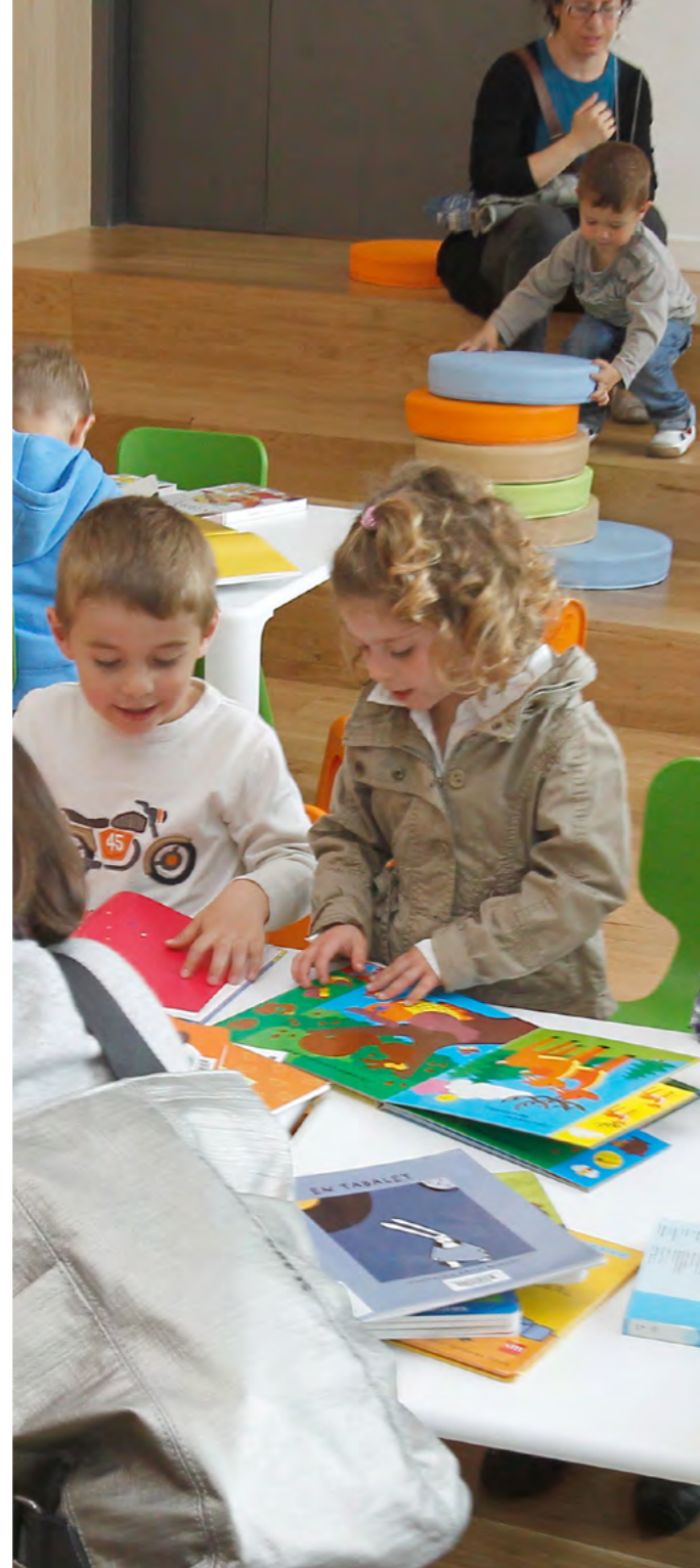
L'objectiu es promoure que infants i famílies comparteixin més moments

Paral·lelament, el 23 de gener i el 21 de febrer s'organitzen dues xerrades (educació emocional i normes límits) adreçades als pares i mares dels alumnes que participen en el projecte contra el fracàs escolar Acompanyament a l'estudi que des del curs passat dona suport a alumnes de 5è i 6è per millorar el seu rendiment escolar a través de classes personalitzades en les biblioteques.