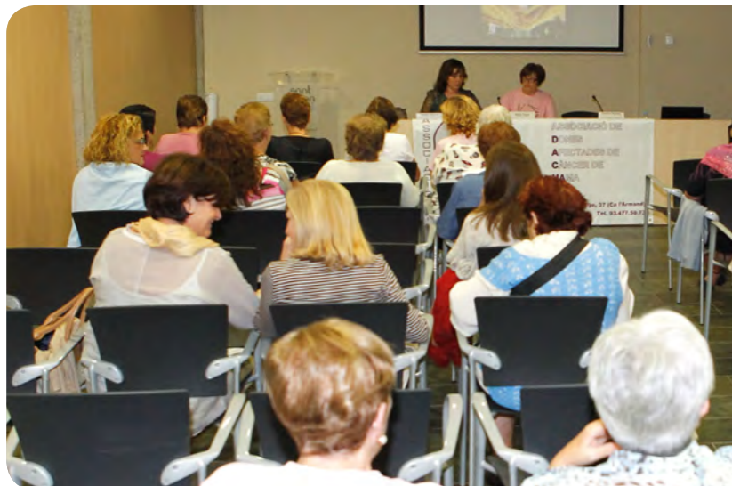
Imatge d'arxiu d'una xerrada a la Sala d'Actes de l'Àrea de Serveis a la Persona

El Departament d'Acció Social inicia un cicle de xerrades a l'Àrea amb una psicòloga per ajudar a resoldre diferents tipus conflictes familiars