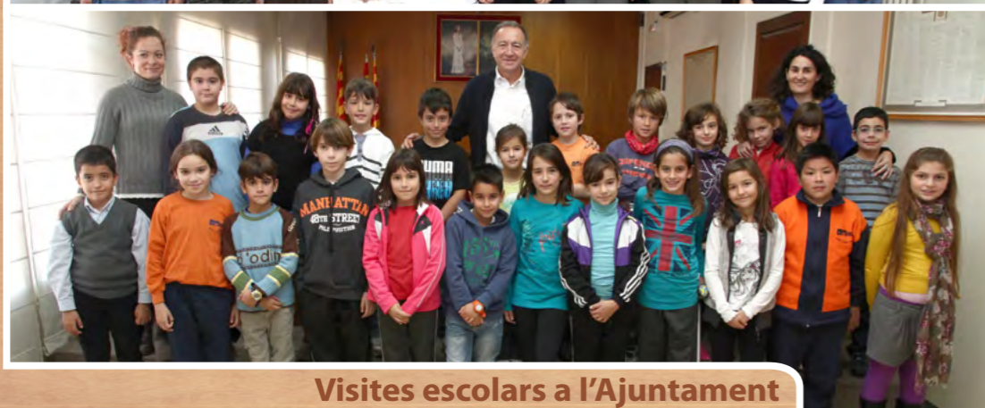
Visites escolars a l'Ajuntament

Els dos grups de tercer de l'escola Pau Casals van tancar, el 4 de desembre, la temporada de visites escolars a l'Ajuntament de l'any 2012 que el Departament d'Educació i Família promou entre els centres educatius any rere any. Aquesta iniciativa permet als nens i les nenes conèixer més sobre el funcionament dels serveis que s'ofereixen a la ciutadania i aprofiten per fer tota mena de preguntes a l'alcalde, Antoni Poveda. Les visites del 2013 s'iniciaran el 14 de febrer amb l'Espai 3.