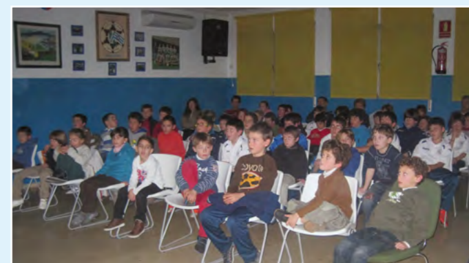
L'escola complementa l'esport amb activitats formatives