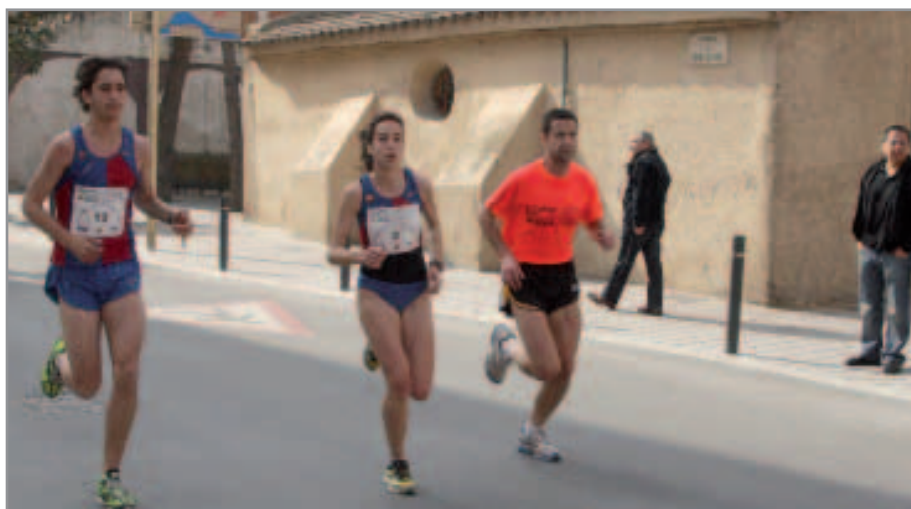
Sant Joan Despí vuelve a acogerse a una prueba atlética relacionada con el Barça

Hasta ahora, la cursa se desarrollaba dando dos vueltas de cinco kilómetros en el barrio de Les Planes y en su nuevo formato se dará una vuelta de