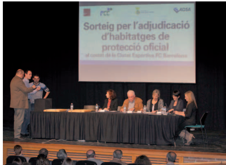
Un momento del sorteo ante notario celebrado en el Auditori Martí i Pol

E l 26 de marzo, el Auditori Miquel Martí i Pol volvió a llenarse para acoger un nuevo sorteo de una promoción de viviendas con protección oficial. En este caso, una que construirá la empresa Fomento de Construcciones y Contratas (FCC) entre la avenida Sol y la antigua BV-2011, en la zona de la Ciutat Esportiva Joan Gamper. Se trata de una promoción privada, en régimen de comunidad de bienes, aunque el proceso de presentación de solicitudes y el sorteo lo ha realizado la empresa municipal ADSA. 299 personas (157 de Sant Joan Despí y 142 de otras ciudades catalanas) optaron a uno de estos pisos, de unos 85 metros cuadrados útiles, de tres dormitorios (tan solo dos disponen de dos habitaciones), terraza, dos baños, aparcamiento y trastero. Una modificación del plan general metropolitano de la Ciutat Esportiva permite la construcción de viviendas protegidas en suelo privado, como es este caso.