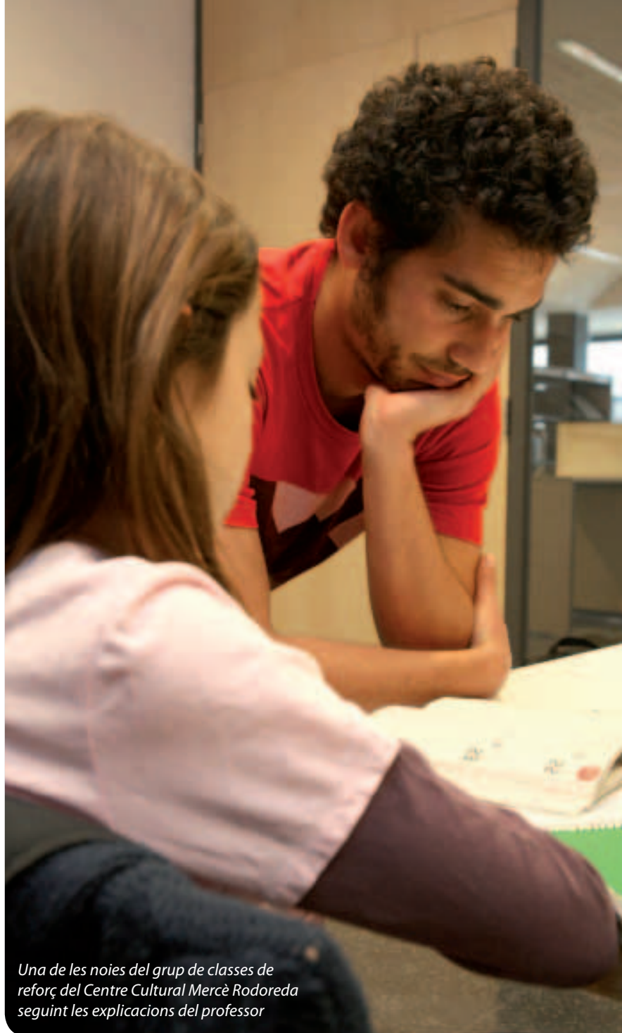
Una de les noies del grup de classes de reforç del Centre Cultural Mercè Rodoreda seguint les explicacions del professor

Així, durant aquests quatre mesos els 80 alumnes, d'escoles públiques i concertades, que fan el reforç a les instal·lacions dels centres culturals Miquel Martí i Pol i Mercè Rodoreda són avaluats constantment per tal de tenir un seguiment exhaustiu de la seva evolució. De moment el projecte es desenvolupa amb alumnat dels últims cursos de primària perquè aquests són clau, l'avantsala de la secundària obligatòria. Un cop finalitzat el projecte es farà una valoració conjunta que servirà per assentar les bases de futures accions encaminades a millor l'educació dels nostres fills i filles.