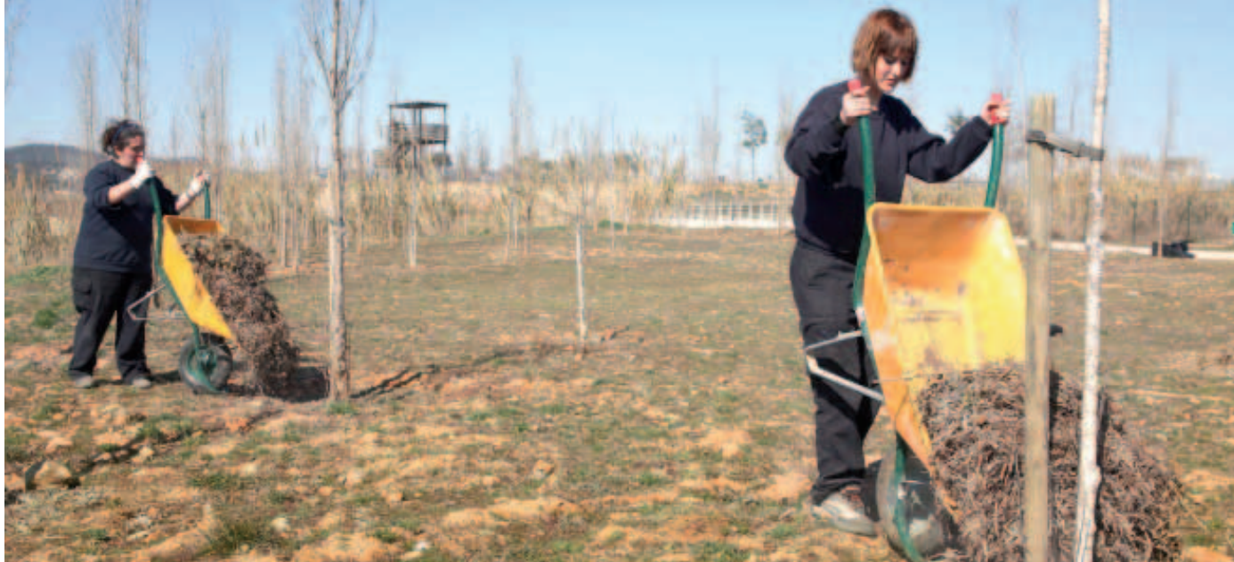
Dues operàries distribueixen l'adob entre els arbres del Bosc dels Infants

Iniciatives que milloren les zones verdes