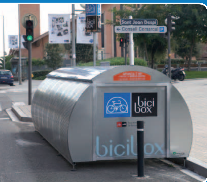
Bicibox ha estrenat un nou telèfon d'atenció a l'usuari, el 903 480 15 59

en altres de la ciutat. D'aquesta manera, aquest bosc, una de les zones verdes més joves de la ciutat, tindrà més nutrients que ajudarà a créixer amb més força els arbres. Aquest triturat també protegeix i evita l'evaporació de l'aigua de reg i ajuda a mantenir la humitat en l'època de més calor.