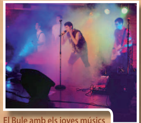
El Bule amb els joves músics