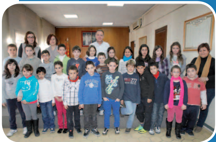
Escola Espai 3