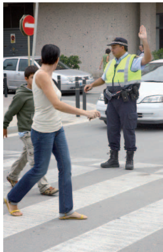
La seguridad viaria es uno de los principales ámbitos de actuación de la policía local

Por último, los Mossos d'Esquadra han detenido a dos hombres tras cometer cinco atracos con violencia e intimidación en Cornellà y Sant Joan Despí. Ambos ya se encuentran en prisión.