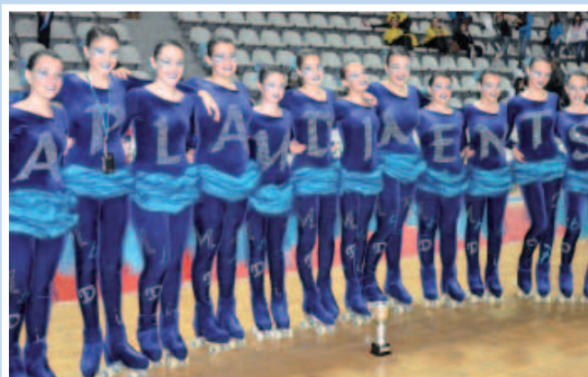
Les noies del Club Patinatge Artístic segueixen assolint títols

Nou èxit del Club de Patinatge Artístic de Sant Joan Despí. Del 23 al 25 de març s’ha celebrat a Vigo la Copa d’Espanya i el grup santjoanenc de xou s’ha proclamat subcampió d’Espanya juvenil. En aquesta modalitat de xou es fa una coreografia que representa un tema i les noies de Sant Joan Despí van escollir “El poder de les paraules”. Amb aquesta coreografia ja van aconseguir podi el passat mes de febrer, amb un tercer lloc que va permetre la seva participació a la màxima competició estatal. A Vigo només va ser superat l’equip santjoanenc per una altra formació catalana, el Club Patí Tona. Ara les noies comencen a preparar el Campionat d’Europa que tindrà lloc el 27 i 28 d’abril a Blanes.