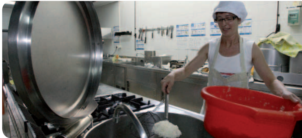
Este curso se destinan más de 153.000 euros a complementar las ayudas de beca comedor

A poyar a las familias. El Ayuntamiento de Sant Joan Despí, a través del Departamento de Acció Social, ha incrementado, un año más, la partida destinada a ayudar a sufragar el gasto del comedor escolar entre el alumnado de primaria y secundaria. Este año se dedicarán más de 153.000 euros, un 25% más que el curso anterior, –que era de 116.000 euros– a cubrir las necesidades de familias que en momentos de crisis necesitan más que nunca de esta aportación. Al margen de las becas que otorga la Generalitat de Catalunya a través del Consell Comarcal del Baix Llobregat, el Ayuntamiento destina fondos municipales que financian entre el 16% y el 100% del gasto de comedor a familias que cumplen los criterios económicos y sociales. Este curso se han concedido 321 ayudas dando cobertura a todas las solicitudes que cumplían los requisitos gracias a la previsión del Ayun-