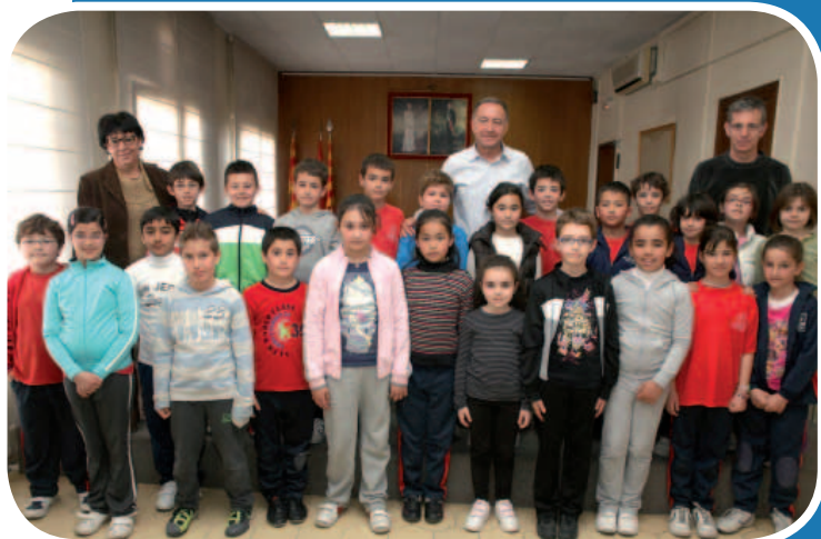
Escola Sant Francesc d'Assís