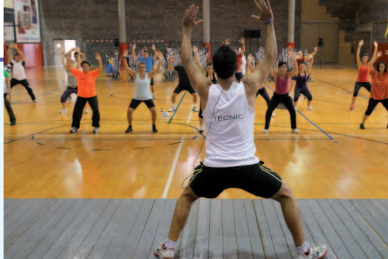
Exhibició de tábata, una activitat nova als poliesportius

L'Ajuntament ha arribat a un acord amb una empresa especialitzada en formació, perquè aquests cursos es desenvolupin a les nostres instal·lacions, amb la qual cosa faciliten als nostres tècnics el seu accés i la seva formació continuada.