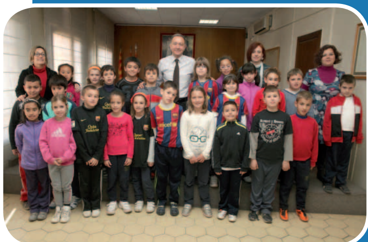
Escola Joan Perich Valls