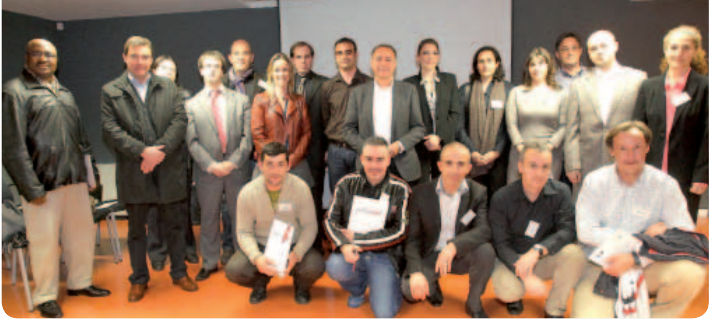
Grup de persones que va rebre un reconeixement públic en haver creat un negoci amb el suport del servei municipal de creació d'empreses