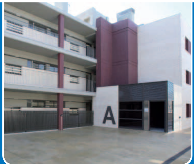
La promoción se entregó el año pasado

Las viviendas, ubicadas en la promoción de pisos protegidos de la avenida de la Generalitat, número 20, tienen entre 50 y 60 metros cuadrados, además de trastero y aparcamiento. Las personas mayores de 65 años, jubilados y/o pensionistas, interesadas pueden presentar la solicitud hasta el 30 de abril en la Oficina Local de Vivienda (Centre Miquel Martí i Pol). Entre los requisitos que hay que cumplir se encuentra residir en Sant Joan Despí (acreditada mediante certificado de empadronamiento con antigüedad mínima, continua o discontinua, de cinco años), no ser propietario de ninguna vivienda, excepto que ésta no sea accesible, y tener unos ingresos anuales inferiores a 4,21 veces el