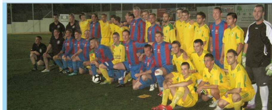
Convivència i germanor han estat predominants en els partits amb els equips anglesos

El 29 de setembre es va celebrar el Trofeu Mansa amb la disputa d'un amistós entre el Sant Pancraç i l'equip amateur anglès Quantum Football Club, fet que encaixa en la voluntat del club santjoanenc de participar en el programa de foment de la parla de l'idioma anglès a la nostra ciutat. El resultat en aquests partits és el de menys, i el que es pretén és agermanar diferents cultures utilitzant l'esport. Tot i el voluminós resultat a favor del Sant Pancraç, que es va imposar