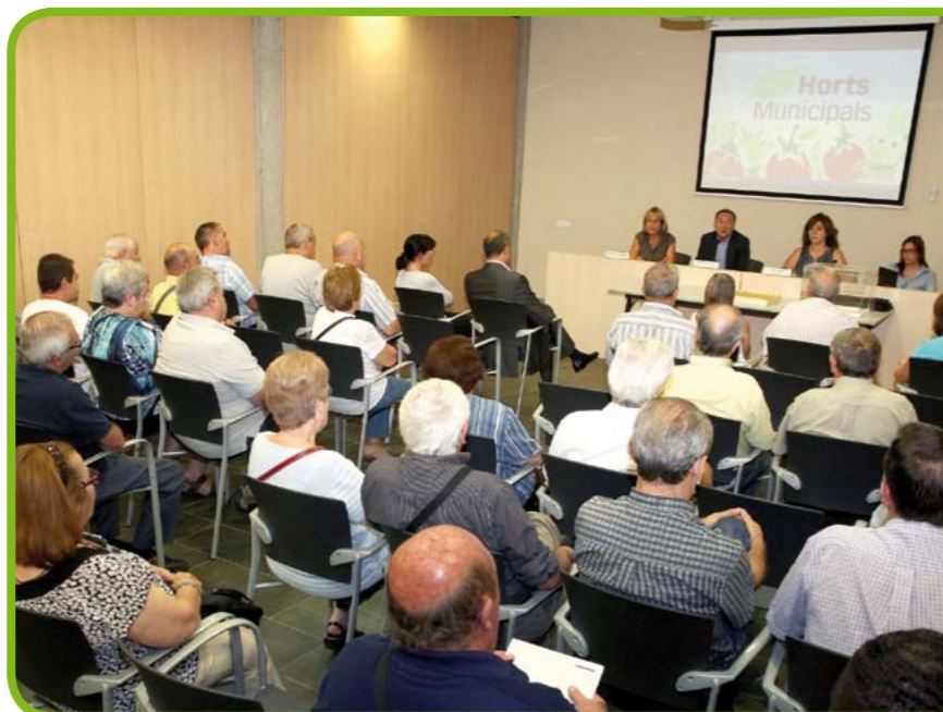
En la imagen, los participantes en uno de los momentos del sorteo

El Ayuntamiento está a punto de finalizar las obras de 32 nuevos huertos urbanos municipales para la gent gran en la zona del Pont Reixat, en el parque de la Fontsanta. Antes de que empiecen a ser cultivados, el 5 de octubre se hizo un sorteo público para adjudicar las parcelas. 48 personas que cumplan con los requisitos (entre otros, ser pensionista o jubilado mayor de 60 años o personas mayores de 65 años con una residencia mínima de cinco años en la ciudad) optaron a conseguir, en concesión, uno de estos huertos, un proyecto que nació como una alternativa de ocio para este colectivo a la vez que para recuperar el estrecho lazo que tiene Sant Joan Despí con la agricultura. Las parcelas, de unos 80 m 2 , se entregarán este mes de noviembre. Dotadas con una cometida de agua, los nuevos pagesos contarán con otros servicios como habitáculos donde guardar las herramientas, compostadores y una zona con mesas donde poder compartir los frutos que recojan.