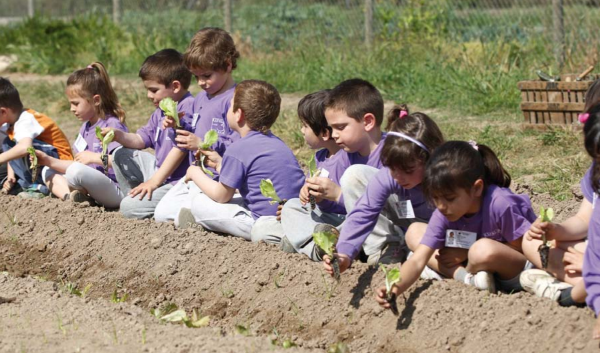
Infants conscienciat. Des de fa 15 anys, l'Ajuntament de Sant Joan Despí, amb la col·laboració del Centre Mediambiental L'Arrel, ofereix a les escoles multitud d'activitats i programes relacionats amb el medi ambient i la sostenibilitat

En marxa la Xarxa d'Escoles per a la Sostenibilitat de Sant Joan Despí