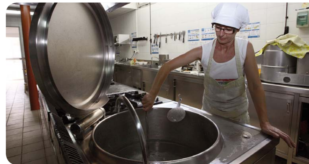
Las ayudas de comedor sufragan entre un 36% y un 100% el precio total del servicio

De las 340 solicitudes que se han recibido este curso, se han otorgado ayudas a 270 niños y niñas cuyas familias cumplían con los requisitos exigidos para acceder a esta beca. Las prestaciones financian entre un 36% y un 100% los gastos de comedor en función de la