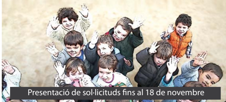
Presentació de sol·licituds fins al 18 de novembre

Més informació i inscripcions, al Departament d'Educació i Família (Àrea de Serveis a la Persona, avinguda de Barcelona, 41, telèfon 93 477 00 51)