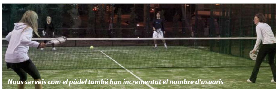
Nous serveis com el pàdel també han incrementat el nombre d'usuaris

Ara més persones tenen la possibilitat de gaudir d'aquestes magnífiques instal·lacions que han millorat la qualitat global del servei que presten.