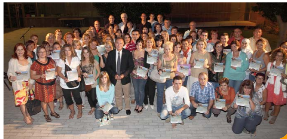
Foto de grupo de los participantes que asistieron al acto de reconocimiento al esfuerzo por la formación en el patio del Centre Cultural Mercè Rodoreda

Por otro lado, la junta de paradistas del mercado del Centre organizará el 12 de noviembre por la mañana un aperitivo popular entre su clientela. Esta actuación forma parte de las actividades de dinamización comercial de este sector que, a lo largo del año, ha realizado todo tipo de promociones como los "puntos naranjas" (descuentos en los productos que incorporan un punto naranja en el mercado de les Planes), entre otras.