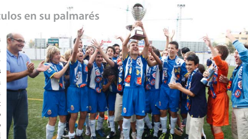
El Espanyol se proclamó campeón del Babot y acumula ya cinco trofeos

El infantil A del Espanyol se adjudicó el XI Torneig Joan Babot, que organiza la Peña Blanc Blava de Sant Joan Despí, después de imponerse por 1-0 al Athletic de Bilbao en un partido muy igualado. Con este triunfo, los blanquiazules se convierten en los reyes del torneo, con cinco títulos en su palmarés. La selección de Sant Joan Despí, formada por jugadores cadetes de la UE Sant Joan Despí y del Levante Las Planas, dieron de nuevo una muy buena impresión y consiguieron un meritorio tercer puesto. En el primer partido perdieron 1-2 con el Bilbao y en el que dilucidaba el tercer puesto empataron a uno con el campeón de la pasada edición, la DAMM, consiguiendo finalmente la victoria en la tanda de penaltis. Éxito una vez más deportivo, organizativo y de público en el torneo. Por otro lado, la asamblea ex-