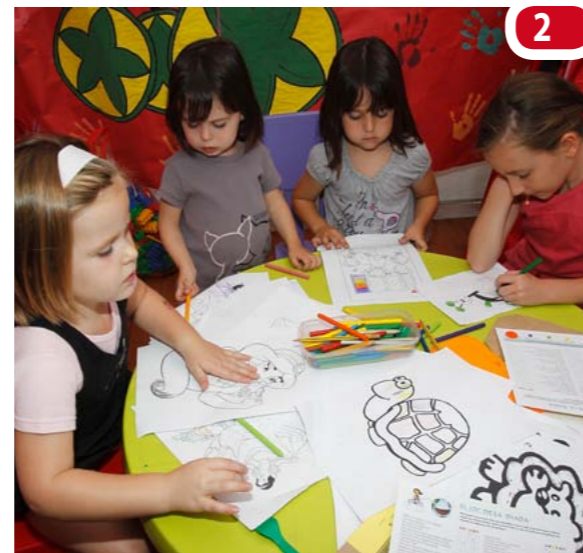
1. La rambla Josep M. Jujol, plena a vessar 2. Els infants també van ser protagonistes durant la Diada 3. Una de les actuacions a la plaça del Sol Solet, la del Centro Cultural Andaluz Vicente Aleixandre