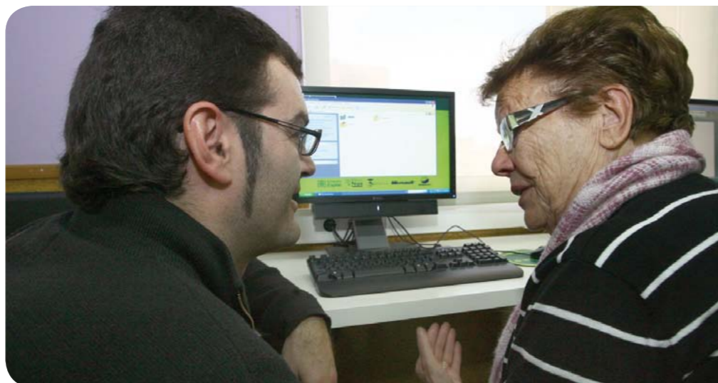
La informática sigue siendo el taller más demandado por la gent gran

La gent gran ya ha iniciado una nueva temporada de los talleres que, año tras año, organiza el Ayuntamiento con el objetivo de convertirse en un espacio de relación y aprendizaje para este colectivo. Este curso se han realizado 370 inscripciones en los diez talleres que se han programado. En total, 22 grupos que realizan sus clases en equipamientos de los cuatro barrios de la ciudad. Yoga, relajación, gimnasia terapéutica, bailes de salón y coreografías, memoria, manualidades, costura, encaje de bolillos, inglés e informática son las propuestas del departamento para un colectivo cada vez más inquieto y ávido de conocimiento. Está claro que los mayores de Sant Joan Despí han hecho suyo el concepto de “envejecimiento activo”, o lo que es lo mismo, hacerse mayor sin que ello signifique limitar su actividad.