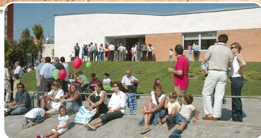
A dalt, espai on avui dia es troba la plaça de l'Estatut, l'adequació de la qual va significar d'alguna manera l'origen de l'associació de veïns i veïnes; sobre aquestes línies, un moment de la inauguració del centre cívic Antoni Gaudí, l'any 2002, que va significar un abans i un després en el barri

La lluita per millorar el barri de Residencial Sant Joan va fer fort el sentiment de veïnat i aviat van començar a organitzar activitats com la festa de barri (des de fa 13 anys) en què el sopar de germanor i les activitats esportives són