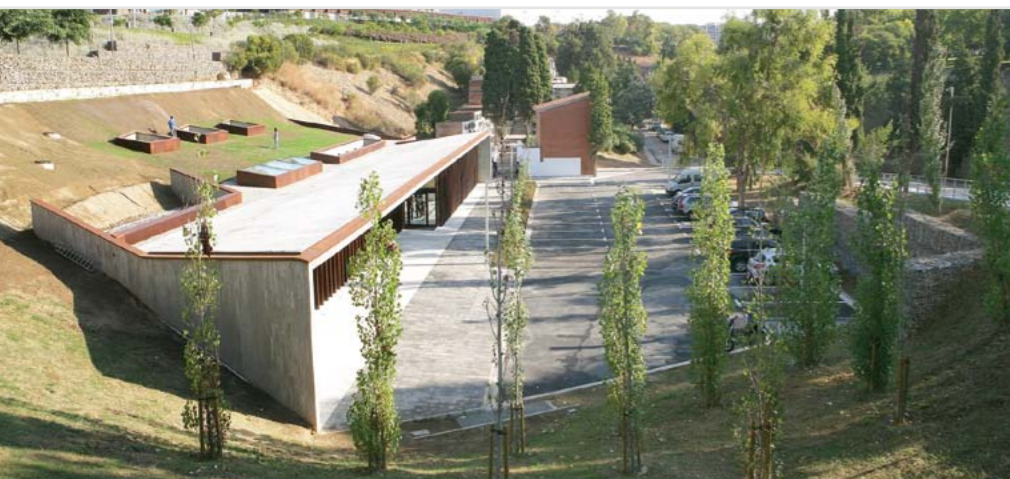
El tanatorio se integra arquitectónicamente en su entorno natural, en el parque de la Font Santa

Dispone de tres salas de velatorio y un oratorio multiconfesional