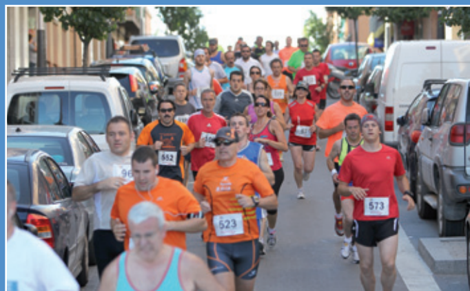
La Cursa de Les Planes se ha consolidado como una prueba de nivel