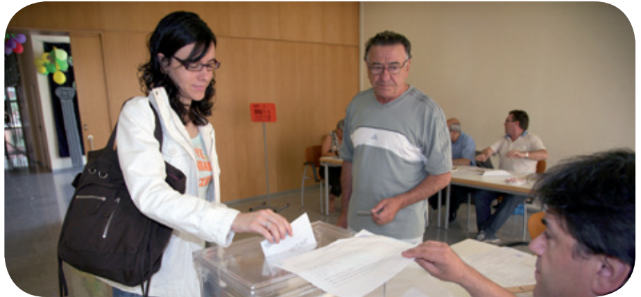
En total se instalarán 41 mesas electorales repartidas en 8 colegios en los cuatro barrios

Las personas que prefieran votar por correo pueden solicitarlo hasta el 12 de mayo en la oficina de Correos. Una de las novedades de estas elecciones es que podrán ejercer su derecho al voto, además de los ciudadanos comunitarios, los no comunitarios de países con los que España ha firmado un convenio. En Sant Joan Despí podrán votar