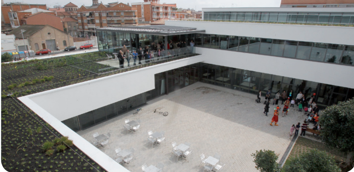
El nou centre cultural Mercè Rodoreda, un dels escenaris de l'oferta cultural de Sant Joan Despí aquesta primavera. A la foto, el pati del Diamant

Raimon aixecà el teló del teatre del centre cultural