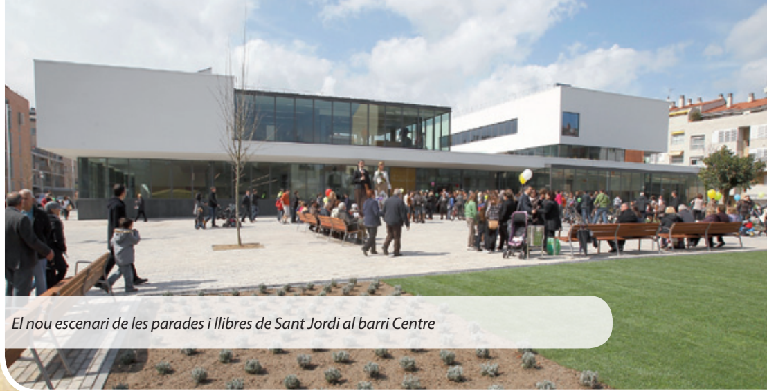
El nou escenari de les parades i llibres de Sant Jordi al barri Centre

Sant Jordi es trasllada fins a la plaça del nou Centre Cultural Mercè Rodoreda