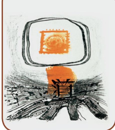
Litografies de Ràfols Casamada que acompanyen els poemes del llibre Tao-Te-King , de Lao Tse

Noves exposicions i tallers, les propostes culturals d'aquesta primavera