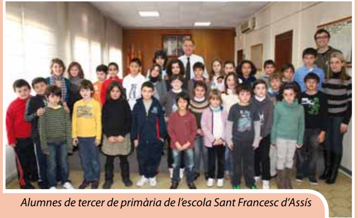
Alumnes de tercer de primària de l'escola Sant Francesc d'Assís