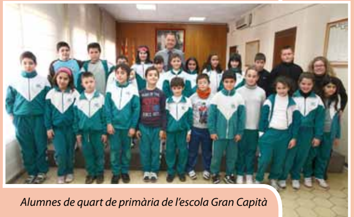
Alumnes de quart de primària de l'escola Gran Capità