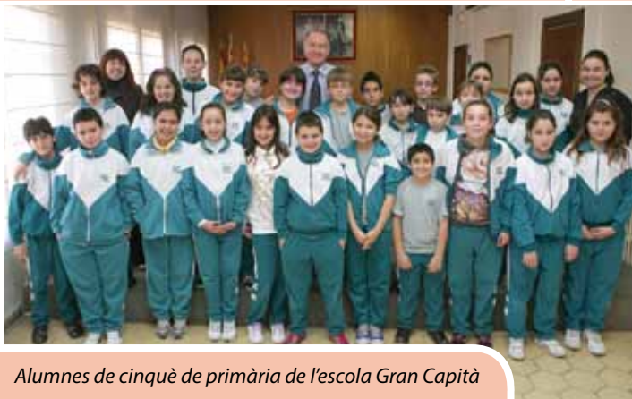
Alumnes de cinquè de primària de l'escola Gran Capità