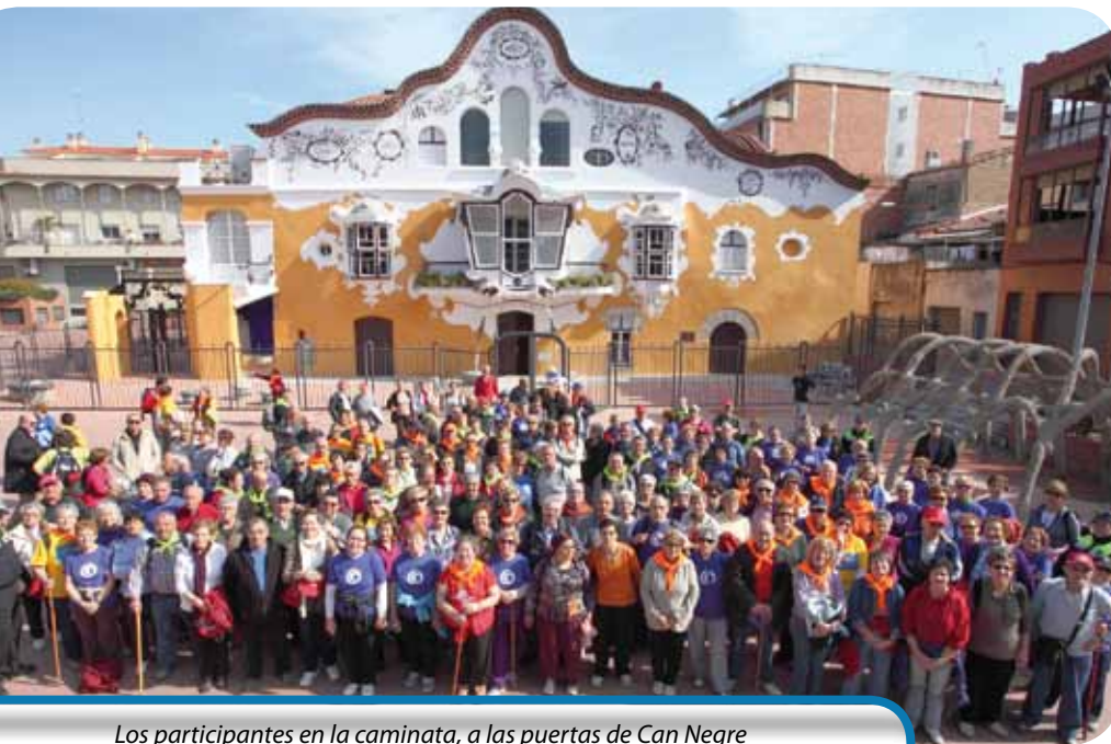
Los participantes en la caminata, a las puertas de Can Negre

220 vecinos de diferentes localidades barcelonesas participan en una caminata por la ciudad