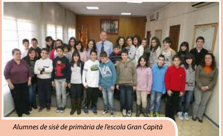
Alumnes de sisè de primària de l'escola Gran Capità