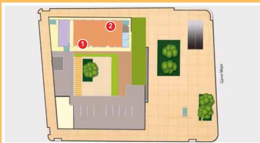
Planta segona: espai polivalent Aloma (1) i dependències municipals (2)