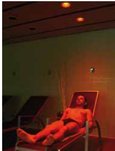
L'espai de wellness ha suposat un important impuls a la qualitat de vida de la ciutadania

Les sales d'activitats dirigides han donat l'opció de practicar noves activitats, com ara el Despi walking o el pilates, tot ampliant l'oferta de classes dirigides en un 40%. La nova sala de fitness de 350 m 2 ha ampliat de forma important totes les activitats cardiovasculars, amb unes magnífiques instal·lacions. La resposta de la població ha estat molt bona i el nombre