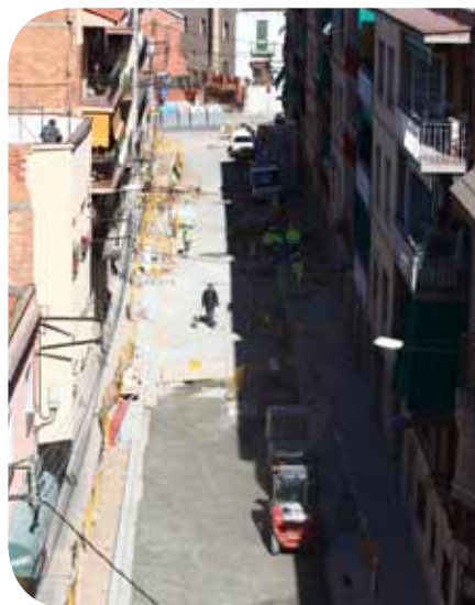
La fotografia de l'encapçalament de pàgina ens mostra una perspectiva del camí del Mig; a l'esquerra, l'estat de les obres del carrer de Núria i, sobre aquestes línies, un detall d'un dels elements de pacificació del trànsit

La reforma de carrers, la pacificació del trànsit i la millora de diferents elements viaris estan canviant la fesomia de bona part del barri Centre, tot potenciant la vida comercial i social