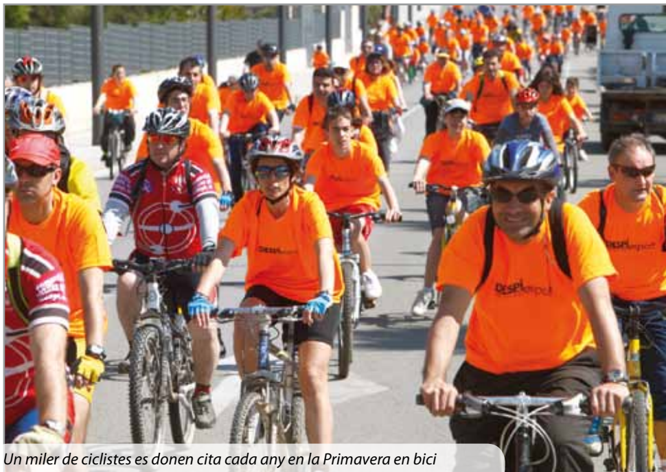
Un miler de ciclistes es donen cita cada any en la Primavera en bici

Sant Joan Despí viurà aviat una nova edició d'una campanya ludicoesportiva de gran participació com és la Primavera en bici. El dia 3 d'abril es farà la inauguració i la primera de les cinc sortides programades en aquesta campanya que va crear l'Ajuntament fa 17 anys per promoure la bicicleta com a mitjà de desplaçament i de pràctica esportiva. Les següents seran el 10 d'abril i l'1, 8 i 15 de maig. Prop d'un miler de persones de totes les edats es donen cita en aquesta activitat festiva que dona color als carrers de la ciutat. Abans de la sortida d'aquesta nova edició es farà el tradicional circuit d'habilitats en bicicleta al recinte firal. Al final del recorregut hi haurà un aperitiu. Tothom que participi en un mínim de tres de les quatre sortides obtindrà un impermeable de regal.