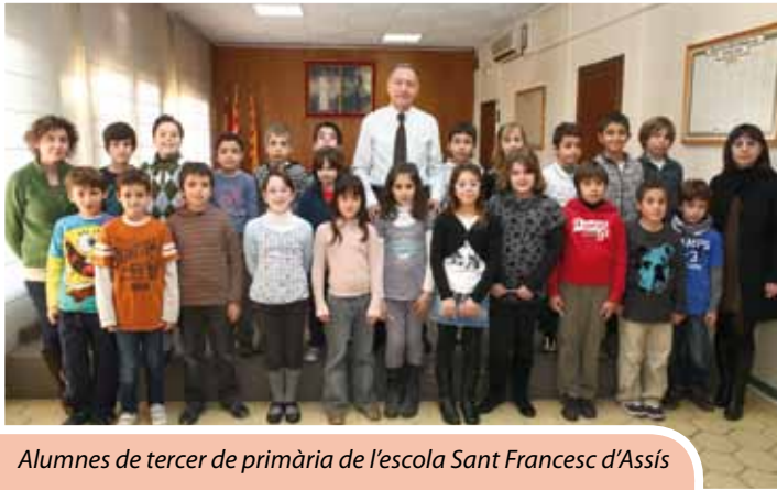
Alumnes de tercer de primària de l'escola Sant Francesc d'Assís