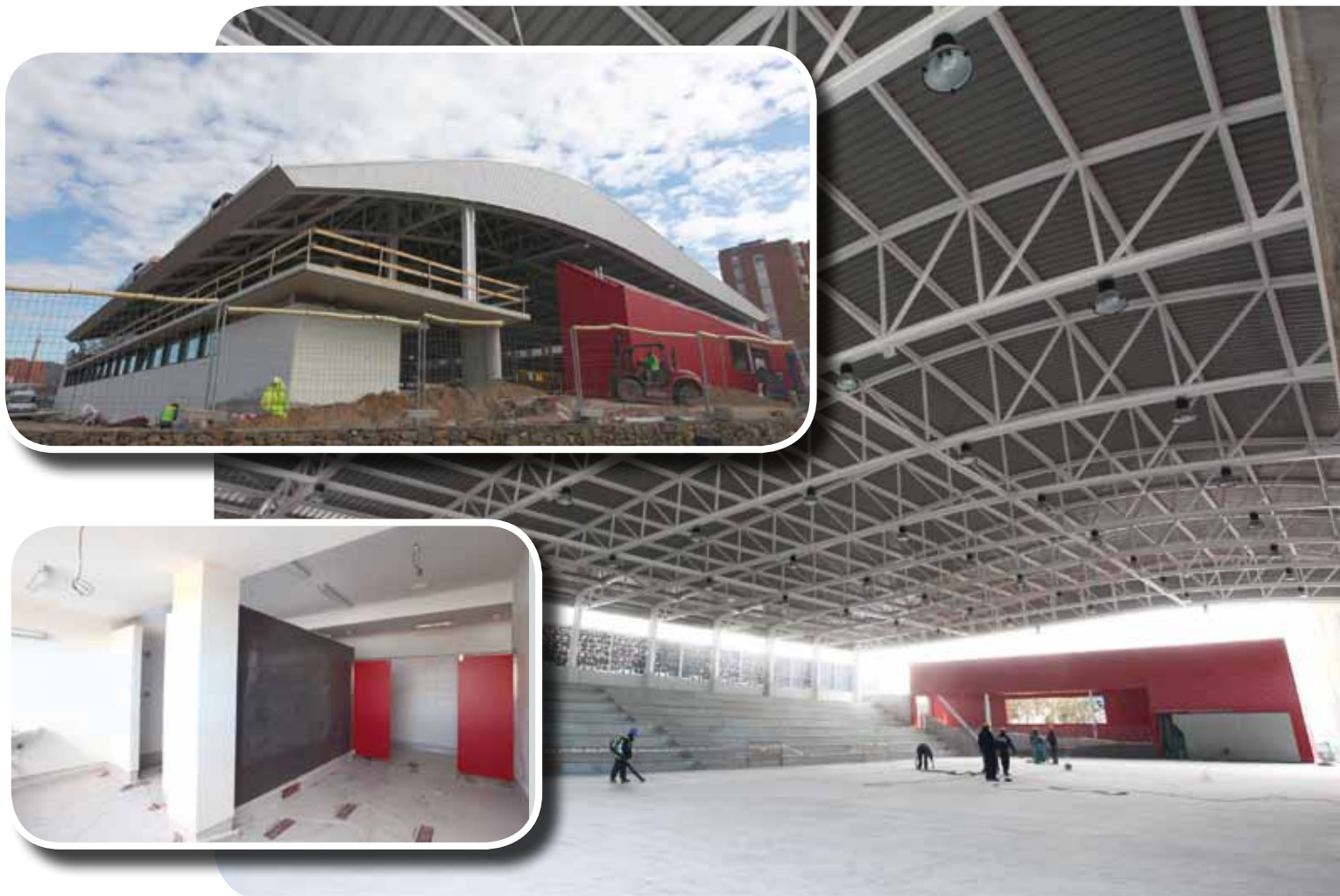
Aspecte de les obres del poliesportiu. Podem veure l'interior de la pista, on destaca l'original disseny de la coberta així com detalls dels vestidors i la façana exterior

A més d'acollir la pràctica esportiva, la instal·lació incorpora vestidors i una sala d'activitats