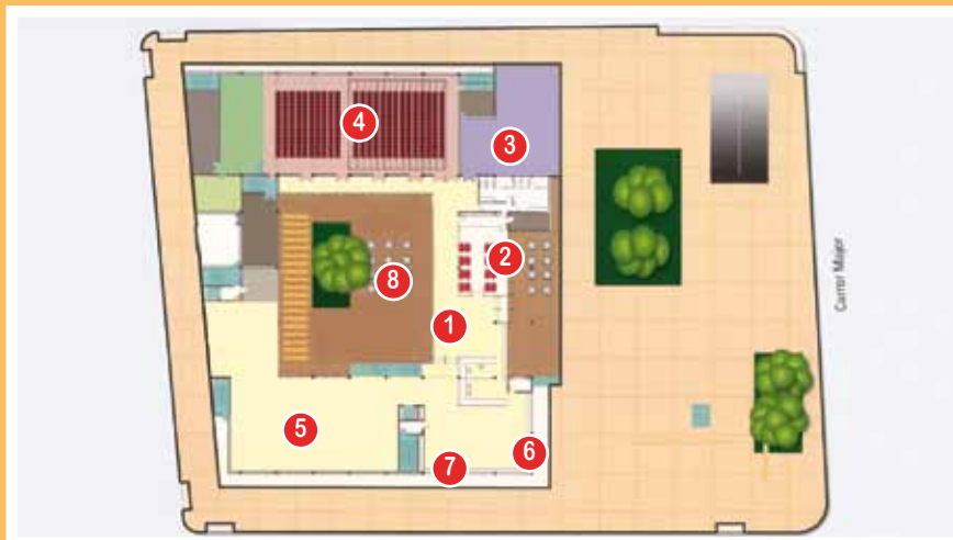
Planta baixa: accés biblioteca (1), cafeteria (2), sala polivalent de les Camèlies (3), teatre (4), àrea infantil (5), àrea de premsa (6), espai de música i imatge (7) i pati del Diamant (8)