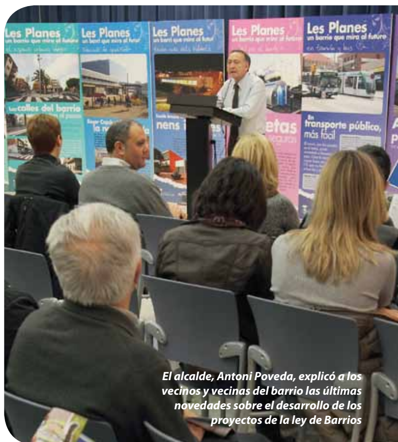
El alcalde, Antoni Poveda, explicó a los vecinos y vecinas del barrio las últimas novedades sobre el desarrollo de los proyectos de la ley de Barrios

E l barrio de Les Planes está inmerso en una nueva transformación con el desarrollo de los proyectos que contempla la ley de Barrios, y que suponen la inversión, hasta 2012, de 10,4 millones de euros. Desde la firma del convenio con la Generalitat, en 2009, ya han sido muchas las actuaciones llevadas a cabo: reurbanización de calles (Sant Francesc d'Assís, Joan Maragall, Extremadura, plaza de Espanya...), apertura de la oficina de vivienda con una línea de ayudas a la rehabilitación e instalación de ascensores, fomento del empleo con planes de ocupación, la mejora de la red telefónica y de la fibra óptica en los edificios municipales del barrio, el despliegue de programas de políticas de igualdad y sociales... actuaciones a las que se han sumado otras como la construcción de vivienda pública en el eje de la avenida de Barcelona, la nueva escuela Roser Capdevila, la mejora del mercado, etc. Pero también están en marcha nuevos proyectos para mejorar el barrio, tal y como avanzó el alcalde, Antoni Poveda, el 3 de marzo, en un acto explicativo a los vecinos. Poveda anunció la reforma de nuevas calles (como Montilla y Àngel Guimerà), la construcción de apartamentos y un centro de servicios para personas mayores, o la mejora de frecuencia del transporte público (autobús y tranvía).