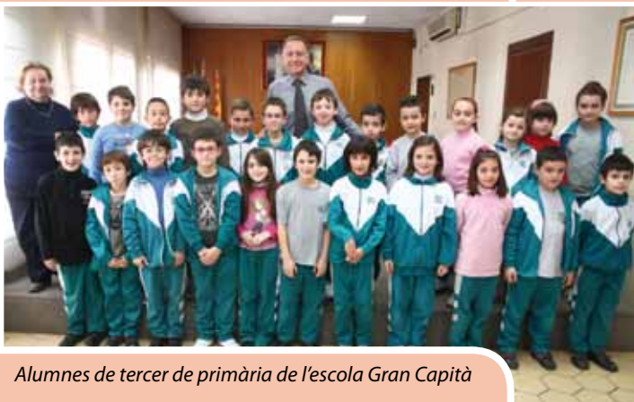
Alumnes de tercer de primària de l'escola Gran Capità