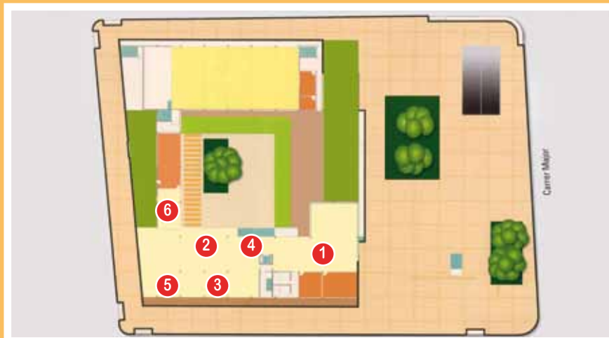
Planta primera: àrea d'informació (1), fons general (2), sales de treball en grup (3), espai Internet (4), espai multimèdia (5) i zona de treball intern (6)