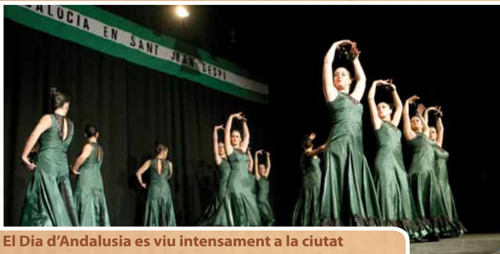
El Dia d'Andalusia es viu intensament a la ciutat