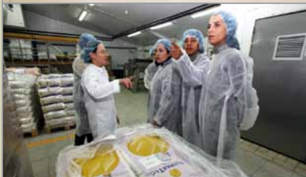
En la superior, alumnos del Ferrer i Guàrdia en la residencia Sophos. En la inferior, visita a la empresa Europastry