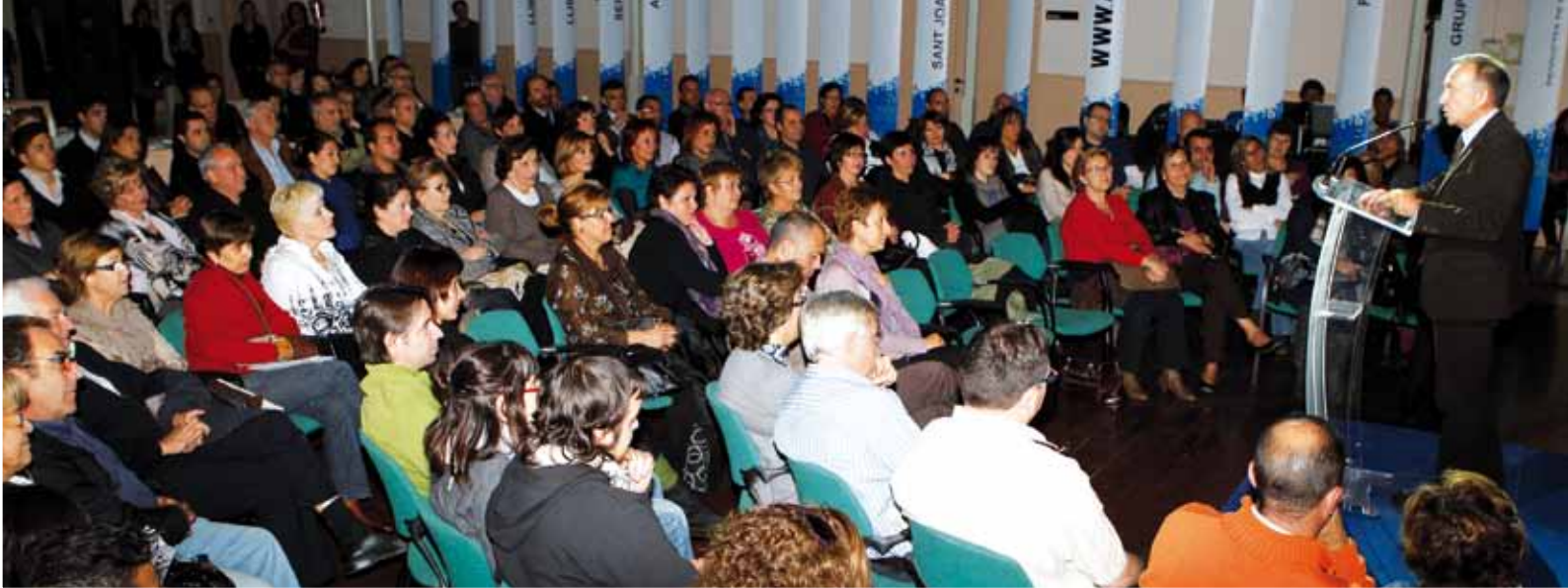
El alcalde, Antoni Poveda, ante los más de 200 comerciantes que asistieron a la cuarta edición de la 'Trobada anual del comerç urbà'