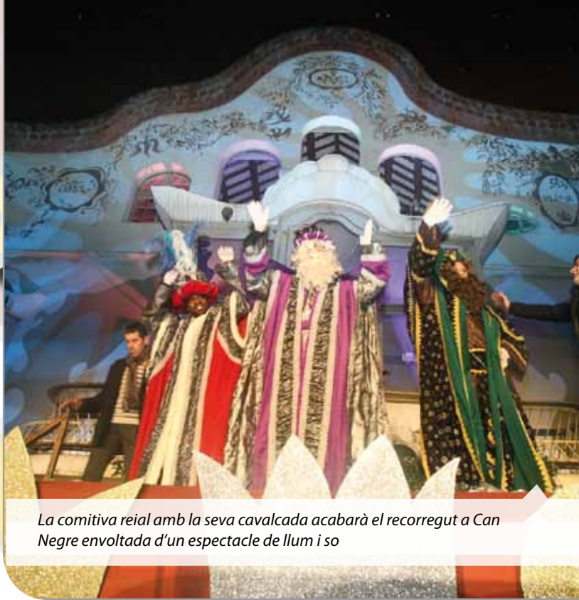
La comitiva reial amb la seva cavalcada acabarà el recorregut a Can Negre envoltada d'un espectacle de llum i so