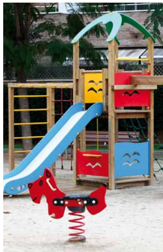
Algunas de las mejoras que se han realizado en el mobiliario urbano: nuevos bancos en la calle Gran Capità, juego infantil en la plaza Mercè Rodoreda y vallado de la zona infantil de la calle de la Barca, que se ha reparado

A rreglar calles, construir nuevos equipamientos, invertir en nuevas infraestructuras, son, sin duda, proyectos necesarios para una ciudad. Sin embargo, el Ayuntamiento realiza otras intervenciones en el espacio público que, no por disponer de menos presupuesto, son menos importantes para la ciudadanía. Al contrario. El consistorio incrementa año tras año las partidas destinadas a la sustitución y renovación de elementos como bancos, farolas, papeleras o juegos infantiles,