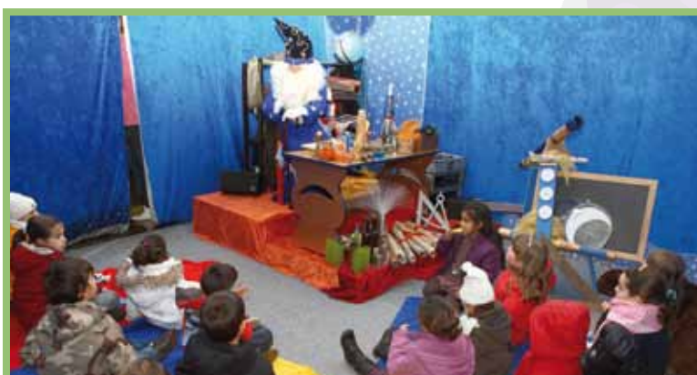
L'Astròleg Sadurní explicarà als infants totes les novetats sobre l'arribada dels Reis