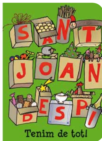
La campanya comercial convida els ciutadans a fer les compres a la ciutat

Els paradistes del mercat municipal del Centre obsequiaran amb un regal les compres dels dies 23 i 24 de desembre a través de la campanya Si un regal vols tenir, al mercat has de venir . Per la seva banda, el de les Planes organitza un concurs de dibuix de Nadal, fins al 21 de desembre de 2010. Els infants de 4 a 10 anys podran