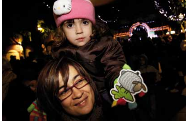
A l'esquerra, un dels moments de l'acte simbòlic d'encesa dels llums de Nadal a les Planes; a la dreta, al barri Centre, una nena mostra les ovelles que es van lliurar perquè es col·loquin als arbres de Nadal