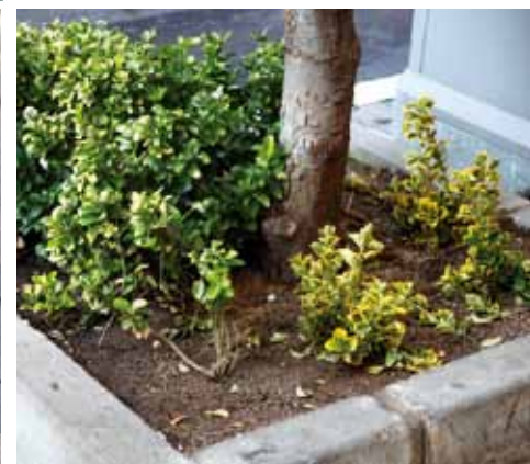
A les imatges es pot apreciar els danys provocats per les miccions al mobiliari. A l'última foto, al carrer Bon Viatge, les plantes petites s'acaben de replantar per substituir unes que es van pansir