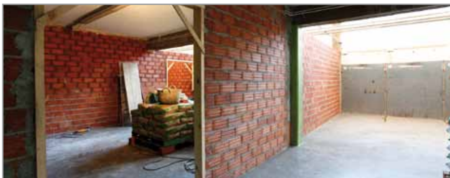
Les obres, encara molt incipients, permetran guanyar al voltant de 500 metres quadrats

L'institut Ferrer i Guàrdia va iniciar a final de novembre unes obres que milloraran les instal·lacions on s'imparteixen les classes dels cicles d'emergències sanitàries (nou d'aquest curs) i de cures auxiliars d'infermeria (en marxa des del curs passat). D'una banda, l'espai que ocupava l'antic cicle d'Instal·lació i manteniment electromecànic s'unificarà amb l'actual aula de cures auxiliars creant-ne dues de noves. També es faran vestidors.