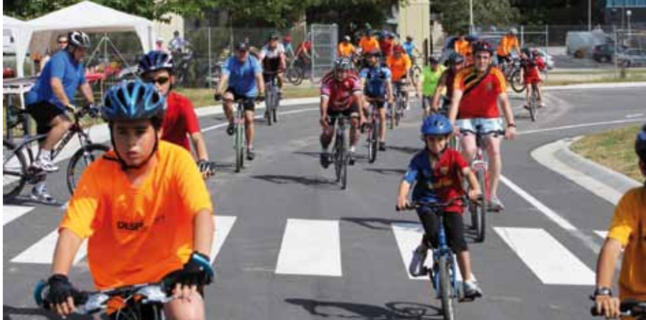
El Parc Ciclista permet la pràctica ciclista individual o en família