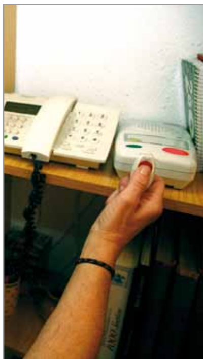
La teleasistencia, una herramienta que mejora la calidad de vida

Durante 2010, 423 personas de Sant Joan Despí han podido disponer del servicio de teleasistencia destinado tanto a mayores de 80 años que viven solas, como a las que tienen diferentes grados de dependencia por enfermedad, problemática de movilidad, diversidad funcional, etc. Este aparato permite que la persona esté conectada las 24 horas del día los 365 días del año con una central de atención que responde inmediatamente en caso de emergencia. Sin duda, una herramienta que mejora notablemente su calidad de vida. La teleasistencia es un servicio gratuito dirigido a aquellas personas que cumplan los requisitos establecidos por el Departamento de Acción Social y Políticas de Igualdad. Para solicitarla se ha de contactar con el Equipo de Servicios Sociales que corresponda según el barrio.