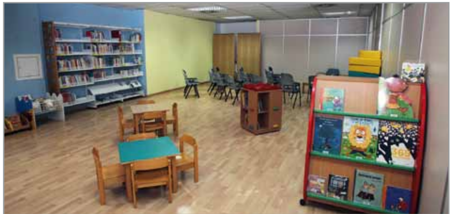
Aspecto de la sala de la bebeteca donde ahora también se realizan las conferencias, al fondo

E n las últimas semanas se han realizado diversas intervenciones para mejorar la eficiencia y la atención a los usuarios en la biblioteca. En la planta inferior se han unificado los dos mostradores de préstamo (infantil y adultos) en uno sólo para centralizar este tipo de gestiones. También se ha ampliado la sala de la bebeteca, pasando de unos 40 m 2 a 70 m 2 . Gracias a esta ampliación, la sala acoge a partir de ahora las charlas y conferencias que se realizan en este equipamiento. El objetivo ha sido mejorar las condiciones del espacio donde hasta ahora se realizaba esta actividad. Así, se gana en privacidad. Pero ésta no es la única novedad. A partir de enero, la biblioteca modificará su horario , una reestructuración que se debe a la puesta en marcha el próximo año, de la nueva biblioteca del