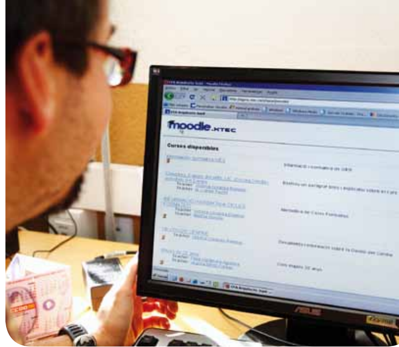
La majoria de les gestions internes del centre, com ara les convocatòries de reunions, es fan de manera 'on line'

Les Escoles Verdes estan incloses en una xarxa més gran, la de les Escoles per a la Sostenibilitat de Catalunya (XESC). De fet, l'Ajuntament ha engrescat a tots els centres educatius per formar part d'aquesta xarxa.