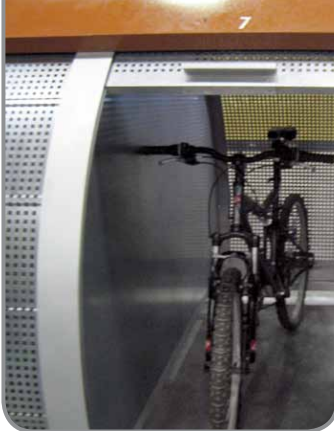
Els prototips del Bicibox estan en la recta final de la fase de construcció. A la imatge, com quedaria una bicicleta dins del Bicibox

Quan s'estengui a l'àrea metropolitana, el sistema funcionarà mitjançant un registre d'usuaris que pagaran 35 euros anualment. Això donarà dret a estacionar la bicicleta en qualsevol dels aparcaments de la xarxa per un màxim de 12 hores durant una jornada. Superat aquest temps es cobrarà un suplement. El sistema de pagament serà mitjançant targeta sense contacte. A més, el sistema destaca per la seva flexibilitat i sostenibilitat: s'alimenta amb energia solar ja que els mòduls incorporen plaques i la instal·lació requereix d'una obra mínima, fet que permet atendre un increment temporal de la demanda en llocs concrets.