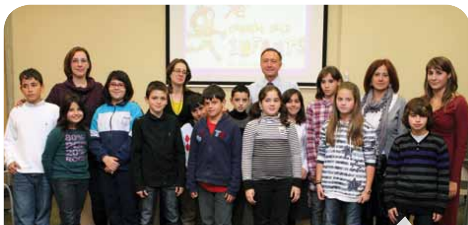
Aquests nens i nenes representen les 7 escoles de primària de la ciutat. Durant el curs treballaran temes relatius a fomentar la utilització de la bicicleta

També treballaran en la creació d'un joc on line en anglès sobre Sant Joan Despí