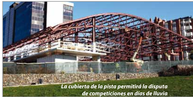
La cubierta de la pista permitirá la disputa de competiciones en días de lluvia

La obra está actualmente en ejecución y está previsto que fi-