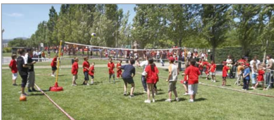
Els infants que han participat a les escoles esportives gaudiran d'un divertit comiat del curs