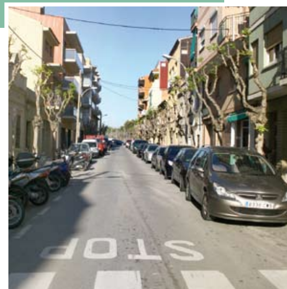
Camí del Mig cambiará en breve su aspecto

arbolado frente al polideportivo del Mig. Con la reforma se reordenará el aparcamiento –de batería se pasará a en línea– en el tramo entre Creu d'en Muntaner y Riera d'en Nofre. También se sustituirá una parte del alcantarillado y se construirá un paso de peatones elevado en el cruce con la calle Frederic Casas, junto al Ayuntamiento. Las obras, que según la previsión se iniciarán la primera quincena de junio y se prolongarán hasta finales de año, provocarán desvíos provisionales en el tráfico.