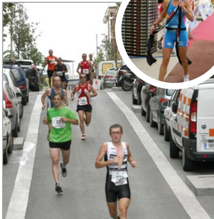
Un instante de la prueba de 2009, en la foto superior Pilar Hidalgo

La organización, con el objetivo de dar prestigio a la prueba, invita a algún atleta que haya destacado en un momento dado. Si el año pasado participó M a Luisa Muñoz -que repetirá también este año, al igual que la gran mayoría de participantes que hicieron podio-, en esta ocasión lo hará la atleta gallega de 31 años Pilar Hidalgo, que se retiró el año pasado de la práctica del triatlón por problemas cardiacos. Fue olímpica en Atenas 2004, campeona del mundo sub-23 de esta especialidad y ocho veces podio en la Copa del Mundo. También participará su pareja, el suizo Sebastien Gacond, miembro