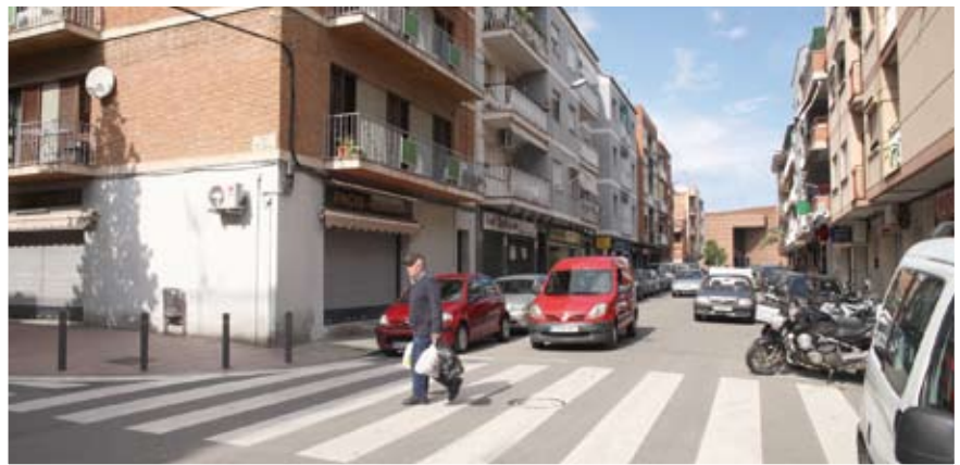
Para facilitar la movilidad habrá un paso de peatones elevado en el cruce con la calle Sant Feliu

En la calle Joan Maragall, se ampliarán las aceras y se realizará una plataforma elevada en el cruce con Sant Feliu que mejorará, aún más, la movilidad de los peatones. Se incorporará arbolado, ahora inexistente, y 12 nuevos puntos de luz, más eficiente energé-