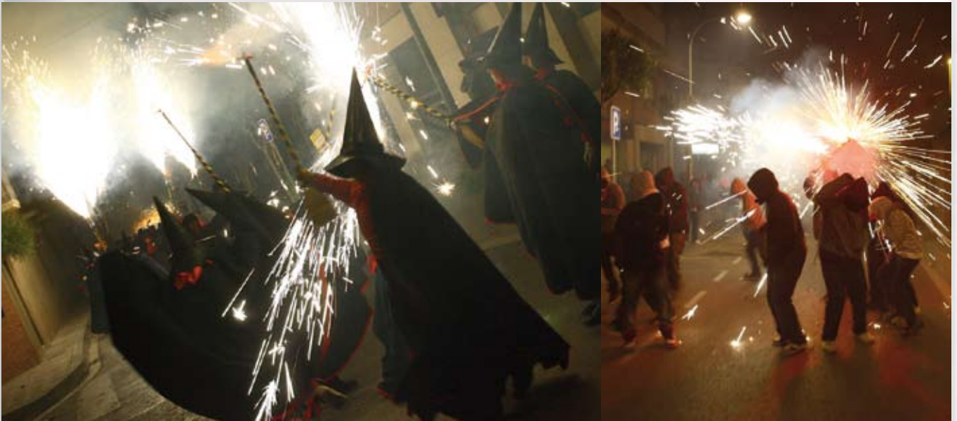
El correfoc de primavera, el 17 d'abril, també va omplir els carrers del Centre de foc i bèsties