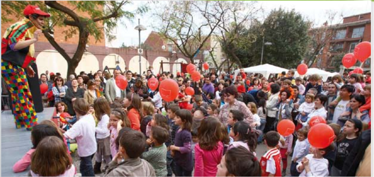
Les animacions infantils van aplegar moltíssims infants: a dalt, una actuació, a la plaça de l'Ermita i a baix, a la dreta, la festa medieval que es va organitzar a la plaça del Mercat

Milers de persones donen la benvinguda a la primavera participant en les activitats culturals del programa de 'Sant Jordi a Sant Joan'