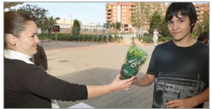
En las fotografías, dos ciudadanos recogiendo sus plantas