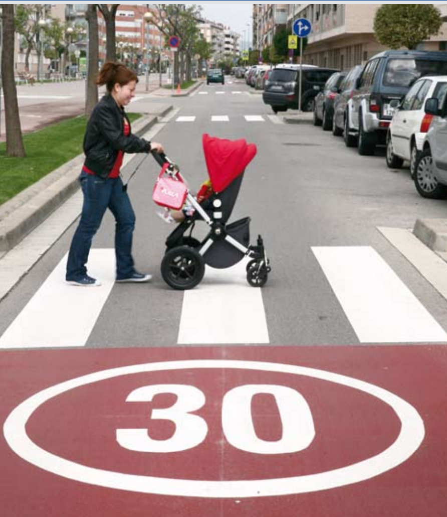
Zonas 30, espacios más seguros. Prácticamente todas las principales vías de cada barrio incluirán las zonas 30. Ya se han empezado a señalar, en la imagen, la rambla

E l Ayuntamiento de Sant Joan Despí desarrollará durante los próximos meses diversos proyectos encaminados a mejorar la movilidad en todos los barrios. Por un lado, los más de diez kilómetros de carril bici urbano existente se volverán a pintar y señalizar y se crearán dos nuevos kilómetros de vías para bicicletas para completar, de manera progresiva y en función de las necesidades la red.