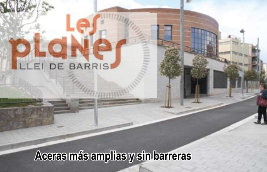
Aceras más amplias y sin barreras