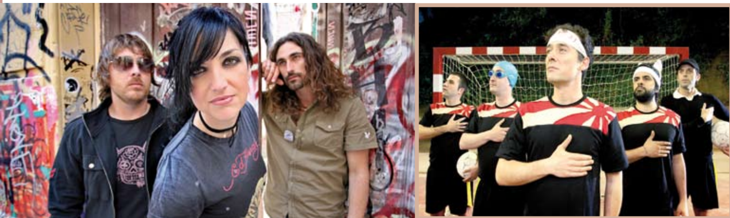
Fotografies promocionals de dos dels conjunts musicals que actuaran a la festa, Efecto Mariposa (esquerra) i Love of Lesbian

També hi haurà el tradicional concert de grups locals i activitats als barris de la ciutat per a tots els gustos i edats • La plaça de l'Àrea s'estrenarà com a escenari festiu amb ball i música