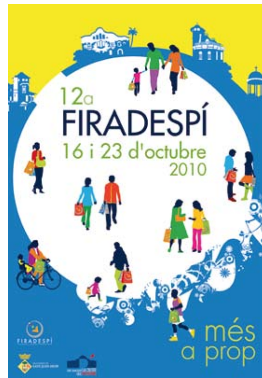
El cartel de la próxima edición de FiraDespí

dos sábados del mes de octubre: el día 16 en Les Planes y el 23 en el barrio Centre. El alcalde comentó además que la feria, a pesar del cambio de formato, mantendrá actividades paralelas ligadas a este evento, como la Pasarela de Moda, las actuaciones del mundo asociativo o las actividades infantiles. Se buscará la complicidad del sector de la hostelería y la restauración, con una amplia oferta en la ciudad, que propondrá degustaciones u ofertas especiales para animar a los participantes. Por último, aunque el 16 y 23 de octubre sean las jornadas que concentran el mayor número de actividades, durante la semana se realizarán otras relacionadas con el fomento de la actividad económica y la ocupación.