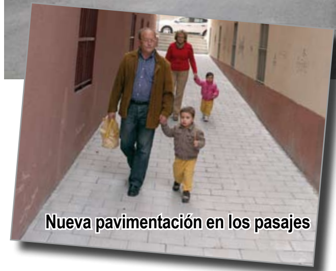
Nueva pavimentación en los pasajes