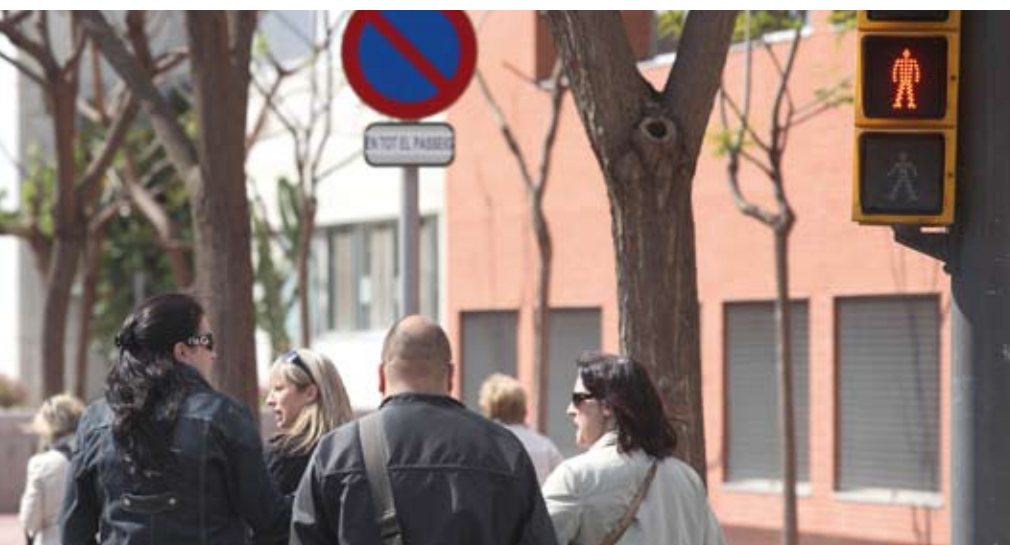
Más semáforos LED. Se instalarán nuevos semáforos de LED (en la imagen, uno situado en la calle Creu d'en Muntaner) que duran más y consumen menos

El plan concreta 21 acciones que ayudarán a reducir las emisiones de gases de efecto invernadero • Se llevarán a cabo en ámbitos como el transporte, los equipamientos municipales y el sector terciario