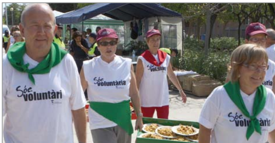
Voluntarios ayudando en la paella de la gent gran

El Ayuntamiento inicia un nuevo programa, más ambicioso, con nuevas opciones de altruismo destinadas a los mayores de 60 años