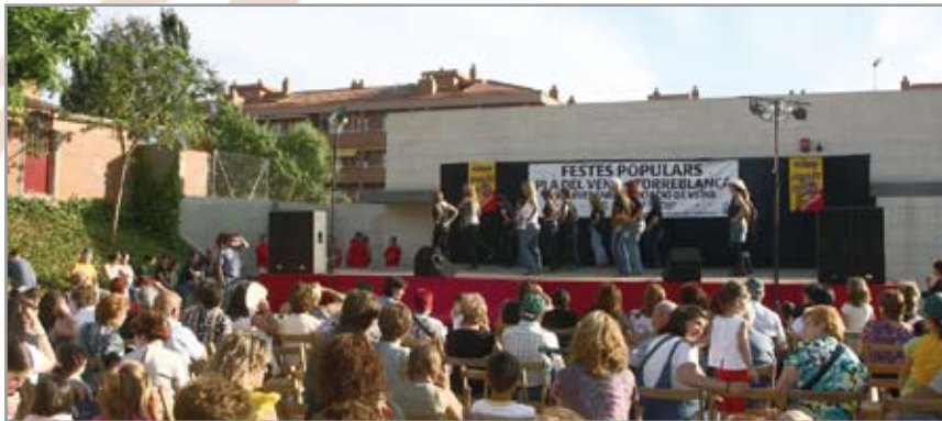
La mostra de balls de les entitats es farà el dissabte a la plaça del centre cívic

Del 28 al 30 de maig activitats infantils, esportives i culturals ompliran els carrers i les places del barri