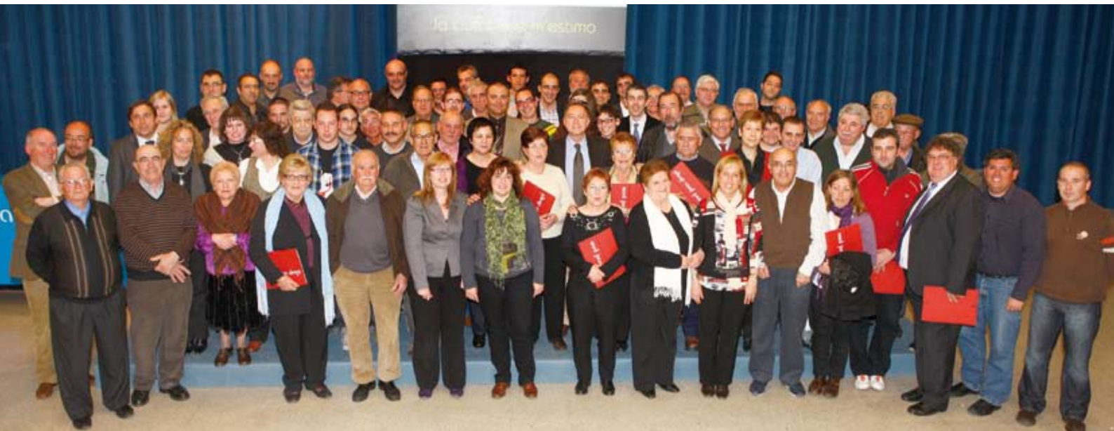
Foto de grupo de los representantes de las 73 entidades que firmaron los convenios, con el alcalde y diferentes concejales y concejalas

73 asociaciones han firmado este año convenios de colaboración con el consistorio