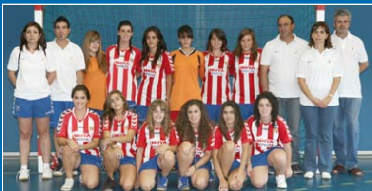
L'equip cadet femení ha fet una sensacional temporada a Primera Catalana

L'equip cadet femení de l'Handbol Club Sant Joan Despí va jugar la fase final del Campionat de Catalunya de Primera Catalana i va assolir un brillant segon lloc.