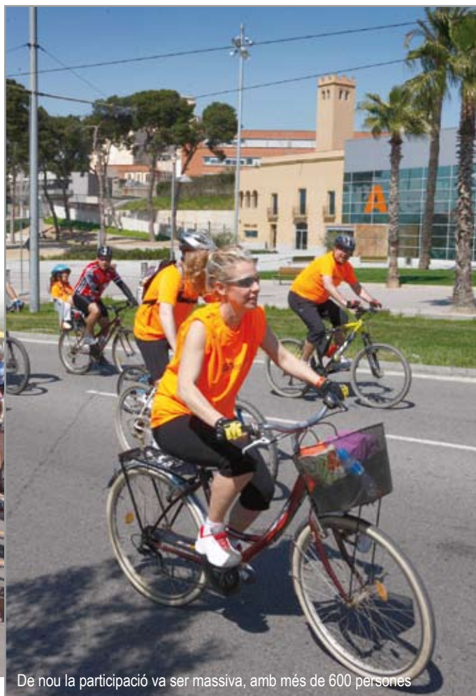
De nou la participació va ser massiva, amb més de 600 persones