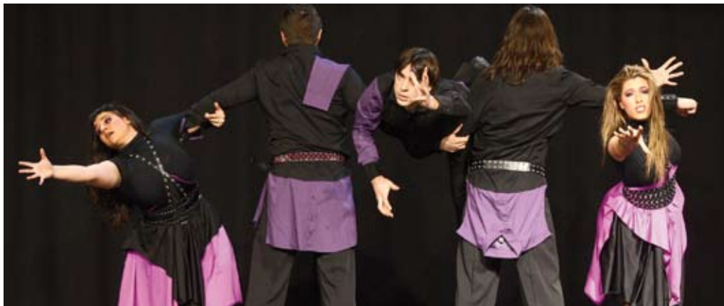
La Gala Solidària de la Creu Roja Joventut recaudó 950 euros. En la foto, una de las actuaciones

Los fondos recogidos se destinarán a la reconstrucción de un centro sanitario en Haití, un proyecto que se ejecutará a través de Cruz Roja Española. Así lo ha decidido la Comissió de Solidaritat por considerarlo una prioridad para la