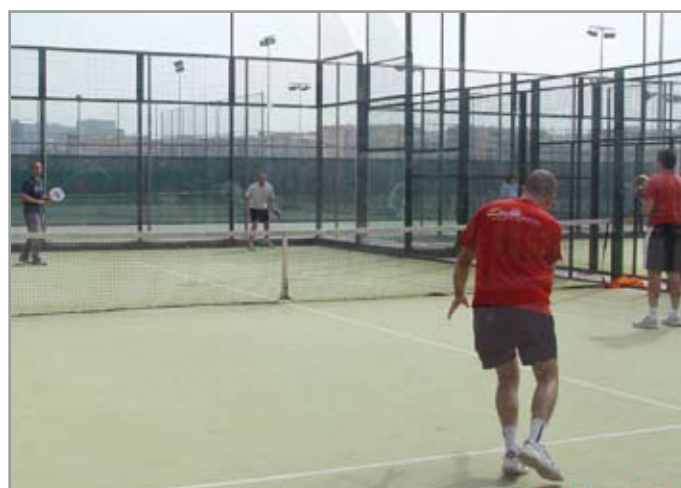
El pàdel va ser una de les activitats que es van dur a terme

Hi ha hagut 160 participants, entre diferents cossos policials, bombers i mossos d'esquadra de diferents comissaries del territori.