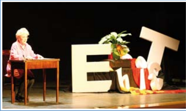
L'actriu Montserrat Carulla, en el lliurament dels premis 2009