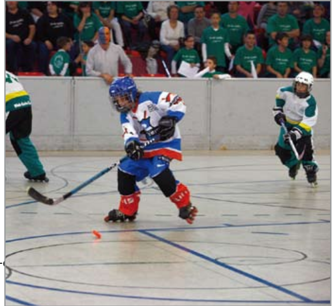
El poliesportiu del Mig va acollir aquestes finals d'hoquei línia de base

Els espectadors van poder contemplar quatre partits molt disputats i jugats a molt bon nivell, de manera que les finals es van decidir amb marcadors molt igualats. Els campions van ser el Club Patí Castellbisbal en juvenils i el Tsunamis de Barcelona en alevins. Els equips aleví i juvenil del club de Sant Joan Despí van obtenir uns meritoris tercer i quart lloc, respectivament, "fruit de l'esforç i bona feina desenvolupats al llarg de la lliga regular i d'aquesta fase final del Campionat de Catalunya"