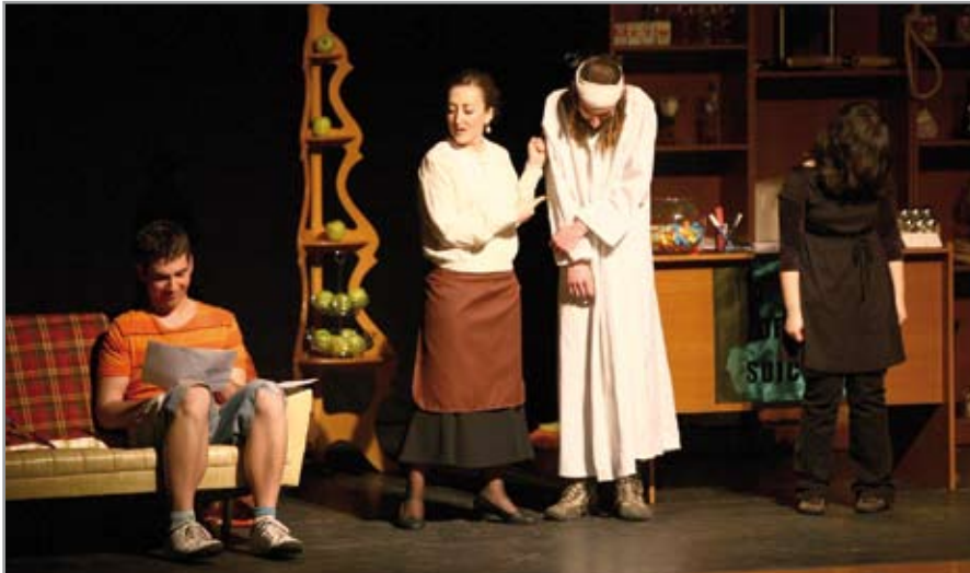
Escena de l'obra La tienda de los suicidas que van estrenar l'any passat

El grup santjoanenc presenta el seu nou muntatge Mi mujer es el fontanero els dies 21 i 23 de maig