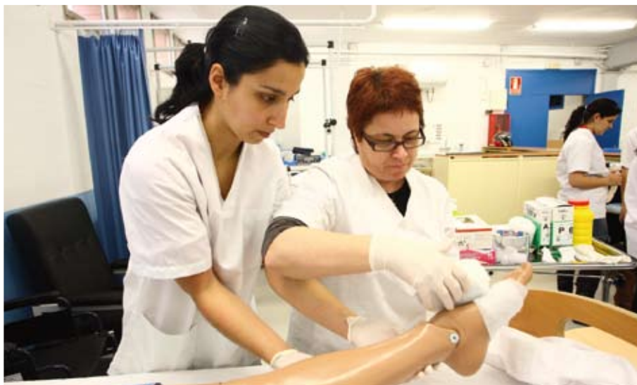
Alumnes durant una de les classes pràctiques del cicle de grau mitjà de cures auxiliars d'infermeria

Si durant aquest curs s'ha posat en marxa el cicle formatiu de grau mitjà de cures auxiliars d'infermeria, el 2010-2011 es podrà cursar el d'emergències sanitàries. Si la planificació actual es duu a terme, els propers cursos es podrà ofertar un nou cicle de grau superior: imatge per al diagnòstic o protèsi dental. La incorporació d'aquests nous estudis ha comportat una reestructuració dels espais, que continuarà aquest estiu amb obres d'adequació, i de l'oferta, ja que a partir del proper curs ja no