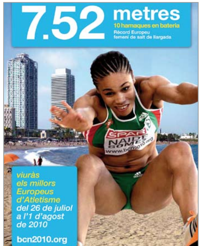
Uno de los carteles de la campaña, con la atleta portuguesa Naide Gomes, saltadora de longitud, como protagonista

Para obtener una completa información sobre el campeonato se puede acceder a la web oficial: www.bcn2010.org