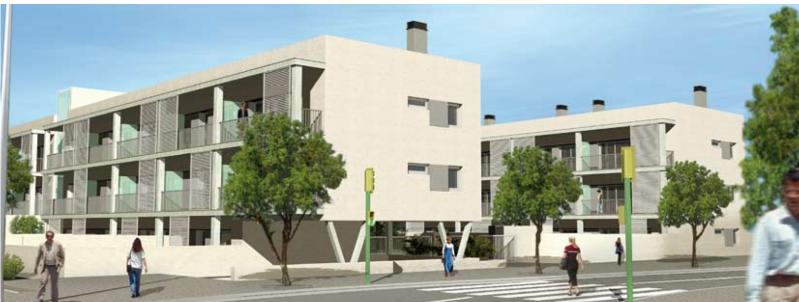
Arriba, imagen virtual de los edificios que albergarán los 44 pisos de alquiler. Abajo, estado actual de la construcción

Las inscripciones se realizarán entre el 3 de mayo y el 15 de junio, en la Oficina Local de Vivienda. Entre otras condiciones, hay que demostrar una residencia continuada en Sant Joan Despí