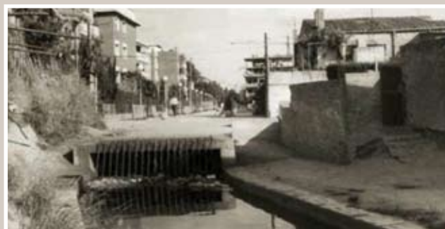
El passeig del Canal, al 1979

Sant Joan Despí, 30 anys d'ajuntaments democràtics. Aquest és el títol d'un nou llibre editat per l'Ajuntament que la ciutadania podrà aconseguir, de manera gratuïta, coincidint amb la diada de Sant Jordi. A la contraportada d'aquest Butlletí trobareu els dies, horaris i llocs en els quals es pot adquirir aquesta obra que mostra, en més de 200 pàgines i amb abundant material fotogràfic, la transformació que ha viscut la ciutat des que es van fer les primeres eleccions locals en democràcia, el 1979.