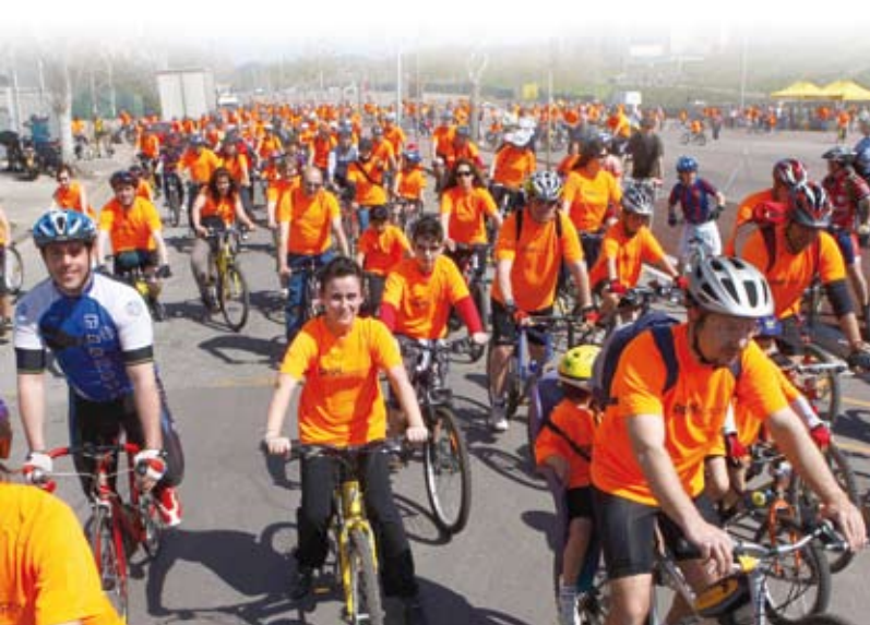
Persones de totes les edats van participar en el cercavila

Els diumenges 18 i 25 d'abril i 9 i 16 de maig tindran lloc la resta de les sortides. La trobada serà a les 11.30 hores al recinte firal. Tothom que participi en un mínim de tres de les sortides rebrà de regal una ronyonera.