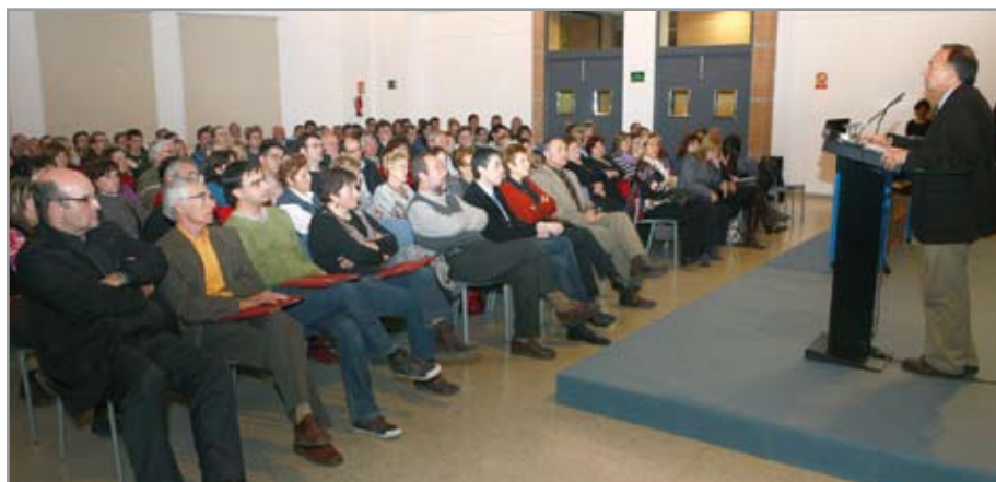
En su intervención, el alcalde destacó la importancia de la participación asociativa en la sociedad actual

A lo largo de este año serán varias las asociaciones que celebren aniversarios significativos: la Associació de Dones Progressistes (20 años); Ràdio Despí (15 años) y ADEGGPI -Associació per la Defensa de la Gent Gran de Sant Joan Despí- (15 años).