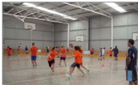
Amposta va ser l'escenari de les estades

Fora de les activitats de bàsquet pròpiament dites, es va realitzar una gymkana, jocs de nits, visualització de