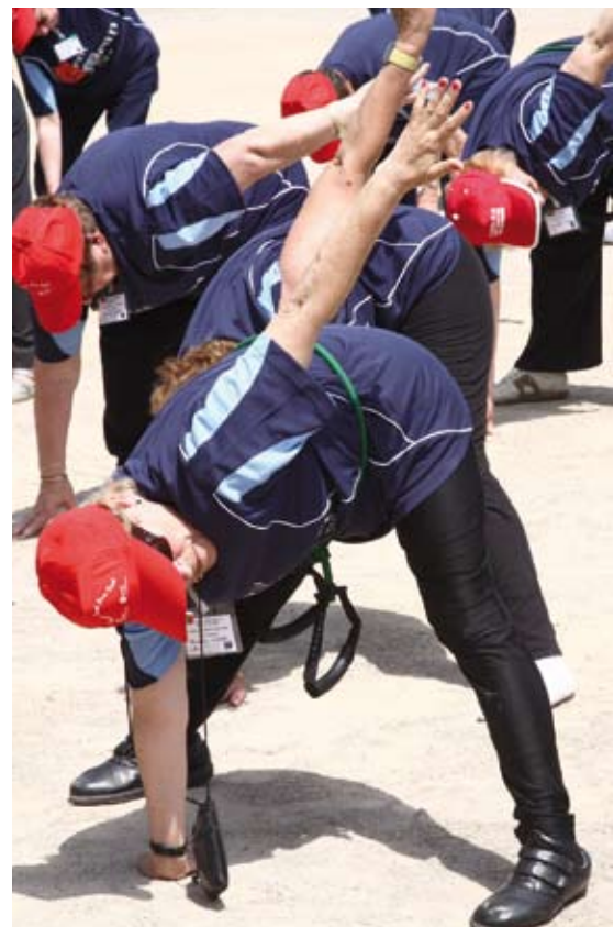
La jornada del año pasado se centró en el ejercicio

Más información en la web municipal www.sjdespi.cat .