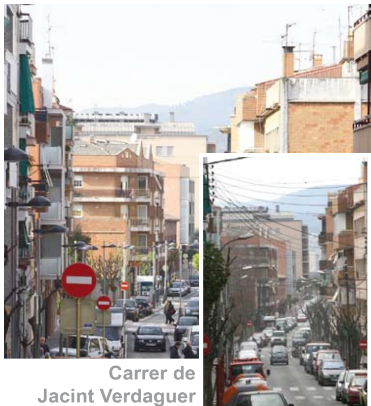
Carrer de Jacint Verdaguer