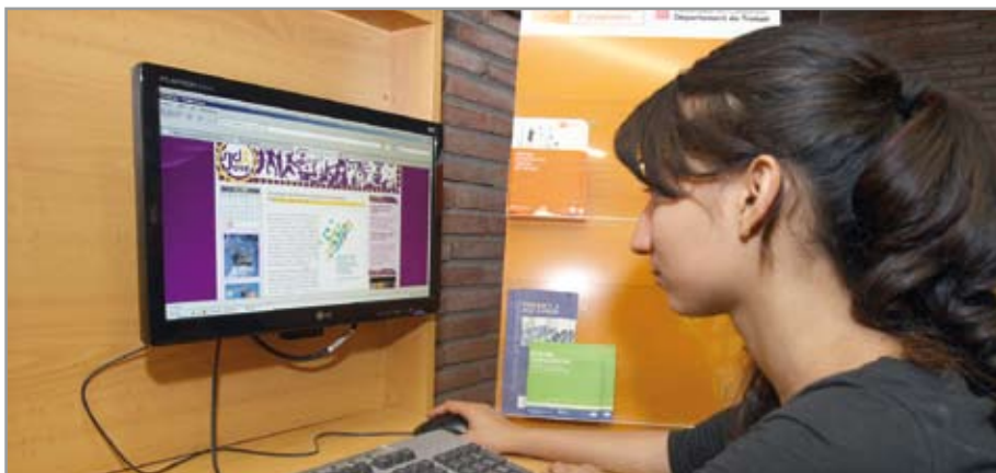
L'accés a Internet, un dels serveis més utilitzats per la gent jove al Jovespí, situat al casal El Bulevard

Un altre servei que ofereix el Jovespí és el d'accés a Internet, que ha estat utilitzat per 470 usuaris.