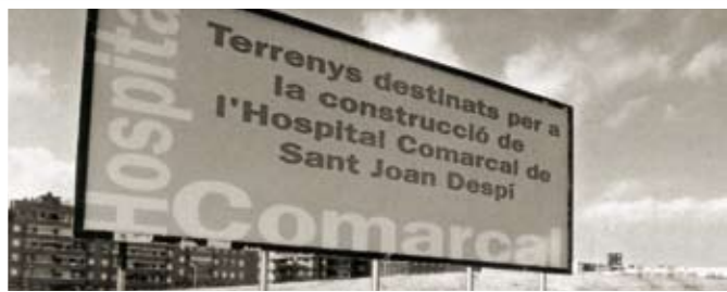
Aquest cartell va estar col·locat als terrenys durant més de dues dècades

L'hospital apareix per primer cop al mapa topogràfic sanitari de l'any 1976 que va encarregar el doctor Moisès Broggi i que va comptar amb la col·laboració del metge santjoanenc Carles Ibáñez. Un cop restablerta la Generalitat de Catalunya, es va incloure al mapa sanitari del Govern del president Tarradellas. Al 1980, l'Ajuntament cedeix a l'Incasòl el terreny per construir-lo i al 1982, la Conselleria de Sanitat el va incloure en la previsió del mapa sanitari català.