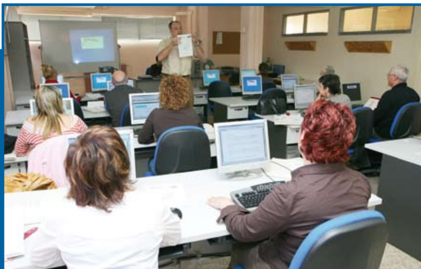
El año pasado se impartieron 16 cursos de formación para personas desempleadas por los que pasaron 320 alumnos, y 11 cursos de formación continua en los que se formaron 159 personas

Poner en servicio el segundo centro de empresas de Sant Joan Despí supondrá una inversión de 500.000 euros para acondicionar el local que la acogerá, en la planta baja de la guardería municipal Gegant del Pi. El Ayuntamiento financiará el proyecto con la ayuda a los fondos europeos FEDER (Fondo Europeo de Desarrollo Regional), que aporta unos 200.000 euros, y de la Diputación de Barcelona, que se hará cargo del 25% de la inversión.