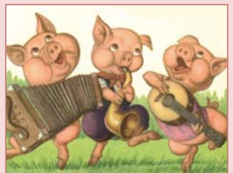
The three little pigs, primera hora del conte en anglès

La propera sessió de l'hora del conte introduirà els petits infants en un nou idioma, l'anglès. Serà el 14 d'abril a la biblioteca Miquel Martí i Pol, a partir de les 18 h. L'aposta decidida de l'Ajuntament perquè l'ús de l'anglès sigui cada cop més habitual arriba també a aquesta activitat infantil. La primera activitat és un conte ben conegut entre els petits i petites: The three little pigs , a càrrec The Nutcrake. La sessió serà doble, ja que també es farà una altra representació, aquesta en castellà, La pequeña luciérnaga , també a càrrec de The Nutcrake.