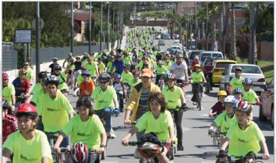
Enguany s'espera una participació propera al miler de persones en aquesta jornada festiva

El calendari de la temporada es complertarà amb quatre sortides més i tothom que participi en un mínim de tres rebrà una ronyonera de regal.