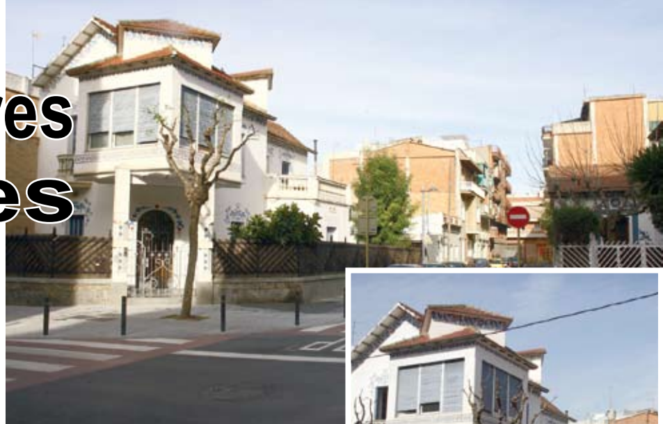
Carrer del Llobregat, cantonada amb Jacint Verdaguer

Les obres d'arranjament que s'han realitzat al barri Centre no només s'han traduït en millores en la mobilitat, sinó que han servit per soterrar el cablejat aeri de mitja tensió que creuava les vies de banda a banda. Sens dubte, una actuació que ha reduït l'impacte visual al nostre entorn.