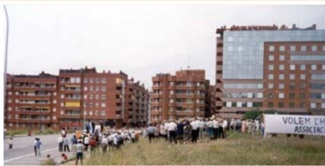
Als 80 i 90 es van fer múltiples concentracions per demanar la construcció

Malgrat la inclusió de l'hospital en el mapa sanitari català, el projecte no tira endavant. El 1984 el Ple de l'Ajuntament Sant Joan Despí va demanar-ne la posada en marxa de manera urgent; el 1997 es presenta una Proposició de Llei al Parlament que no prospera; el 1999 l'hospital va ser objecte de compromís per part de totes les formacions polítiques a les eleccions i el 2000, els sindicats CCOO i UGT i la Federació d'Associacions de Veïns del Baix Llobregat inicien una campanya de recollida de signatures. El primer projecte arriba el 2001 i preveia 238 llits. Però l'obra no començava.