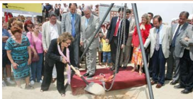
El 12 de juny es va posar la primera pedra

No serà fins l'any 2004 quan el president Pasqual Maragall i la consellera Marina Geli es reuneixen amb els alcaldes de la zona i qualifiquen el projecte de prioritari. Un any més tard, el juny del 2005, es posa la primera pedra en un acte multitudinari. Davant les noves necessitats generades per l'increment de la població, al 2007 s'aprova un nou projecte que amplia i millora el que s'estava executant passant del 238 llits previstos als 328. Finalment, l'1 de febrer de 2010 obre portes i, el dia 27, més de 10.000 persones no es van voler perdre una inauguració que posa fi a anys de reivindicacions.