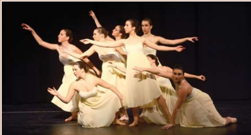
Una de les coreografies que van participar en el premi, a l'Auditori Miquel Martí i Pol

Bon nivell de participació en la primera edició del certamen