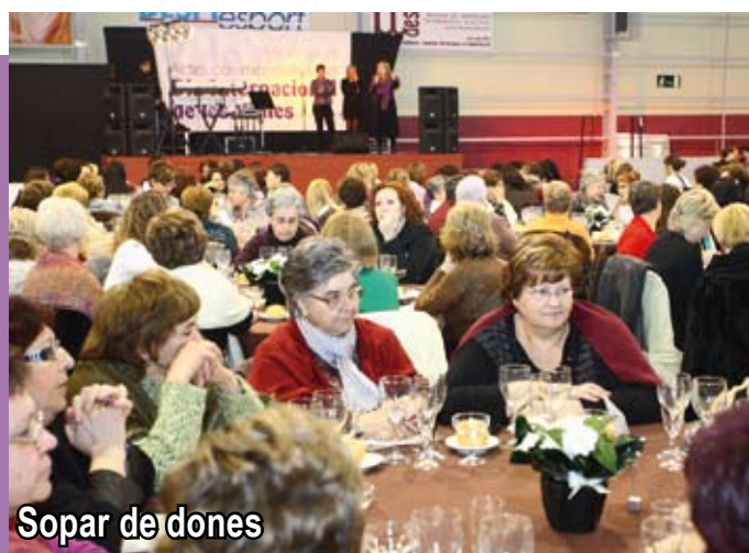
Sopar de dones

Un any més Sant Joan Despí ha viscut un Dia Internacional de les Dones molt participatiu amb la programació d'activitats lúdiques, reivindicatives, esportives, etc. Entre les cites més populars, la Caminada de Dones i Homes que sota el lema "Les dones movem el món" va aplegar prop