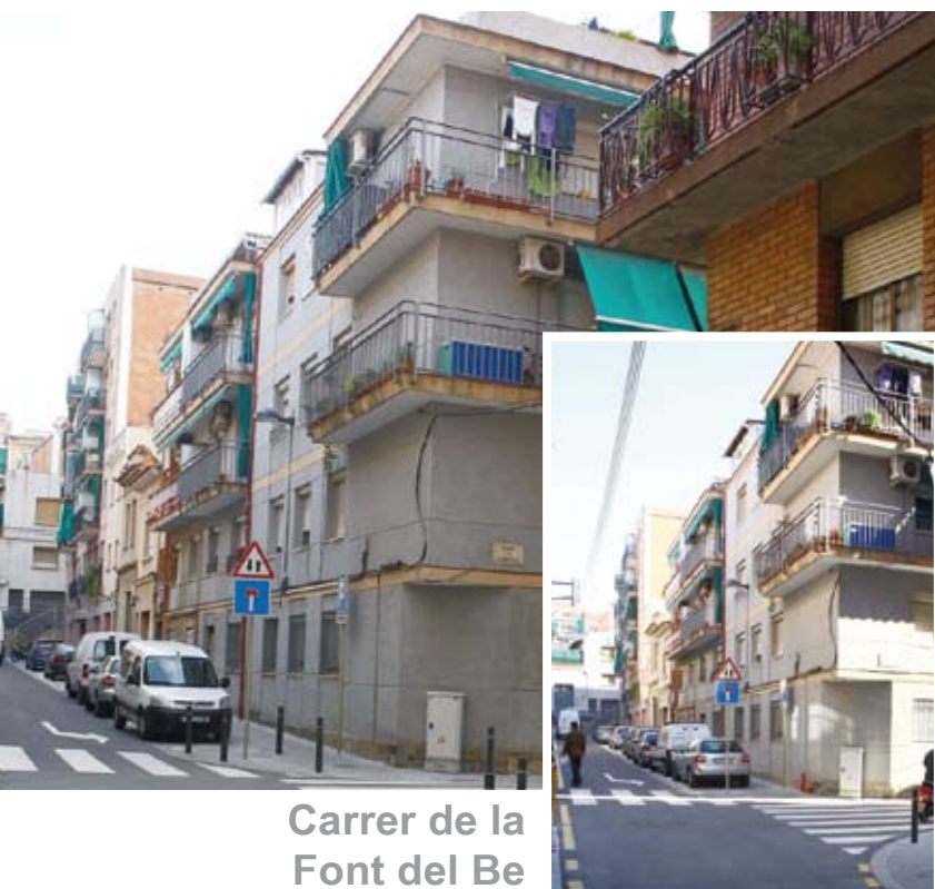
Carrer de la Font del Be