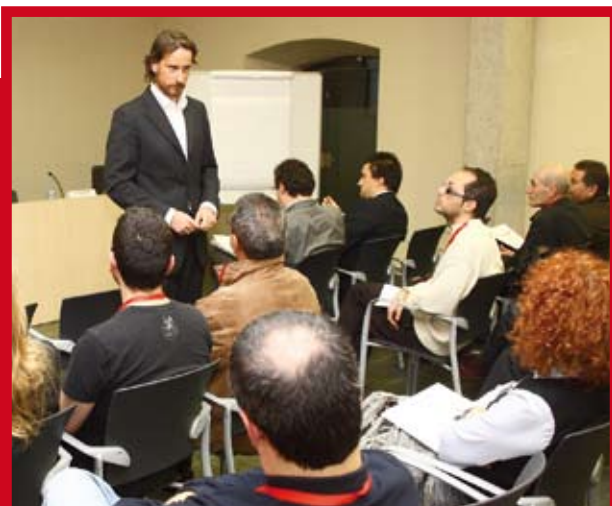
Uno de los momentos de la conferencia de Küppers

cio, el transporte privado, el editorial o farmacéutico. En los últimos años, la demanda de este servicio se ha incrementado de forma notable y desde que se puso en marcha, en 1999, ya ha atendido a más de 1.000 personas y ayudado a crear cerca de 250 empresas.