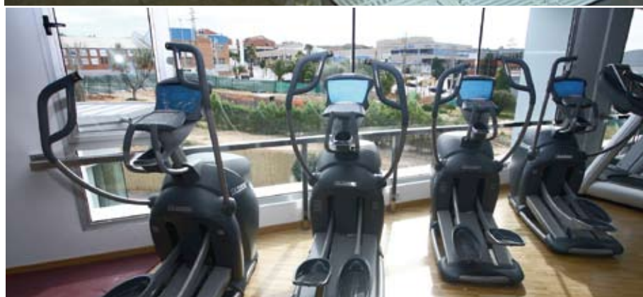
A dalt, la sala principal de la zona 'wellness'. Sota aquestes línies, un detall de la sala de fitness

s'iniciï la tercera i última fase de les actuacions previstes amb la construcció a l'exterior de tres pistes de pàdel , l'adequació dels espais de gimnàstica terapèutica i despatxos i espais per