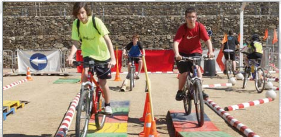
El circuit infantil d'habilitats en bicicleta servirà, de nou, com a preàmbul de la cercavila