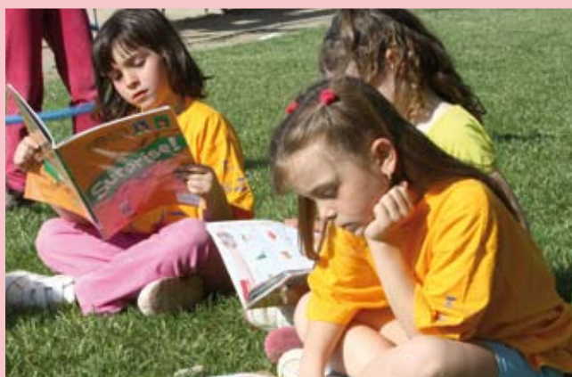
Sant Joan Despí ha impulsat l'ús de l'anglès amb diferents activitats lúdiques

Aquest projecte és una peça més del programa "Sant Joan Despí, una ciutat plurilingüe" que vol impulsar el coneixement i l'ús de l'anglès en tots els àmbits de la ciutat.