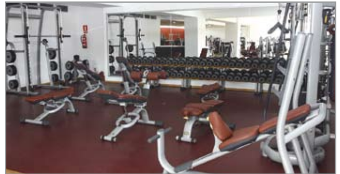
La sala de fitness ha fet una gran inversió en maquinària de darrera generació

1.500 persones visiten, en només tres hores, les noves instal·lacions durant la jornada de portes obertes