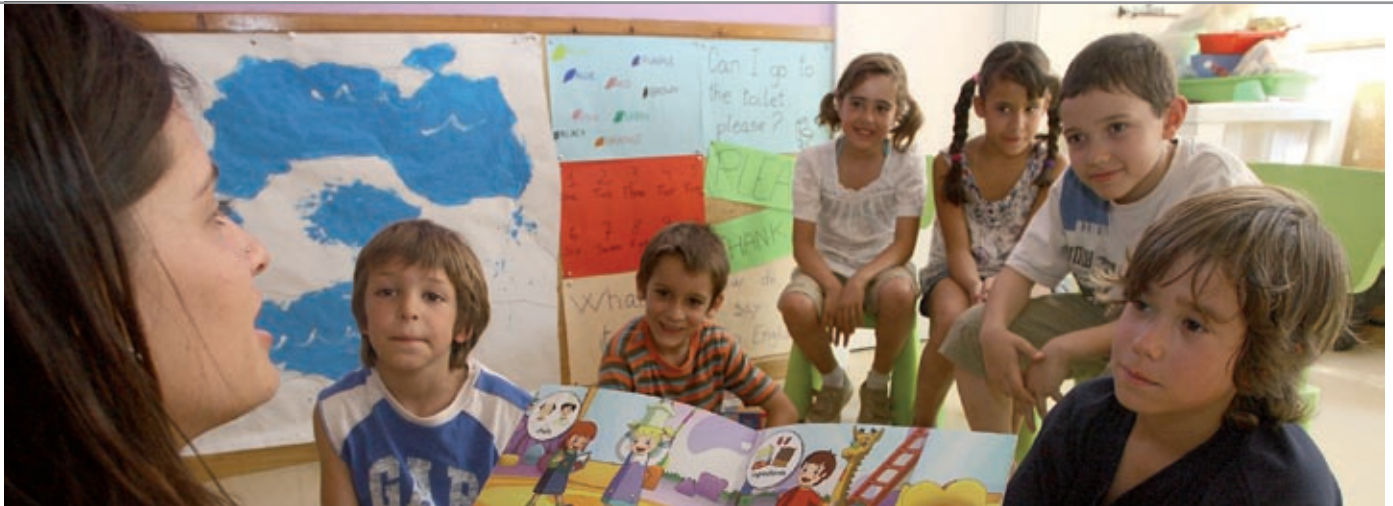
Una monitora llegeix un conte en anglès als infants de la seva classe