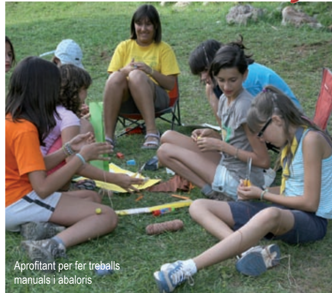
Aprofitant per fer treballs manuals i abaloris