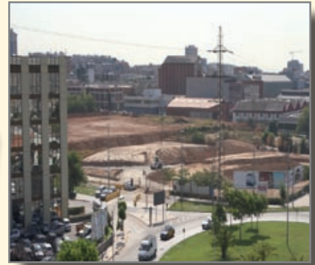
Las obras del parque ciclista avanzan a buen ritmo y estarán acabadas en septiembre

Una de las partidas más importantes del FEIL, 3 millones de euros, se destina a la ampliación y mejora del polideportivo Francesc Calvet. En la planta baja se aprecia la distribución de los nuevos vestuarios de piscina y del vestíbulo. También en la planta baja se ha iniciado la cimentación para ampliar el polideportivo que dispondrá de una nueva zona