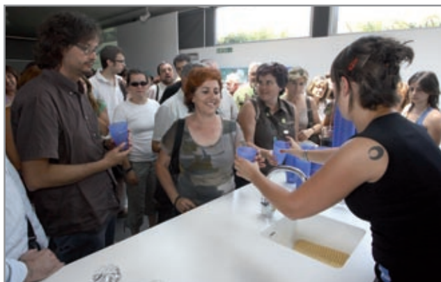
Professors durant el tast d'aigua que es va fer en l'acte de cloenda del curs a l'estació de tractament d'aigua potable de Sant Joan Despí

La comunitat educativa va tancar el curs amb una visita a l'estació de tractament d'aigua potable (ETAP) de Sant Joan Despí. Uns 170 representants dels centres educatius van tenir l'oportunitat de conèixer de primera mà el material pedagògic que ofereix la planta d'Aigües de Barcelona sobre el cicle de l'aigua i, a més, van tastar l'aigua del futur, que incorpora el tractament de l'osmosi inversa, que millora notablement el gust. A l'estiu també ho començarem a notar a les nostres aixetes, ja que és quan es posaran en marxa els projectes que s'estan fent a l'àrea metropolitana per millorar l'abastament i la qualitat de l'aigua, com aquesta planta d'osmosi inversa que es construeix a l'ETAP.