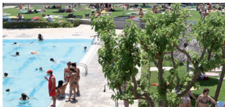
Les piscines són un lloc agradable per compartir amb la família o les amistats

La zona de solàrium és molt àmplia i amb bones vistes del parc de la Font Santa. També cal destacar que la instal·lació disposa de servei de tennis de taula per poder fer encara més activitats. La temporada finalitza el diumenge 6 de setembre.