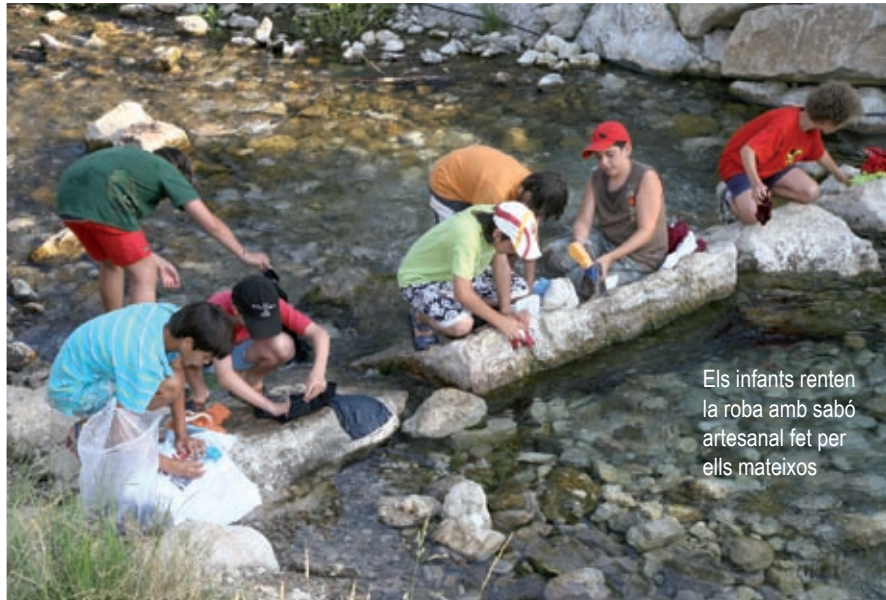
Els infants renten la roba amb sabó artesanal fet per ells mateixos