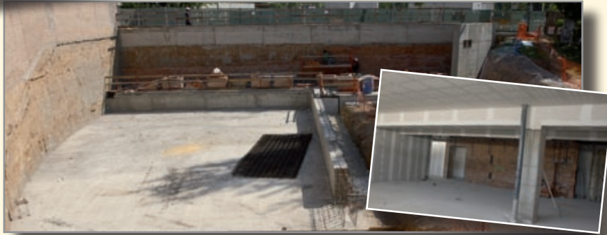
A la izquierda se aprecia el inicio de la cimentación de la nueva zona de wellness . En la pequeña, el espacio donde se ubicarán las salas de actividades dirigidas