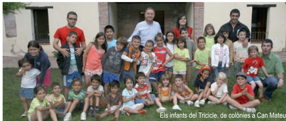
Els infants del Tricicle, de colònies a Can Mateu