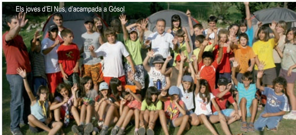
Els joves d'El Nus, d'acampada a Gósol

A la pàgina anterior, alguns dels 33 infants del Club d'esplai El Tricicle, que van passar uns dies de colònies a la casa de Can Mateu, a Vilanova de Sau, on van jugar, compartir i participar, en definitiva, de totes les propostes de lleure. En aquesta mateixa pàgina, joves d'una de les acampades organitzada pel Centre d'Esplai Nus, en aquest cas a Gósol. Els joves van aprofitar el dia per gaudir de la natura en un marc incomparable, el Pirineu. L'alcalde, Antoni Poveda, els va fer una visita (a la superior, a Can Mateu i a la inferior a Gósol).