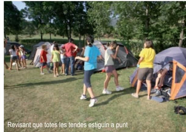
Revisant que totes les tendes estiguin a punt