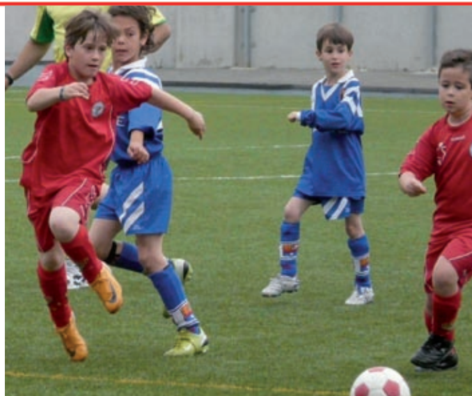
El torneo, dirigido a los más pequeños, contó con un cartel de lujo

La Diada de Promesas que organiza el Futbol Club Levante Las Planas ha vuelto a ser un éxito, tanto a nivel organizativo como deportivo y, tanto los padres y madres de los participantes como aquellos aficionados a los que les gusta el fútbol base, pudieron disfrutar del gran nivel de juego ofrecido por todos los equipos.