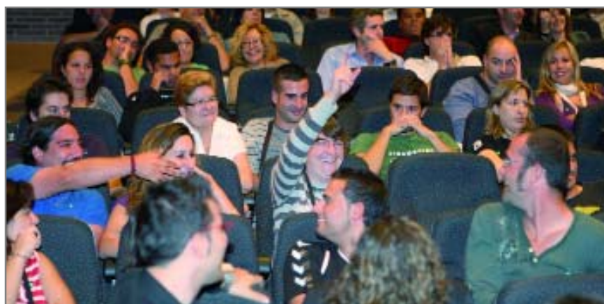
Algunos de los afortunados no pudieron reprimir su alegría al escuchar su número

nas jóvenes que quieren emanciparse a precios asequibles y poder optar, en un futuro, a una vivienda en propiedad. De las 45 viviendas dos estaban reservadas a personas con discapacidad (sólo se presentaron dos solicitudes), cinco para mayores de 65 años (optaron 5 personas) y otras tantas para personas divorciadas o separadas, a los que también optaron cinco. Del sorteo general se extrajeron 33 números y otros 33 de reserva en caso de que se produzcan renunciaciones.