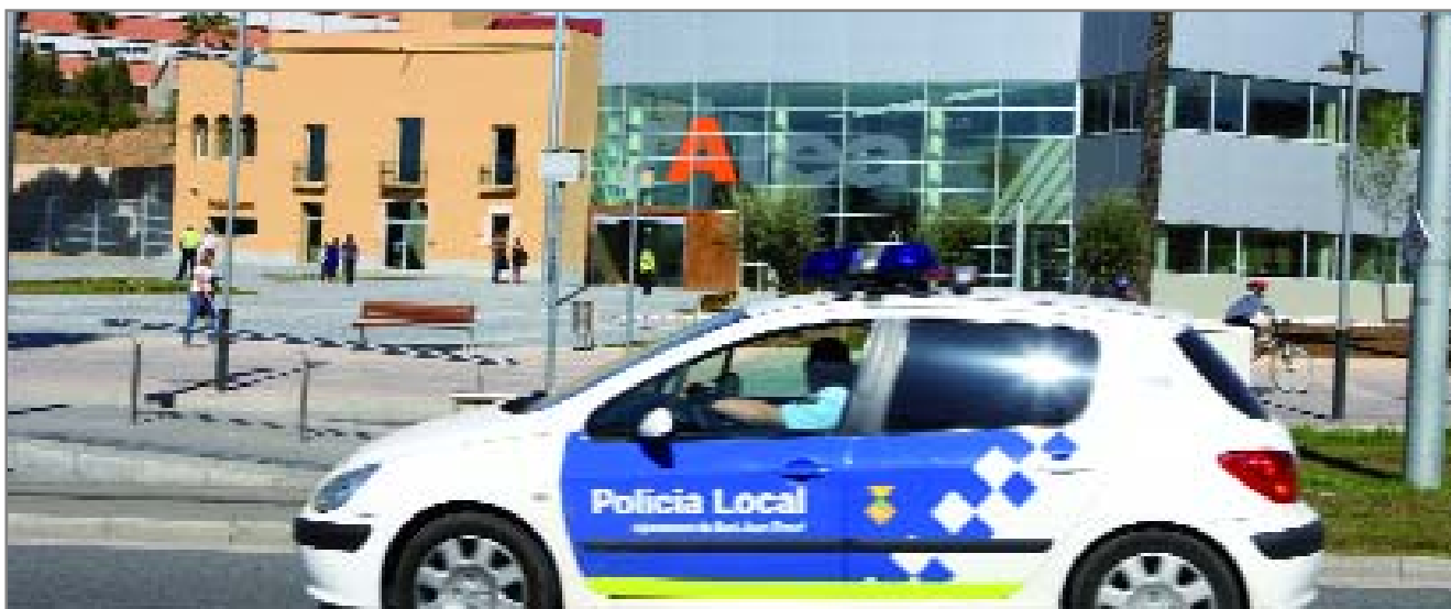
Un cotxe de la Policia Local, patrullant davant les noves instal·lacions del cos i de la nova Àrea de Serveis a la Persona

L'atenció a la ciutadania millora amb aquestes instal·lacions, ubicades a l'avinguda de Barcelona 41, equidistants dels quatre barris de Sant Joan Despí