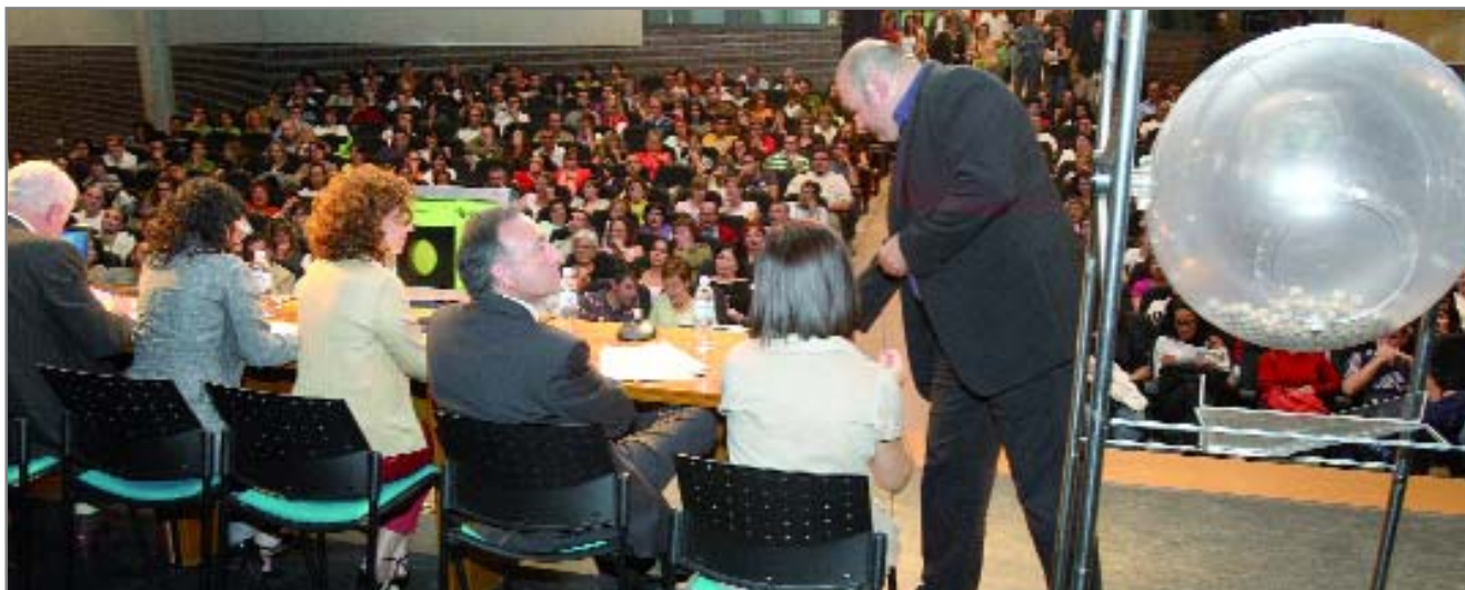
El Auditori Miquel Martí i Pol se llenó de solicitantes y familiares para seguir el sorteo de los pisos de alquiler

El sorteo público de las viviendas se realizó el 30 de septiembre