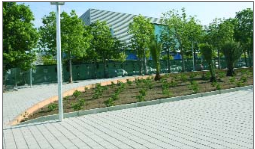
La nova plaça Montserrat Roig s'obrirà a la ciutadania el 9 de novembre

La plaça, que ocupa al voltant de 3.300 metres quadrats, incorpora també un espai central destinat a jocs infantils. La remodelació també s'ha aprofitat per renovar el mobiliari urbà amb nous bancs, papereres i fanals. L'espai incorpora noves zones verdes