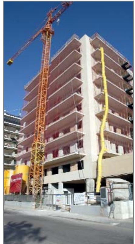
Las obras avanzan al ritmo previsto

En este butlletí se adjunta un díptico que recoge las características de las viviendas además de otras condiciones para poder optar a la nueva promoción de pisos con protección.