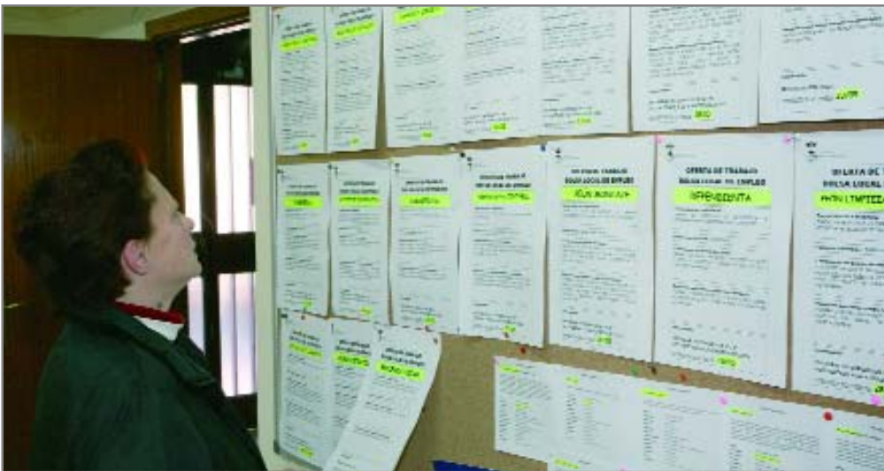
Una mujer consulta las ofertas de empleo en los locales del Departament de Foment de l'Ocupació

El Ayuntamiento pone en marcha un plan de fomento de la ocupación con actuaciones para disminuir el desempleo, aumentar la formación y fortalecer el tejido productivo por un coste de 1.368.000 euros