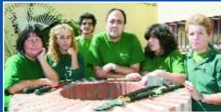
talleres de empleo