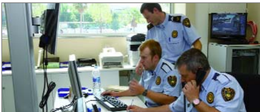
La Policia Local atén a la recuperada masia des del 29 de setembre

L'aposta municipal era clara: ubicar els serveis en un lloc estratègic per guanyar centralitat, l'avinguda de Barcelona, i més ben comunicades, amb la parada del tramvia al davant. Així, la Policia Local ocupa la planta baixa de la masia que, sumant altres espais exteriors (com l'aparcament cobert per als cotxes policials), arriba als gairebé 900 metres quadrats. Despatxos, sales de reunió, d'atenció al públic i una gran sala d'actes amb capacitat per a més de 60 persones,