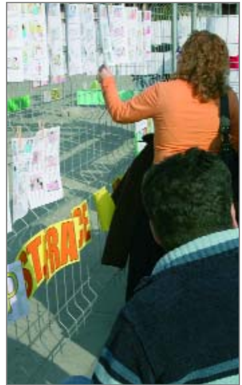
L'any passat, les escoles van participar a les jornades preparant un còmic

Els actes es tancaran el 5 de desembre amb un videofòrum del curtmetratge Disminuir el paso , protagonitzat per joves amb discapacitat. Serà al casal de joves El Bulevard de 19 a 21 h.