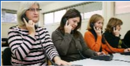
planes de ocupación