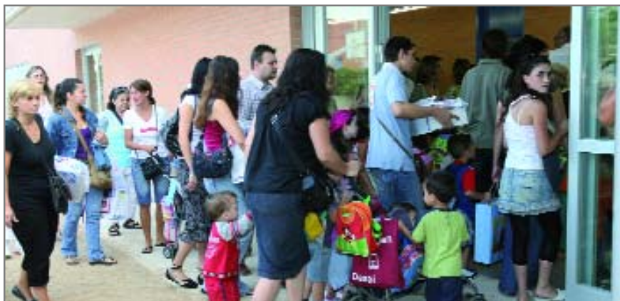
Els infants podran descobrir la importància de la mobilitat sostenible a través de tallers

Els infants tindran l'oportunitat de descobrir què és la mobilitat sostenible amb jocs senzills, mentre que els seus pares ho faran a través de les xerrades. Caminar fins a l'escola,