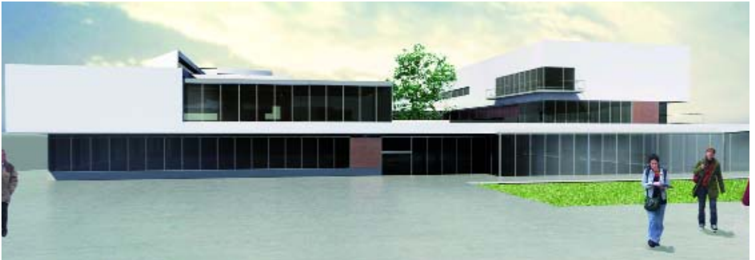
Imatge virtual de la façana principal de la futura biblioteca, que estarà presidida per una gran plaça

Les obres del nou equipament, que es construirà al barri Centre, s'iniciaran a principi del pròxim any 2009 i tenen un pressupost de 16 milions d'euros