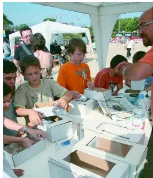
Infants participant en un dels tallers de reciclatge que es van fer l'any passat, en el marc de la Setmana Verda

com a la tarda es realitzaran tallers de sensibilització per a la canalla, a més d'un estand informatiu amb missatges conscienciadors sobre el medi ambient, a tots els barris de la ciutat. L'estalvi d'aigua serà un dels eixos d'aquesta Setmana Verda, però no l'únic. També ens hem de conscienciar sobre altres aspectes com l'estalvi energètic o la necessitat de reciclar, en definitiva de caminar cap a un model de vida més sostenible. Per últim, i coincidint amb la cloenda de les escoles esportives, el 7 de juny, al parc de la Font Santa, els més petits podran "pilotar" cotxes de rally que es mouen amb energia solar. Podeu consultar tota la informació amb detall al díptic que s'adjunta amb aquest butlletí.