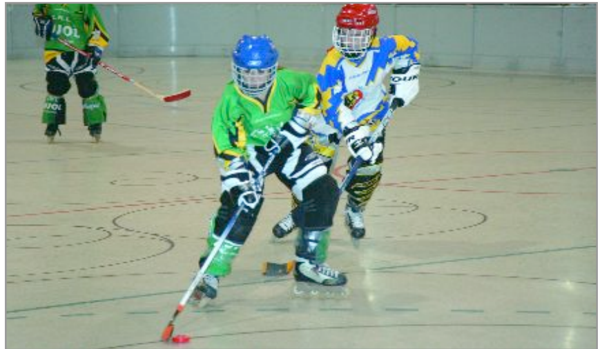
Una imagen de la final en la que el CHL Jujol puso digna resistencia ante el gran favorito

El campeonato fue un éxito a todos los niveles: de organización, de calidad en el juego y de asistencia de público ya que hubo lleno absoluto no sólo en la final sino en otros partidos disputados. Cabe resaltar que el CHL Jujol consiguió el suficiente número de voluntariado para lograr que todo funcionara a la perfección.