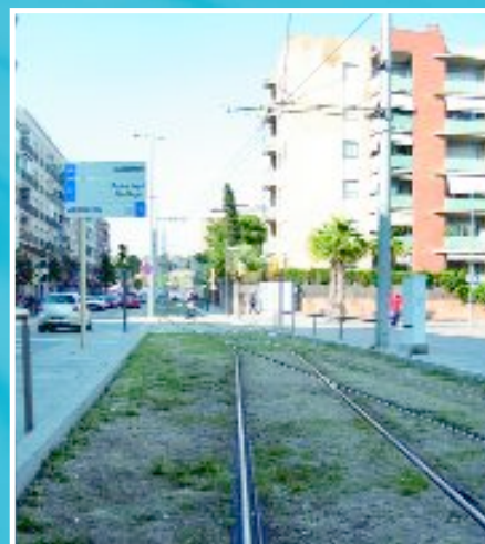
La plataforma de gespa del tramvia es rega amb aigua no potable. D'altra banda, a mitjan maig es va començar a regar de nou la gespa de la plataforma amb aigua procedent de la depuradora.

D'altra banda, la temporada de bany a les piscines de la Font Santa obrirà el 14 de juny plena d'aigua. Durant l'any, les aigües han estat tractades i depurades per no haver de buidar-la. Tot i això, l'evaporació fa que d'un any a l'altre es perdi una mica d'aigua que enguany s'ha reomplert amb aigua del subsòl.