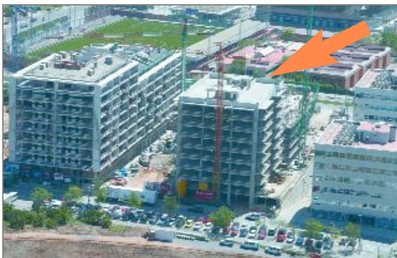
A dalt, imatge aèria de l'edifici en construcció del carrer de la Font Santa número 48, que tindrà 72 habitatges destinats a la venda

Ja és visible l'estructura de l'edifici del carrer de la Font Santa número 48, on l'empresa municipal ADSA està fent 72 habitatges públics destinats a la venda. És el