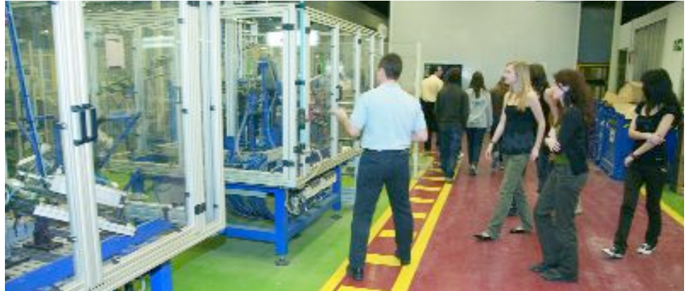
Alumnos del IES Salvador i Pedrol durante su reciente visita a Nobel Plàstiques Ibèrica

Escuela y empresa son dos ámbitos que deben estar cada vez más en contacto para dar respuestas tanto a los estudiantes (futuros trabajadores) como al sector productivo, que ha de encontrar los perfiles profesionales que necesita para desarrollar su actividad. A nivel local, es importante que el alumnado conozca la realidad laboral que le rodea y pueda así decidir sobre su futuro profesional con más elementos de juicio. Desde el mundo de la empresa, también existe la necesidad de establecer puentes de relación con el sector educativo. Por eso, el Ayuntamiento, a través del Departament de Foment de l'Ocupació i Comerç, ha puesto en marcha mecanismos para acercar estas dos realidades y se están llevando a cabo diferentes acciones en este sentido entre las que destacan, por ejemplo, las visitas a comercios y empresas que se vienen desarrollando en los últimos meses. Hasta la fecha, un total de 134 alumnos de secundaria de Sant Joan