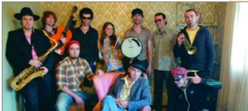
La Família Rústika actuarà el 23 de maig al Bulevard