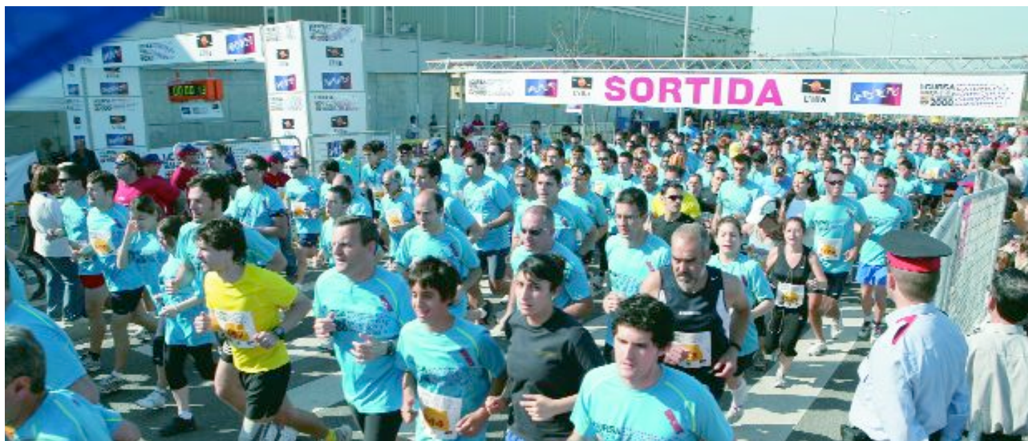
La primera edició de la cursa organitzada pel FC Barcelona pels carrers de la nostra ciutat va aconseguir la participació de 1.541 corredors

Més de 1.500 persones van participar en una cursa de 7 quilòmetres per Sant Joan Despí perfectament organitzada