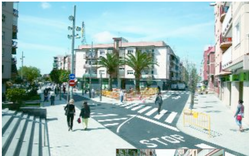
Los peatones han ganado espacio con la reforma de la plaza de Espanya (foto de arriba). A la derecha, detalle de la remodelación en la calle Extremadura

Así pues, después de las obras la plaza se ha convertido en una plataforma única dejando a una misma altura las aceras y el espacio que antes ocupaba la propia plaza. Para conseguirlo se han elevado los pasos de peatones de las calles Joan Maragall, JF Kennedy y Cornellà. Con la remodelación la plaza ha ganado espacio además de zonas verdes. Por otro lado, la calle Extremadura ahora dispone de aceras más amplias (2,30 metros), se han