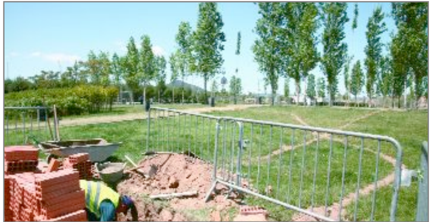
Obres al parc del Mil·lenari per connectar-lo a la xarxa de reg de les aigües freàtiques

De moment, totes les zones verdes de l'Eixample del barri Centre, com el parc del Sol Solet, el del Mil·lenari o de la rambla Jujol estan connectades a aquesta xarxa, però l'objectiu és estendre la xarxa a tot el municipi. Fins ara, l'aigua es carregava en unes cubes que després es distribuïen a les zones verdes i els espais on era necessari regar. Però amb aquest sistema, el reg de les zones verdes es connectarà