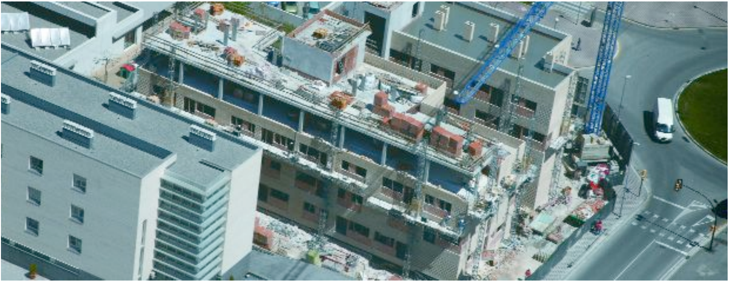
Les obres de l'edifici dels pisos de lloguer avancen a bon ritme. En aquests moments s'està enllestint la façana

Aquest mes s'obre el període per sol·licitar els 45 pisos de lloguer de la rambla Jujol. En pocs mesos s'obrirà el termini per demanar 72 pisos protegits de venda