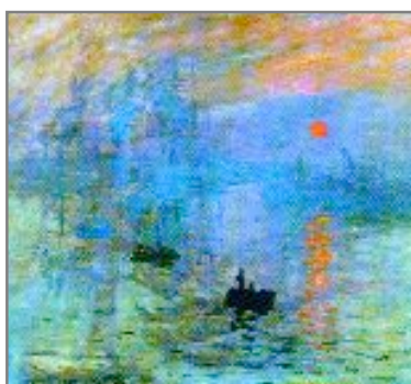
Quadre impressionista de Monet, un dels exponents de l'impressionisme

Així, podrem admirar quadres que reflecteixen la vida quotidiana, peces de ceràmica que juguen amb les ombres i, fins i tot, un vestit amb estampacions de colors característiques de l'època, com els vermells o els blaus. La mostra s'ha convertit en l'aparador dels treballs de fi de curs