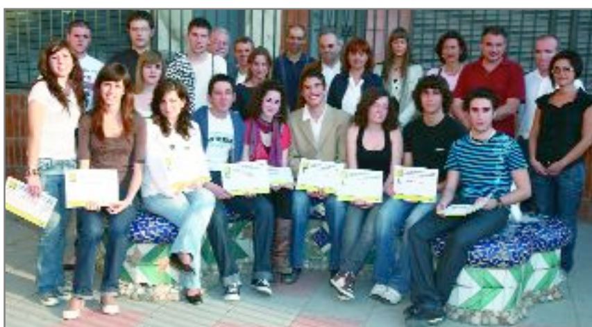
Imatge del jurat i dels participants d'aquesta convocatòria en l'acte que es va celebrar a Can Negre