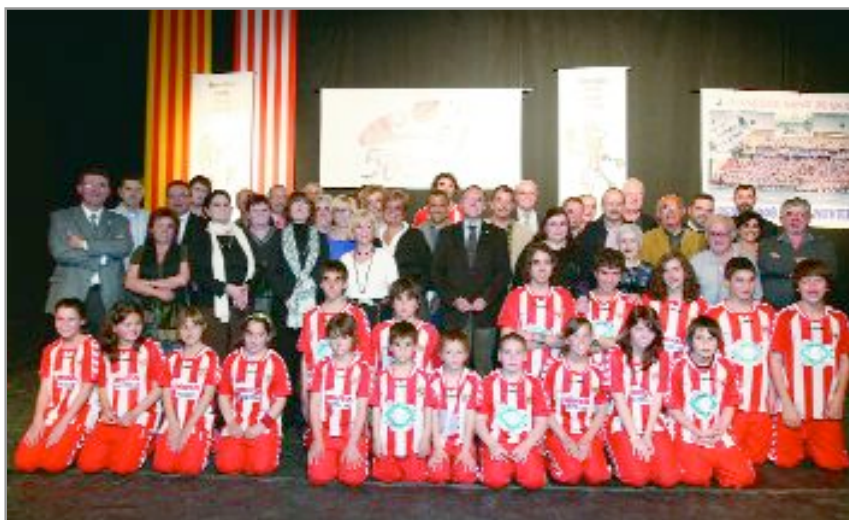
El passat i el futur es van aplegar a la presentació, on es va retre homenatge a persones que han fet gran la història del Club