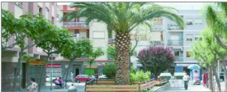
El plan se elabora con la participación de la Diputació de Barcelona

El objetivo es crear un documento-guía que ayude a resolver conflictos en el espacio público