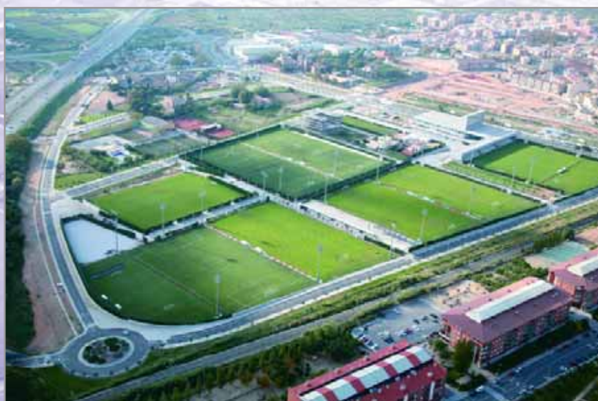
La Ciutat Esportiva continua creixent en equipaments per als esportistes de la pedrera