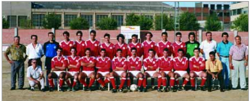
Formación de la temporada 1992-93, cuando el equipo militaba en Primera Catalana

A partir de entonces el equipo bajó categorías hasta ocupar plaza en la actualidad en Segunda Territorial.