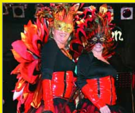
Modalitat Parella-Trio: la Luxúria (primer premi) i Les tres abelles (2n)