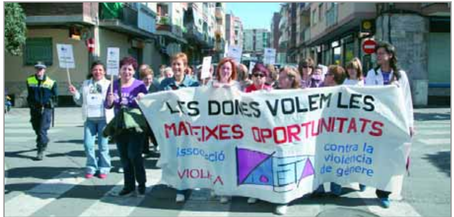
La caminada de dones, una de les activitats més tradicionals dels actes commemoratius

L'art també serà protagonista durant el programa. Del 3 al 16 de març Can Negre acollirà l'exposició "Les dones despí i l'art", que recull els treballs artístics de les dones santjoanenes, el 7 de març la companyia Q-Ars Teatre presenta a l'Auditori Leonce + Lena , interpretada exclusivament per dones i