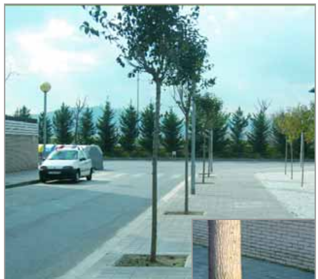
Arriba, algunos de los árboles que se han replantado para sustituir a los anteriores ejemplares, las raíces de los cuales estaban afectando el pavimento de algunas calles (fotografía pequeña)

A finales de enero se inició la sustitución de algunos árboles situados en el barrio Centre cuyas raíces estaban provocando el levantamiento de una parte de las aceras. En algunos casos, estaban incluso afectando a la instalación de servicios subterráneos. Así pues, las nuevas especies que se plantarán, de poca raíz como por ejemplo magnolias, evitarán este tipo de problemas. Los ejemplares se sustituirán en Maria Tarrida, Jacint Verdaguer, Baltasar d'Espanya, Montjuïc y Joan Vinyoli. En las próximas semanas también se sustituirán en algunas calles de la zona industrial como en Sant Martí de l'Erm, Jacint Verdaguer, avenida de la Generalitat o Mare de Déu de Montserrat.