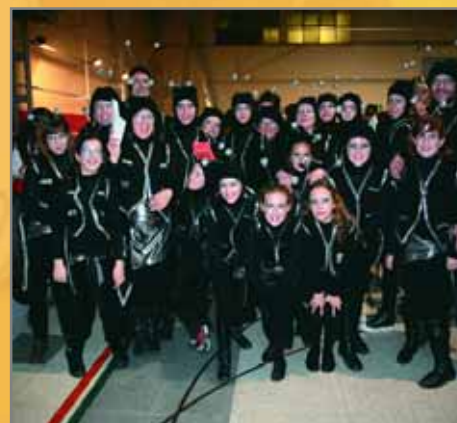
Modalitat Comparsa Les formigues (primer premi) i Cervesa Cruzcampo (segon premi)