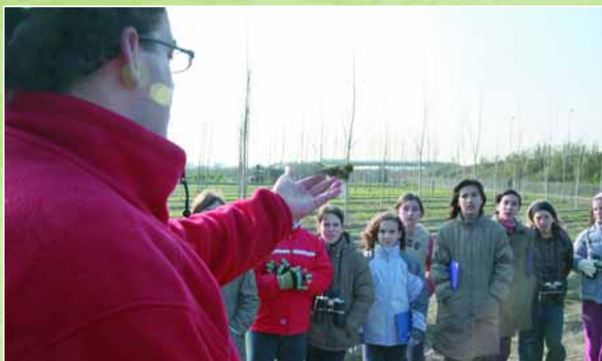
Infants de l'escola Pau Casals participant en una de les sessions d'anellament d'ocells

Per tal que la població pugui gaudir i participar de l'observació d'aus, l'Ajuntament programa sortides mediambientals. La propera serà l'1 de març, en què, a més de fer l'observació d'aus, hi haurà una sessió d'anellament científic d'ocells a càrrec del C.M. L'Arrel. Per participar-hi cal fer inscripció al telèfon 93 480 60 16 o bé enviar un correu a mediambient@sjdespi.net