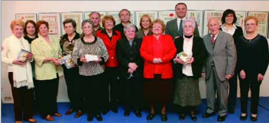
Imagen de grupo de los participantes y ganadores del certamen literario

El certamen pretende promover la escritura entre las personas mayores