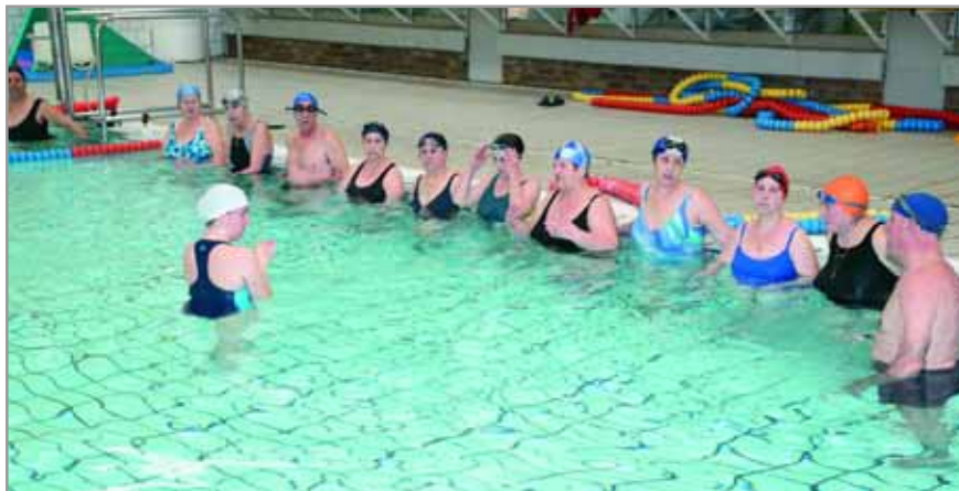
La actividad acuática es muy beneficiosa para el colectivo de la tercera edad

Iniciación , en el que las sesiones se desarrollan en la piscina mediana, donde el fondo es de un metro y está dirigido a personas que no saben nadar.