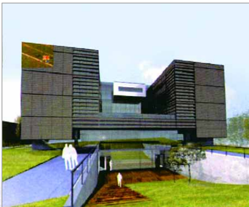
Perspectiva del nou edifici La Masia que es construirà a la Ciutat Esportiva Joan Gamper

L'antiga masia, que va ser inaugurada al 1979 deixarà així de fer la seva funció de residència i passarà a ser un edifici institucional del club. L'antiga casa pairal es convertirà en una seu social corporativa del club barcelonista.