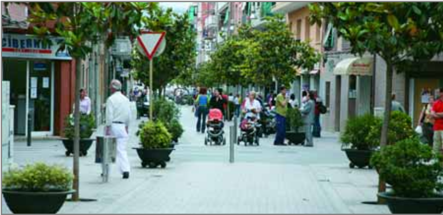
Los ayuntamientos tendrán más protagonismo en la tramitación y adjudicación de las ayudas

Además, reconoce el derecho a los servicios sociales a todas las personas