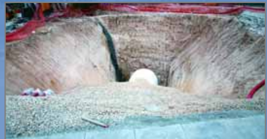
A dalt, imatge d'una part de la plaça Sant Pancrac tancada per tal de poder continuar amb les obres del tub (fotografia inferior)