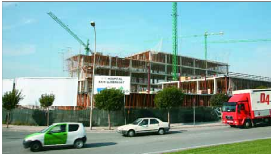
L'edifici, que tindrà una gran zona verda al costat, ja ha aixecat l'estructura