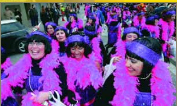
Rua multitudinària. Del Centre al parc de la Font Santa passant per les Planes, milers de persones van llançar-se al carrer per participar de la festa, que va acabar al parc amb un ball.