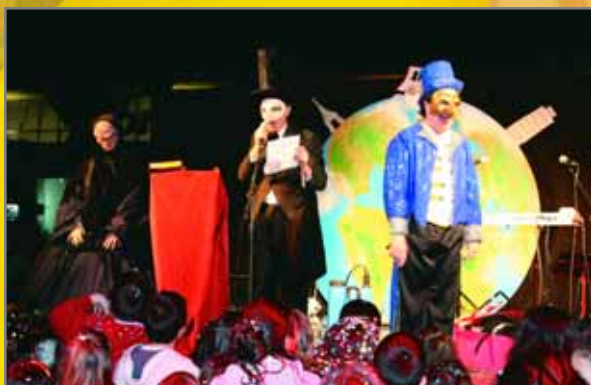
Enterrament de la sardina. Després de tanta gresca, el Rei acaba els seus dies convertit en cendra per ressorgir, amb més força, l'any vinent.