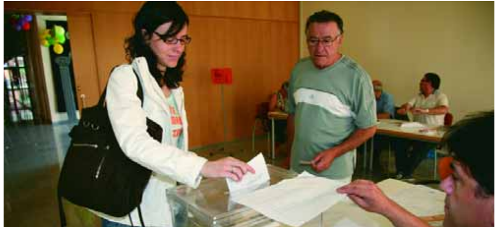
Los ciudadanos podrán ejercer su derecho al voto en alguna de las 41 mesas electorales

En Sant Joan Despí habrá un total de 41 mesas electorales repartidas en 8 colegios electorales. Una de las novedades de estos comicios es que el polideportivo Salvador Gimeno suma una nueva mesa electoral. Además, hay que recordar que las personas que en anteriores elecciones votaban en la escuela Sant Francesc d'Assís lo harán a partir de ahora y de manera definitiva, en el Polideportivo Salvador Gimeno y, los electores de la escuela Gran Capitán en el Pascual Cañís. Además, hasta el