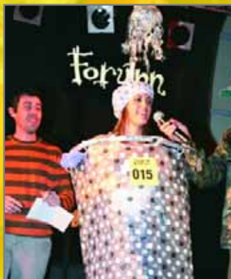
Modalitat Individual: Dutxa (primer premi) i Vaixell de paper (2n)