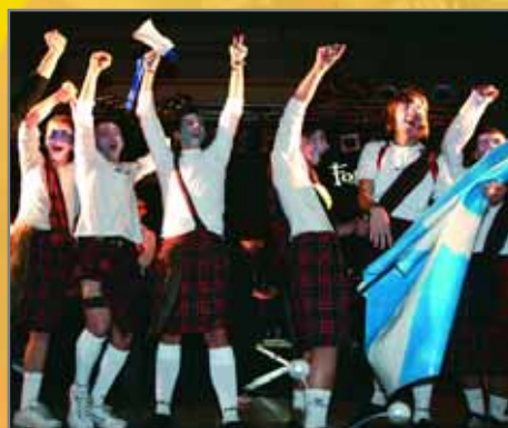
Modalitat Grup: Braveheart (primer premi) i Papallones (2n)