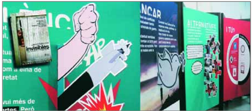
Detalls de l'exposició "La violència que no acceptem" i, en petit, a l'esquerra imatge del documental Invisibles

El programa continuarà a l'abril amb la utopia "Invisibles, medicina contra