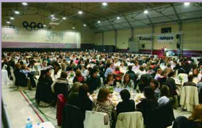
Prop d'un miler de dones van participar a l'edició passada del sopar