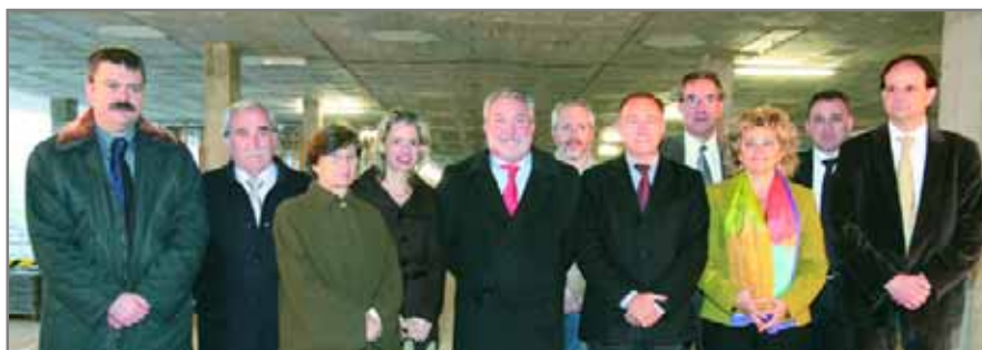
El ministre i la consellera, amb diferents alcaldes i alcaldesses del Baix Llobregat

L'Hospital Comarcal del Baix Llobregat és un centre del Consorci Sanitari Integral, una entitat pública participada pel Servei Català de la Salut, l'Institut Català de la Salut, l'Ajuntament de Sant Joan Despí, l'Ajuntament de l'Hospitalet de Llobregat, el Consell Comarcal del Baix Llobregat i la Creu Roja.