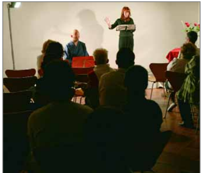
A les Festes de Sant Jordi del 2007 es va fer una sessió de contes zen

Si hi vols participar, pots adreçar-te a la Biblioteca Miquel Martí i Pol (avinguda de Barcelona, 83-85, telèfon 93 477 12 82) o bé enviar un correu electrònic a: b.st.joand.mmp@diba.cat o asp@sjdespi.net , fins al 12 de març.