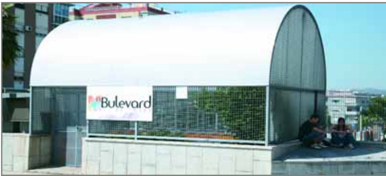
El Punt Jove de Salut, ubicat al Bulevard, dona servei de 17 a 21 hores els dilluns

L'espai, ubicat al Bulevard, ajuda la gent jove a resoldre dubtes relacionats amb la salut