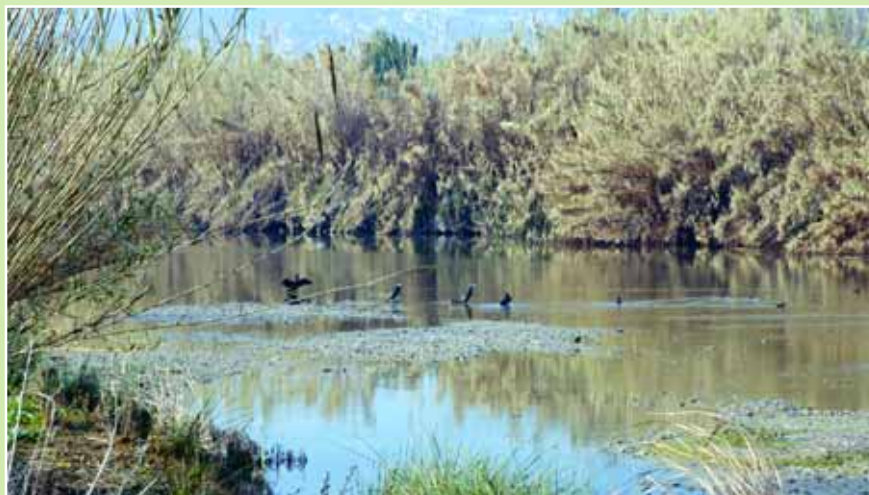
A Sant Joan Despí es van comptabilitzar 217 ocells durant el cens que va fer L'Arrel

Una de les iniciatives més recents ha estat el 1r Cens Simultani d'Ocells Hivernants al curs baix del Llobregat, iniciativa en què va participar Sant Joan Despí de la mà del Centre Mediambiental L'Arrel. Més de vint persones es van aplegar a diferents trams del riu (des d'Esparreguera fins a Cornellà) per comptabilitzar les aus que ara estan hivernant al riu. A Sant Joan Despí es van comptabilitzar 217 ocells, entre les quals hi havia martinets blancs, fotges, bernats pescaires... tot i que els ànecs van ser els grans protagonistes, amb la presència de dues espècies poc habituals a la zona com són els ànecs xiulaires i els grisets.