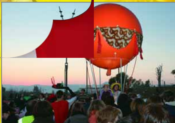
Arribada de l'emissari del Rei Carnestoltes. La ciutat es prepara per a una setmana de disbauxa amb una festa al parc de la Font Santa el dia 31 de gener. A les imatges, l'emissari, en globus, i una de les moltes truites participants en una original convocatòria carnavalesca-culinària.