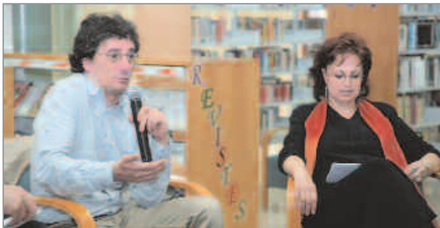
La entrega de premios del año pasado contó con la participación del popular escritor Albert Sánchez Piñol

Así pues, el certamen otorgará un premio de 1.176 euros al mejor relato y