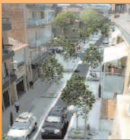
Reforma de carrers

En el capítol d'inversions de l'Ajuntament destaca l'inici enguany de les obres de construcció del nou centre cultural i biblioteca del barri Centre, per al qual es destinen aquest any cinc milions d'euros. Està previst que, en dos anys i mig, la instal·lació pugui estar enllestida. El 2008 serà també l'any de l'entrada en servei del nou edifici de l'Àrea de Serveis a la Persona, ara en construcció, que també acollirà les dependències de la Policia Local. S'hi destinen 330.000 euros per a acabar les obres.