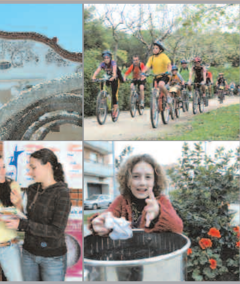
municipal incluye partidas de marcado carácter ciudadano

de Sant Joan Despí seguirá durante los doce meses para dar respuestas y servicios a la ciudadanía. elementos destacados del presupuesto municipal