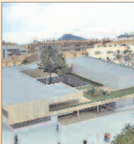
Biblioteca i centre cultural

Entre l'Ajuntament i ADSA s'invertiran 42 milions en nous projectes a la ciutat