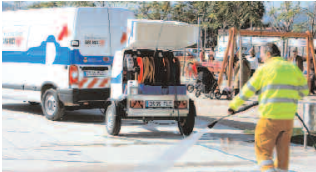
La limpieza de calles y plazas se realizará pronto con agua del freático

En breve las aguas que se utilizan para limpiar las calles y las plazas de la ciudad se sacarán del subsuelo, concretamente de un pozo situado en la carretera Dreta, en la zona agrícola. El objetivo es aprovechar estas aguas freáticas (que no son potables) para reducir el uso del agua corriente. Así pues, en las próximas semanas se adecuará la salida del pozo de forma que se puedan cargar las cubas destinadas a la limpieza. Pero el objetivo final es mucho más ambicioso, puesto que se prevé que estas aguas se puedan destinar también al riego de parques y jardines. Por el momento, el Ayuntamiento trabaja en la implantación de una red de tuberías que canalice el agua a unos lugares concretos donde se instalarán hidrantes que se usarán por el riego. En una