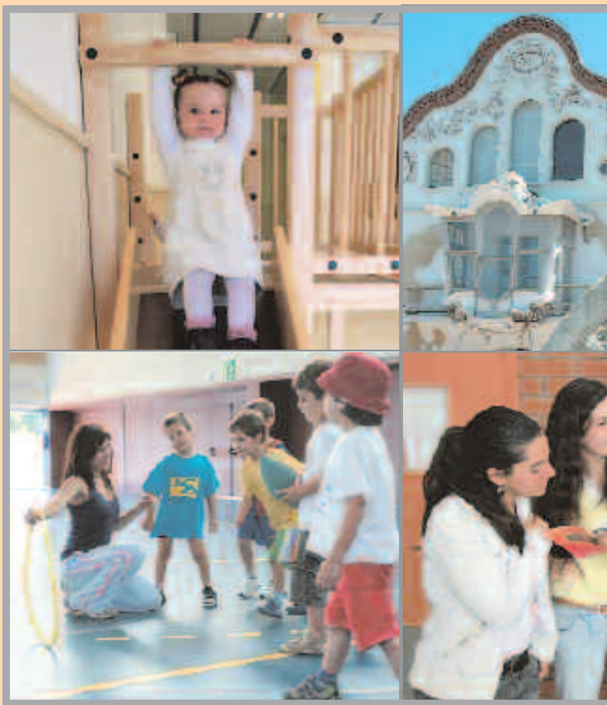
Educación, cultura, deporte, tiempo libre, atención a las personas... el presupuesto mu

Cada uno de los departamentos del Ayuntamiento de 2008 desarrollando proyectos y actuaciones Son, además de las grandes inversiones, también