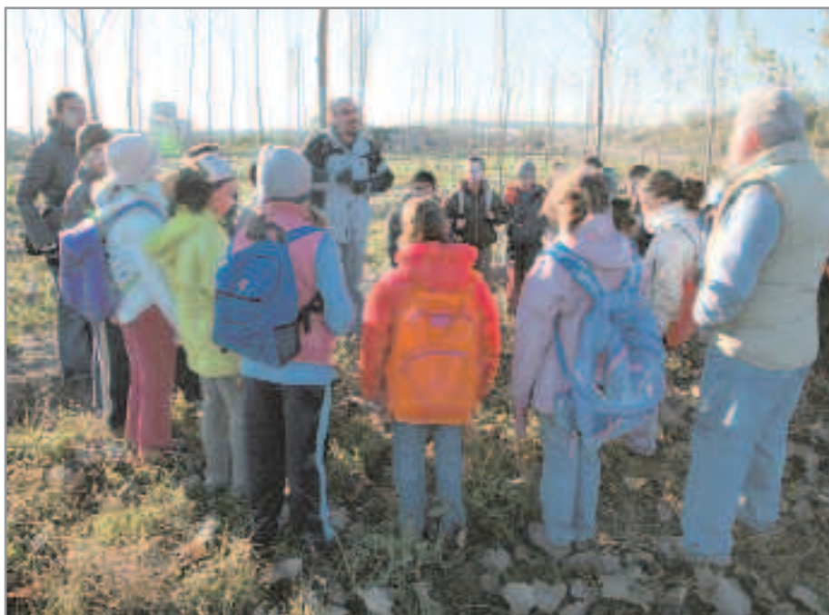
Els nens i nenes de les escoles de Sant Joan Despí que participen a la iniciativa tenen cura d'aquest hort on ja han plantat cebes, alls, enciams, bledes...

Centre Mediambiental L'Arrel, "l'objectiu no és només que puguin conèixer in situ la feina de pagès, sinó també ensenyar-los una forma de conrear respectuosa amb el medi ambient".