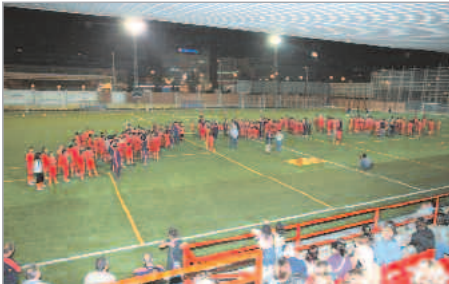
El Levante volverá a vivir momentos intensos y emotivos

La trayectoria de la entidad a nivel deportivo ha transcurrido con etapas de grandes éxitos deportivos, como la temporada en que el equipo amateur estuvo a punto de subir a Tercera División, y de otras no tan brillantes, pero siempre ha destacado por la apuesta por el fútbol base y así gran cantidad de jugadores de la cantera del club. Un hecho especialmente significativo del FC Levante es la gran tarea de promoción del fútbol femenino que ha realizado en los últimos años, con un número muy importante de jugadoras amateurs , pero con equipos feme-