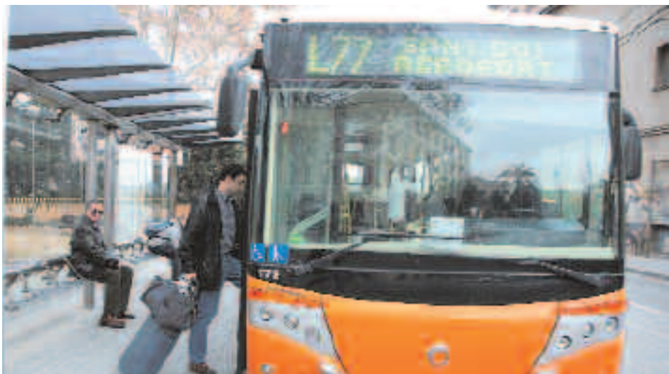
Conexión directa. El nuevo autobús supondrá una conexión directa desde Sant Joan Despí con el aeropuerto y con Sant Boi, hasta ahora inexistente

Ir al aeropuerto en transporte público desde Sant Joan Despí será pronto más fácil. También cruzar el río para llegar a Sant Boi, municipio con el que, pese a ser colindante con nuestra ciudad, no había conexión directa. Esto será posible gracias a la prolongación de la línea L-77, que ahora une las terminales aéreas con Sant Boi y que variará su recorrido para llegar a Sant Joan Despí, pasando por Cornellà (intercambiador). La L-77, gestionada por la empresa Oliveras, tendrá parada, en principio, en la avenida de Barcelona con rambla Josep Maria Jujol. La Entitat Metropolitana del Transport (EMT) ya trabaja para la ampliación del recorrido de esta línea interurbana.