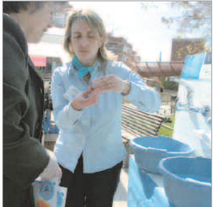
Los gestores de proximidad trabajan en contacto directo con la ciudadanía a la vez que reciben formación polivalente

La experiencia ha demostrado que los talleres de empleo son una herramienta muy eficaz para las personas que buscan trabajo, ya que ofrecen un tipo de formación muy diversa. De hecho, de las 16 personas que participaron en el pasado taller ocupacional (Gestores de intermediación ciudadana), impartido el año pasado en Sant Joan Despí, son ya 14 las que han conseguido un trabajo estable.