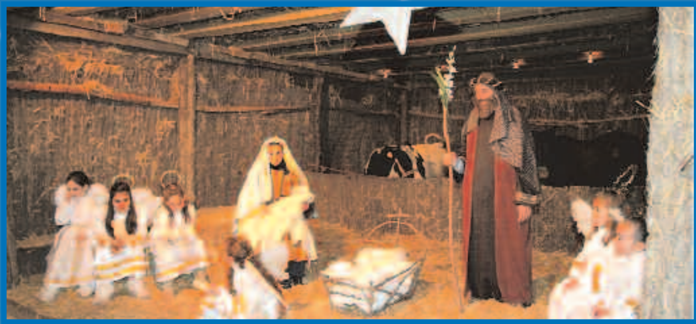
El pessebre vivent. Tot i la nova ubicació del 'Belén Viviente', la recreació de diferents escenes de la vida de Jesús i de la vida quotidiana de fa dos mil·lenis que realitzen un centenar de voluntaris del Centro Cultural Andaluz Vicente Aleixandre va tornar a ser un èxit. Envoltat de la natura del parc de la Fontansa, el nou escenari va ser força ben rebut pels visitants, entre ells, i com és costum, el president de la Generalitat, José Montilla, que el va recórrer el dia 23 de desembre amb la seva família.

Recull fotogràfic de diferents escenes nadalenques viscudes a Sant Joan Despí