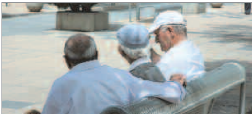
Este año también se tramitarán las ayudas para personas con dependencia severa

Los servicios sociales están realizando las entrevistas para determinar el tipo de ayudas