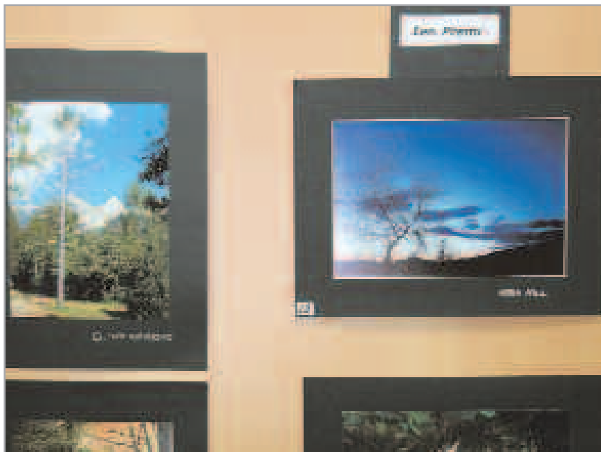
Les fotografies presentades a concurs han destacat per la seva qualitat

Una cinquantena de fotografies han estat exposades en el Concurs de Fotografia de Muntanya que ha organitzat el Centre Excursionista de Sant Joan Despí.