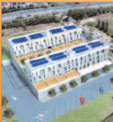
Pisos de lloguer