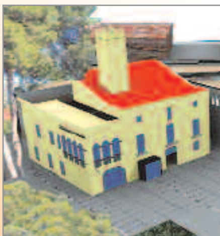
Àrea de Serveis a la Persona