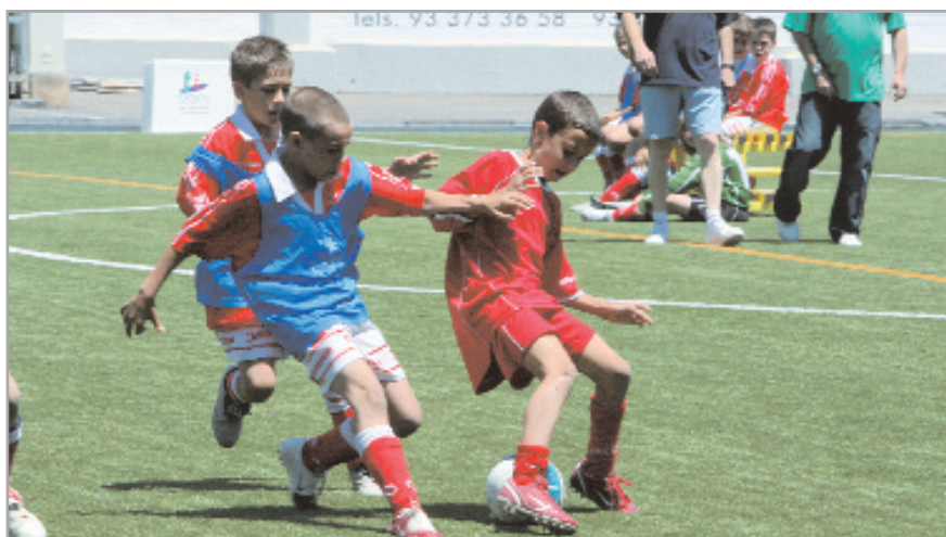
La Diada de Promeses es una de las citas importantes del fútbol base

Se ha disputado una nueva edición de la ya popular Diada de Promeses , un torneo de fútbol-7 que sirve para poner el punto y final al fútbol escolar del FC Levante las Planas.