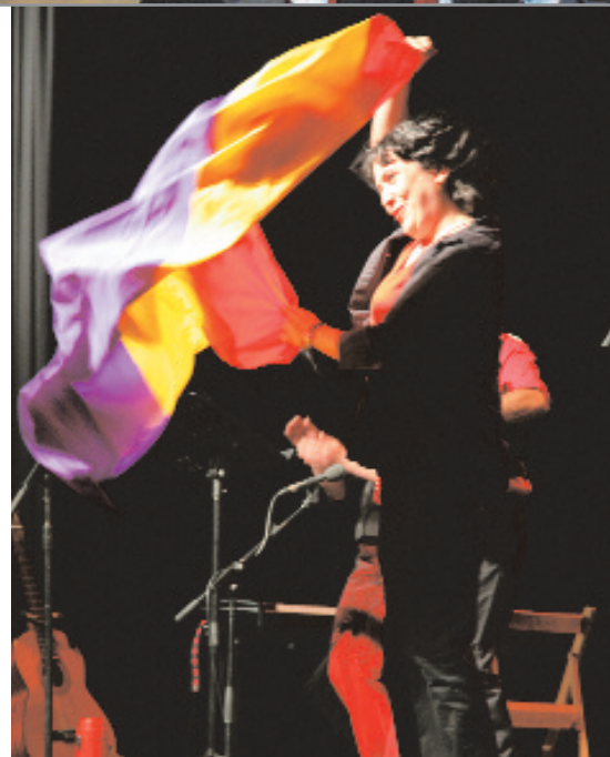
Arriba, un momento de la cena del vecino y sobre estas líneas, el espectáculo 'Anda jaleo, jaleo'