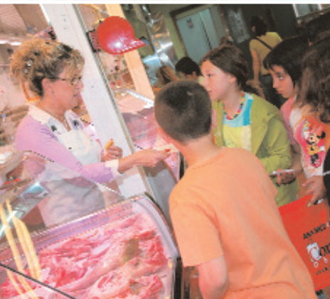
Los escolares se educan en materia alimentaria visitando los mercados

Cerca de un centenar de alumnos de ciclo medio y superior de las escuelas Espai 3 y La Unió se acercaron a los mercados de Les Planes y del barrio Centre para conocer de cerca los productos frescos que ofrecen. La actividad forma parte de la campaña "El mercat em cuida" que pretende concienciar a los niños y las niñas de las ventajas que tiene seguir una buena alimentación, a la vez que visitan los mercados, lugares dónde se pueden encontrar estos productos sanos y equilibrados. Antes de visitar los mercados los niños