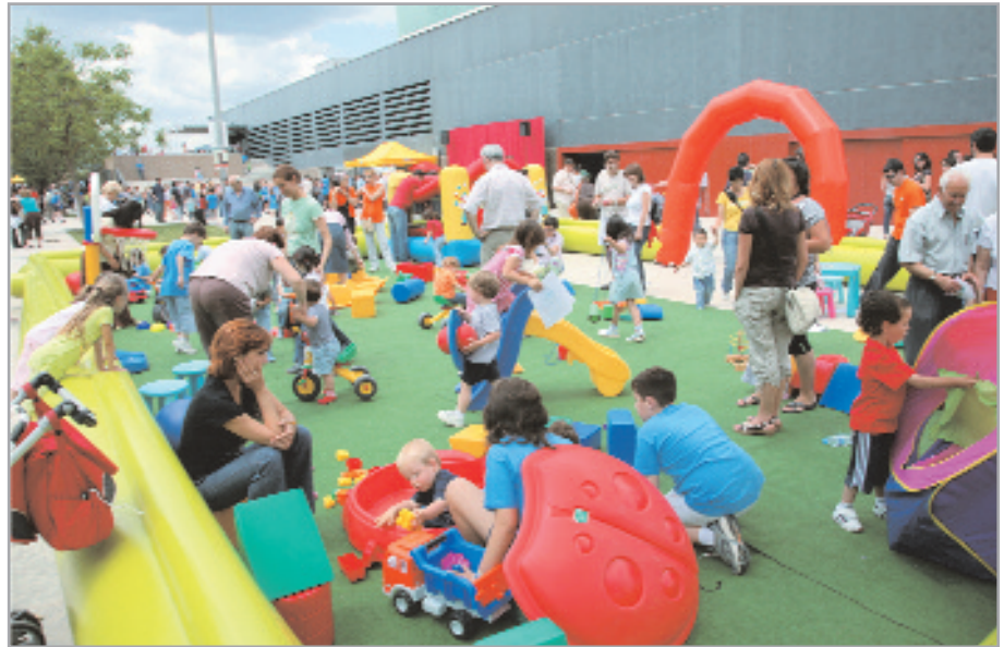
La Festa de Cloenda de l'Esport Escolar va comptar, de nou, amb una participació important

Durant tot el matí es van dur a terme un total de 18 activitats organitzades algunes per les diferents escoles esportives, i també d'activitats d'inflables, quads, ludoteca infantil, etc. També els participants van poder participar en el sorteig de diferents