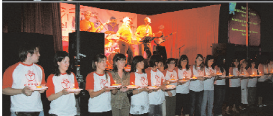
La primera foto mostra unes colònies a Sau, l'any 1997. A sota, un dels moments més significatius del sopar del 20è aniversari, realitzat el 8 de juny al poliesportiu del Mig

xia en nombre de nens i nenes, i també en activitats sempre impregnades "amb els nostres valors, cercant la utopia, la solidaritat i la felicitat" . Actualment hi ha 400 infants i joves d'entre 3 i 18 anys que participen en activitats durant la setmana i en època de vacances, als casals, colònies, etc. A més, han ampliat el seu projecte educatiu als infants de 12 a 36 mesos que participen en la