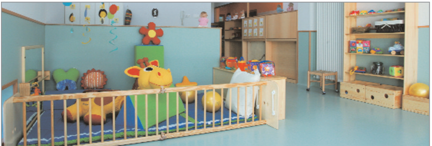
Una de les aules de l'escola bressol municipal Sol Solet, ubicada a l'Eixample del barri Centre

D'altra banda, continuen a bon ritme les obres de la construcció de la tercera escola bressol municipal, El Gegant del Pi, que es posarà en marxa aquest curs i que representarà 141 noves places.