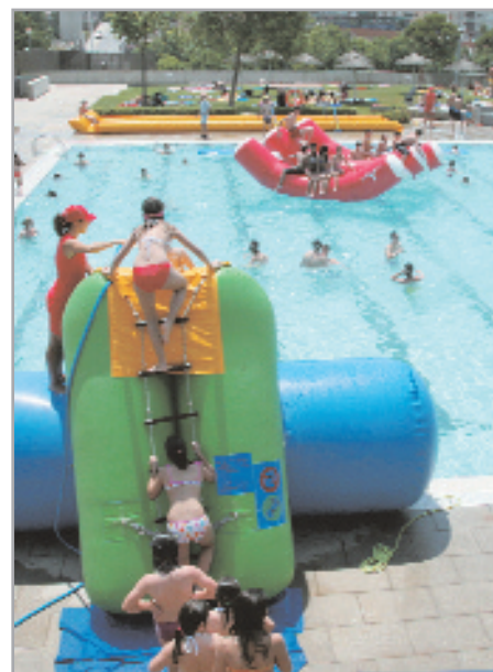
La piscina, l'indret més refrescant de la ciutat

La piscina obre d'11 a 19 hores, de dilluns a divendres, i de 10.30 a 19.30 hores, els dissabtes, diumenges i festius.