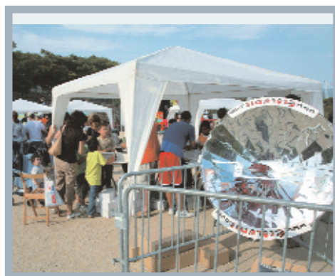
Els infants van poder participar en tallers de reciclatge (foto gran), comprovar com funciona un "excaletric" solar o com es capta l'energia solar (fotos petites)