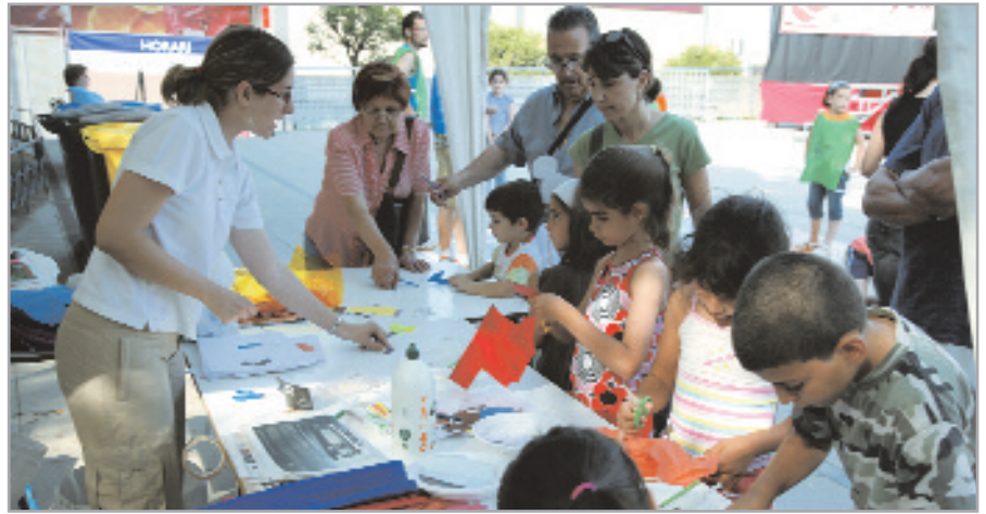
A l'esquerra, detalls de diversos productes de comerç just. A la dreta, foto d'un dels tallers participatius que es va realitzar

Sant Joan Despí es va sumar el 9 de juny a la celebració de la Festa del Comerç Just, que es va fer de manera simultània a moltes poblacions catalanes.