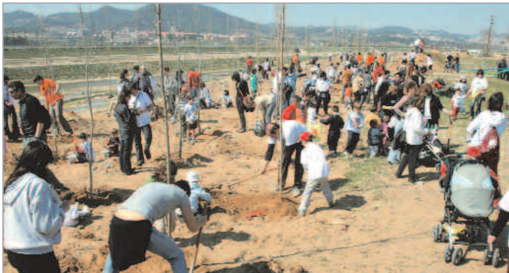
A dalt, a la dreta, els equips municipals regant la zona del bosc un cop plantada. La resta de fotos mostren diversos moments de la multitudinària plantada del 18 de març