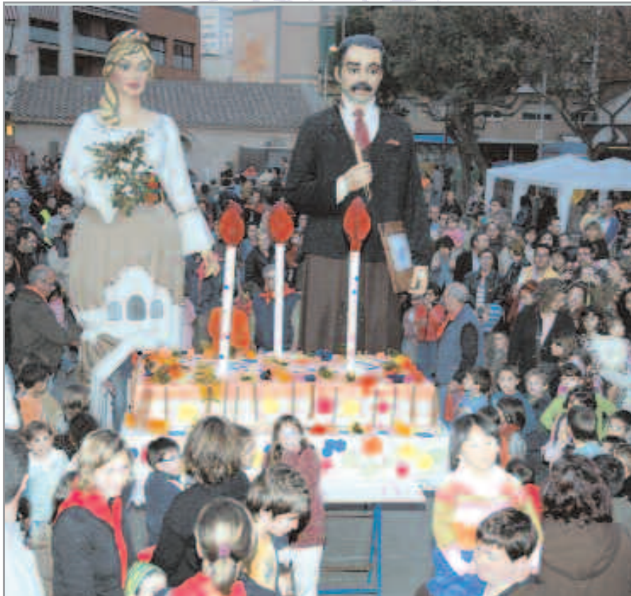
En Jujol i la Creació van celebrar, el 17 de març, el seu tercer aniversari

Manca menys d'un mes per a les celebracions de la Ciutat Gegantera. El 16 d'abril es presenta el cartell i l'himne oficial de l'esdeveniment