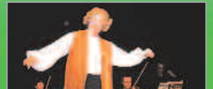
Les quatre estacions , companyia ATOT 20 de maig, a les 19 h Auditori Miquel Martí i Pol