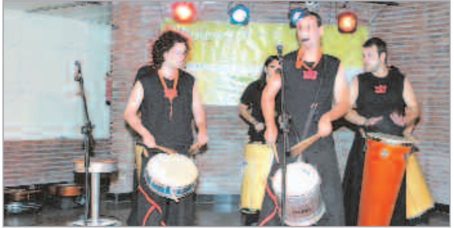
Además de talleres, en el casal se realizan conciertos, sesiones de videoforum, etc.

Además, en este nuevo trimestre los cursos relacionados con las nuevas tecnologías son gratuitos. La oferta incluye talleres de diseño de páginas web, del sistema operativo