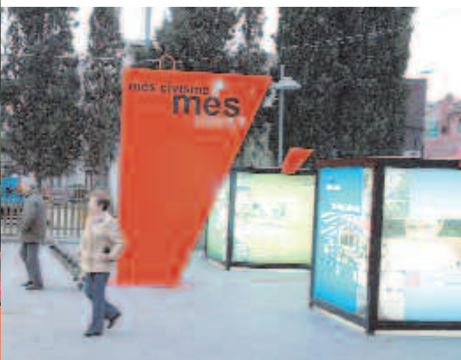
La exposición se pudo ver en varios puntos de la ciudad

El objetivo es concienciar en buenas prácticas cívicas para mejorar la ciudad