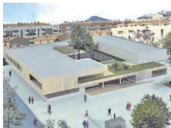
La construcción de la biblioteca ha suscitado mucho interés entre la ciudadanía. En la foto de arriba, imagen del proyecto

2.000 personas pasaron por la exposición ubicada en el solar donde se construirá la biblioteca