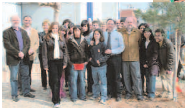
L'alcalde amb l'alumnat que va participar a la plantada de moreres