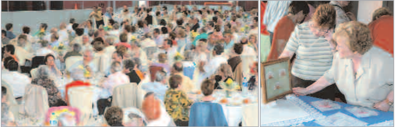
Dos de las citas clásicas de la Setmana de la Gent Gran: la comida popular (fotografía de la izquierda) y la exposición de manualidades (derecha)

Del 7 al 18 de mayo se celebra la Setmana de la Gent Gran