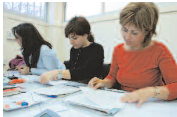
Els seminaris i tallers volen potenciar l'esperit emprenedor entre la ciutadania

Per inscriure't als seminaris i tallers de generació d'idees i creació d'empreses pots trucar al 93 480 80 50 o bé enviar un correu electrònic a l'adreça: autoocupacio@sjdespi.net .