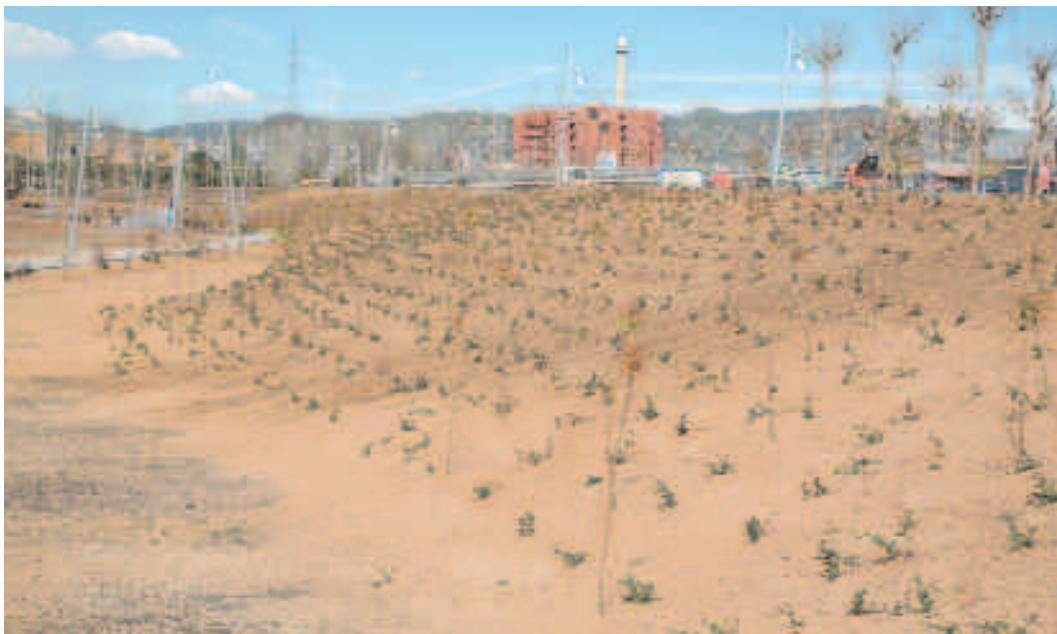
El parque de la Font Santa se agranda. En la zona de Pont Reixat ya se observan los elementos que configurarán esta nueva zona verde de 65.000 metros cuadrados

65.000 metros cuadrados más para disfrutar de la naturaleza en pleno entorno urbano