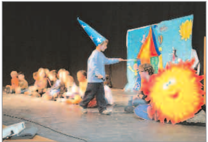
L'esplai El Nus porta dues dècades treballant per la formació en el lleure

A més de les activitats del dia 14, l'Esplai, que avui dia compta amb uns 350 monitors i nens i nenes, celebrarà el 29 d'abril una excursió de famílies que sens dubte, permetran fer un balanç i reviure molts dels moments pels quals ha passat l'entitat en aquestes dues dècades de vida. Per últim, l'entitat clourà els actes