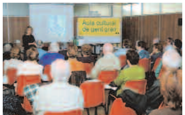
Las charlas en el Aula Cultural también serán protagonistas