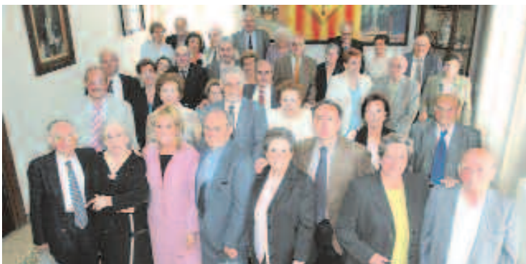
Foto de familia de las parejas que el año pasado celebraron sus bodas de oro

Las actividades se cerrarán el 18 de mayo con un comida y baile en el Polideportivo del Mig. Los tiquets para poder participar en algunas de las actividades estarán disponibles en todos los centros cívicos después de Semana Santa.