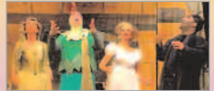
El somni de Papageno , companyia ATOT 15 d'abril, a les 19 h Auditori Miquel Martí i Pol

La venda anticipada d'entrades numerades es farà a l'Àrea de Serveis a la Persona (av. de Barcelona, 45, tel. 93 477 00 51) a partir del 10 d'abril. També es pot enviar un correu electrònic a: asp@sjdespi.net .