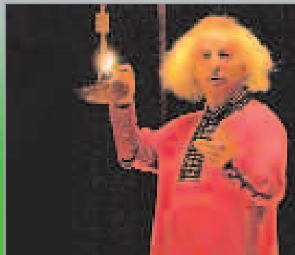
Los misterios del Quijote o el ingenioso caballero de la palabra , de Rafael Álvarez 'El Brujo' 1 de juny, a les 22 h Foment Cultural i Artístic