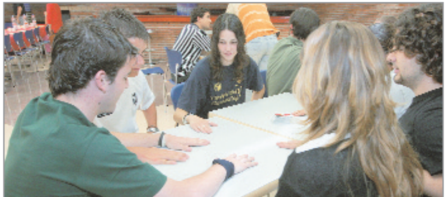
En la guía pueden consultar información sobre estudios, cultura, actividades, etc

Los jóvenes de Sant Joan Despí cuentan con una nueva herramienta que les ayudará a encontrar y consultar todo tipo de servicios y actividades de su interés. Se trata de la Guía de Recursos Juveniles, que desde principios de enero se puede descargar a través de la página web www.sjdespi.cat , clicando en el icono Pla Jove. El documento, de 62 páginas, recoge los servicios dirigidos exclusivamente a los jóvenes, como el casal de joves El Boulevard, el Jovespí o los locales de ensayo y los programas municipales, como el circuito de Art Jove, las aulas de estudio o el punto joven de salud, por poner algunos ejemplos. En ella pueden consultar información sobre estudios, trabajo, vivienda, cultura, cooperación, salud, servicios sociales, etc. Además, la guía también recoge direcciones de