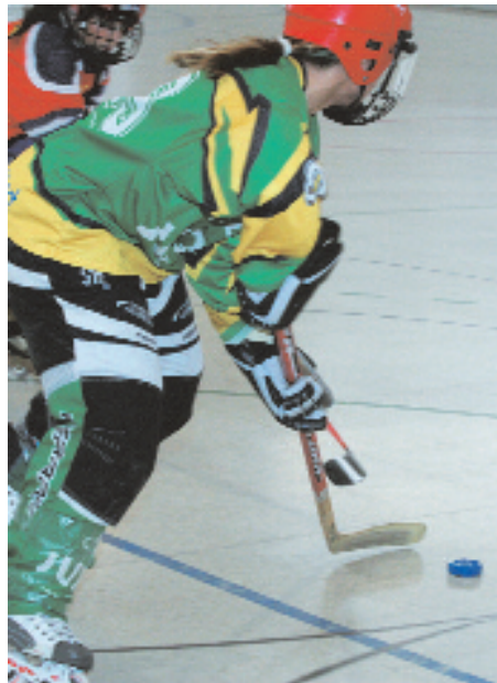
El club se encuentra en un gran momento

Tal y como esta ahora las clasificaciones, con toda seguridad el equipo de Sant Joan estará en las promociones de la Liga Catalana con los equipos júnior, juvenil y femenino, y tienen muchas posibilidades por sus resultados