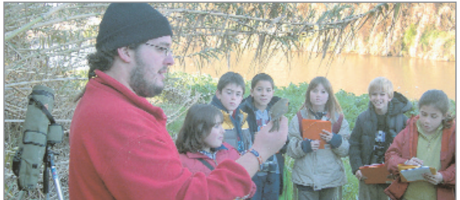
A dalt, un monitor ensenya als petits un ocell abans de la sessió d'anellament. Dreta, els nenes i nenes amb els seus binocles

Olorar una planta aromàtica, localitzar les empremtes d'un ratolí, descobrir el vol d'un xoriguer o identificar un mar-galló és ara més fàcil per a alguns escolars després d'haver realitzat diverses visites per descobrir el nostre entorn natural. Fa més d'un any, l'Ajuntament de Sant Joan Despí, amb la col·laboració del Centre Mediambiental L'Arrel va començar a publicar la col·lecció "Conèixer i estimar Sant Joan Despí", quatre guies que descobrien al ciutadà les plantes singulars de la ciutat, les remeieres, els ocells i els amfibis, rèptils i mamífers. A més de la publicació de la guia, el projecte donava l'oportunitat a les escoles de concertar visites guiades per posar en pràctica tot allò que expliquen les guies. Fins al moment, prop de 100 escolars han participat en les tres sortides. La darrera la va realitzar el CEIP Joan Perich Valls el 19 de gener al costat del riu per realitzar una