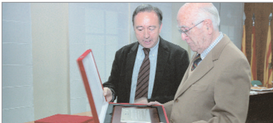
Bonsoms en el moment de rebre una placa de ma de l'alcalde en reconeixement els seus gairebé 30 anys com a jutge de Pau a Sant Joan Despí

-El balanç que faig és molt positiu, sobretot perquè tenia el convenciment que tot el que feia ho feia pel meu poble. Hi ha hagut de tot,