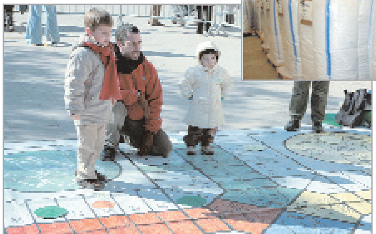
Creu Roja Joventut organizó actividades infantiles el día de la recogida. Imagen pequeña, algunos de los paquetes de macarrones donados por Gallina Blanca

La campaña de recogida de alimentos organizada por Camins Solidaris para los campos de refugiados del Sahara está a punto de terminar. Se han recogido 22 toneladas de macarrones donados por la Gallina Blanca; 500 kilos de harina, cedidos por el supermercado Lidel; 4.000 kilos de alimentos aportados por los ciudadanos y ciudadanas en los centros cívicos, en los colegios y otros puntos de la ciudad. Las asociaciones implicadas también han desarrollado acciones puntuales de recogida; Camins Solidaris y la Asociación de Vecinos de las Planes recogieron alimentos en las Planes el 3 de febrero, mientras que el 27 de enero lo hicieron junto a la Creu Roja Joventut en la plaza de la Ermita. Principalmente se ha recogido pasta, arroz, harina, legumbres, etc.