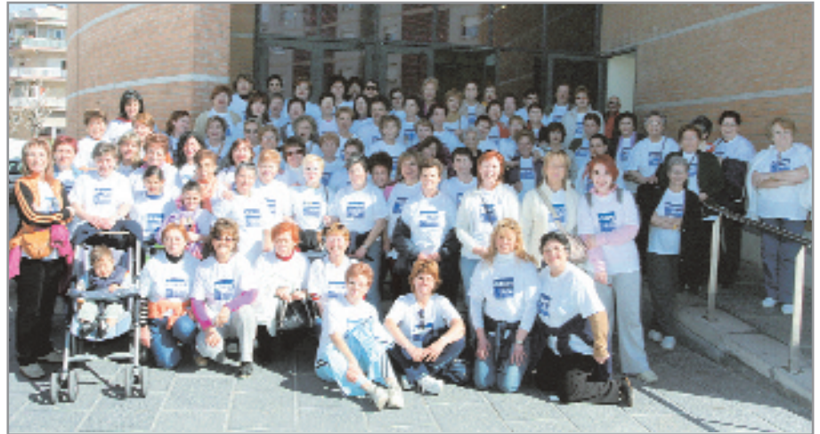
Imatge de les dones que van participar en la caminada de l'any passat

Així, Can Negre acollirà durant la primera quinzena de març l'exposició "Dones Despí i l'Art", una mostra oberta als treballs i creacions artístiques fetes per les dones de la ciutat en disciplines tan diferents com la pintura, la ceràmica, les manualitats o l'escultura per posar només alguns exemples. L'acte central se celebrarà el 8 de març a l'Auditori Miquel Martí i Pol, amb una mostra dels tallers de dones, la presentació del llibre que recull els textos dels Relats Breus per a Dones de la quarta i cinquena edició dels premis, a més de la lectura del manifest d'en-