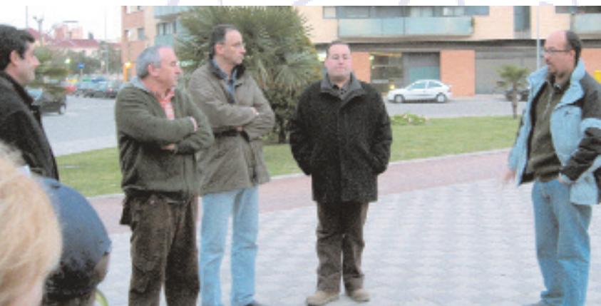
Membres de l'Agrupació i de la Colla a la rambla de Josep Maria Jujol

La comitiva va veure alguns dels espais on se celebraran les activitats