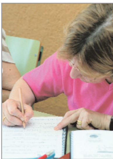
El fomenta de l'escriptura, un dels objectius del premi de Relats Breus

El 9 de gener es va tancar el període per participar en la segona convocatòria dels Premis de Relats Breus de Sant Joan Despí. Enguany, s'han presentat un total de 59 obres, de les quals 13 participen en la modalitat especial de Ciutat Gegantera. Recordem que coincidint amb la celebració de Sant Joan Despí Ciutat Gegantera 2007, es va decidir instaurar un premi que tingués el món geganter com a tema principal. Tal i com va passar a la primera edició, el segon classificat sortirà de les votacions populars que es facin a través de la web municipal ( www.sjdespi.cat ). D'entre els cinc relats més votats, el jurat triarà el segon. Els relats es podran votar durant tot el mes