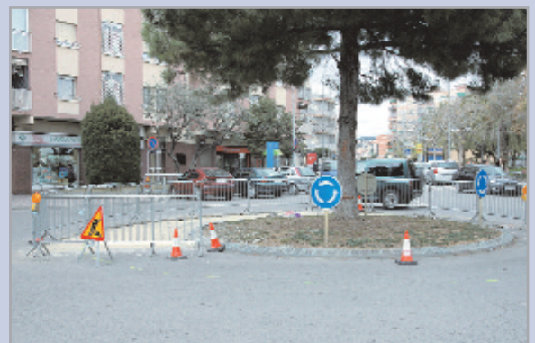
La rotonda se encuentra situada entre las calles John F. Kennedy, Josep Maria Pi i Sunyer y Àngel Guimerà

En breve finalizarán las obras de ampliación de la rotonda situada entre las calles Àngel Guimerà, John F. Kennedy y Josep Maria Pi i Sunyer, en el barrio de Les Planes. El objetivo de la intervención es aumentar el diámetro de la rotonda, que pasará de seis metros a once, para permitir una tráfico más fluido y evitar el estacionamiento en doble fila que algunos conductores utilizaban de manera reiterada, obstaculizando la circulación.