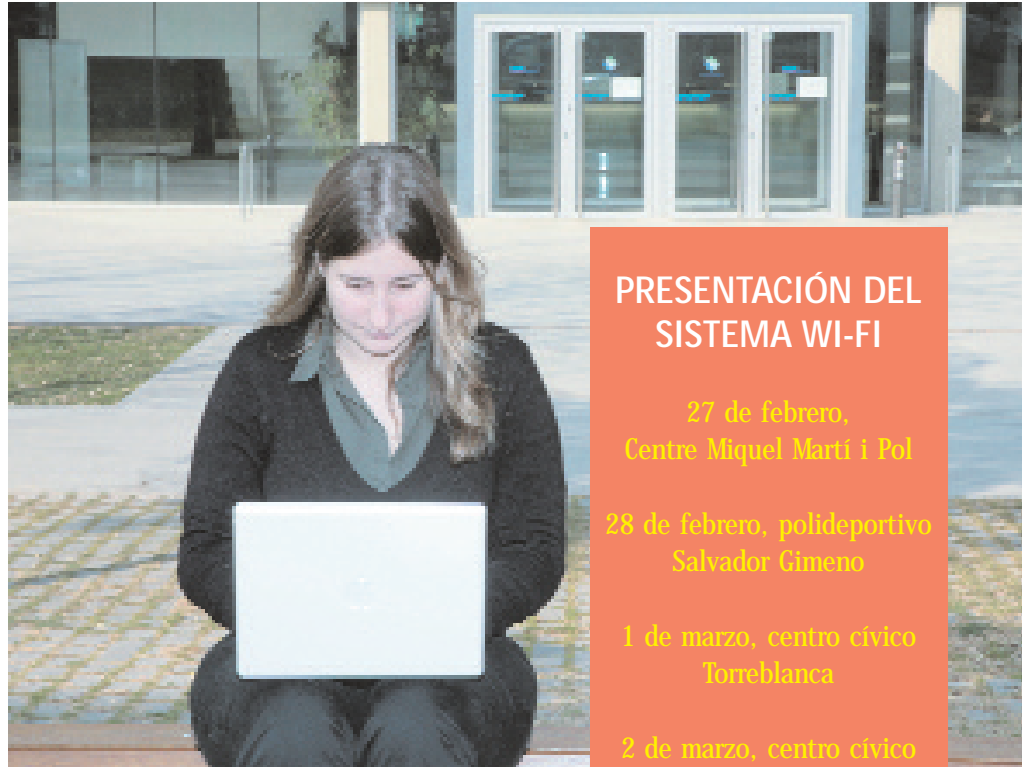
El sistema permitirá a los ciudadanos y ciudadanas conectarse libremente a Internet

Además, para que el sistema funcione correctamente se deben tener en cuenta otras indicaciones. Por ejemplo, el radio de actuación para realizar la conexión será de unos 50 metros aproximadamente y el portátil se ha de orientar hacia la entrada del equipamiento, que es dónde se situarán los puntos que permiten la