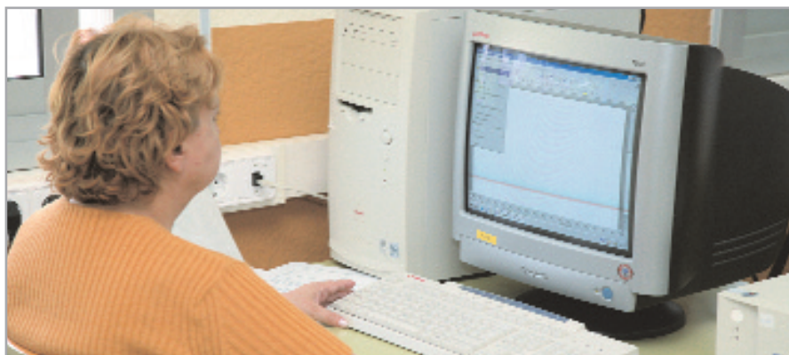
El aula abierta dispone de cuatro ordenadores de uso para la 'gent gran'

El espacio, ubicado en el centro cívico de les Planes, funciona los martes por la tarde