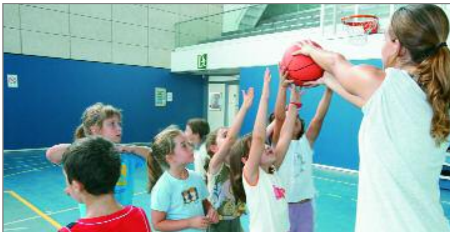
En una primera fase es tractaran d'unificar els criteris dels casals d'estiu

En una primera fase, que s'allargarà fins mitjan mes de desembre, les comissions, formades per membres de l'Ajuntament, de les AMPA, dels col·legis i dels esplais, tractaran d'unificar els criteris dels casals d'estiu que es portaran