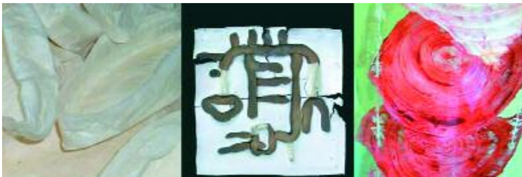
El paper vist des dels ulls de quatre artistes diferents

La mostra es podrà visitar fins al 10 de desembre