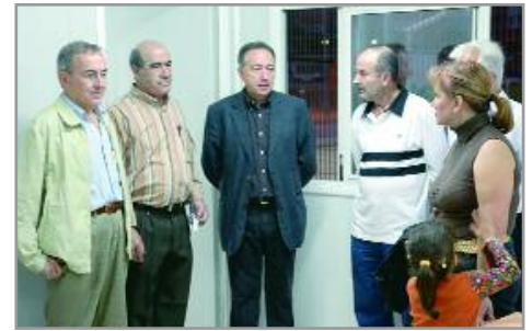
A l'esquerra, els socis i sòcies de la petanca en la inauguració de les instal·lacions. A dalt, l'alcalde celebra amb diversos membres de l'associació de veïns de l'Eixample l'obertura del nou local de l'entitat