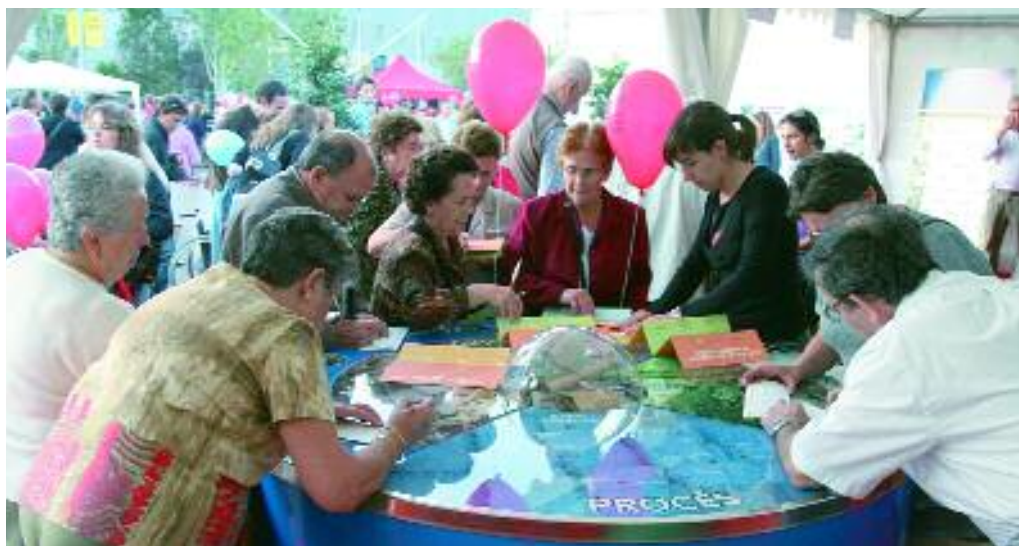
Muchos vecinos y vecinas no quisieron perder la oportunidad de firmar el pacto

El documento rubricado por estos 800 vecinos y vecinas tiene dos objetivos principales. Por un lado, proporcionar criterios y consejos que nos permitan adecuar nuestra vida diaria al desarrollo sostenible, y por otro, permitir a los ciudadanos dar un paso más en su compromiso con la sostenibilidad a través de la firma de este documento. A través de unos sencillos consejos el documento nos invita a ser más respetuosos con nuestra