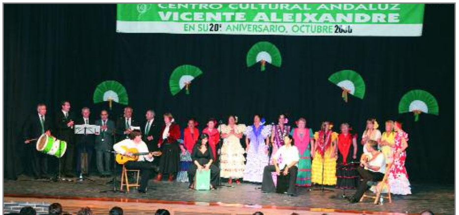
Dos de los momentos del festival de baile organizado por la entidad en el Auditorio Miquel Martí i Pol

Al día siguiente los socios y socias, además de simpatizantes se reunieron en el picnic del río para degustar una costillada. El Centro Cultural Andaluz Vicente Aleixandre siempre se ha caracterizado por su implicación en el tejido asociativo de la ciudad. El Belén Viviente en Navidad, el Día de Andalucía, el 28 de febrero o las Cruces de Mayo, son algunas de las actividades principales que organiza la entidad a lo largo del año.