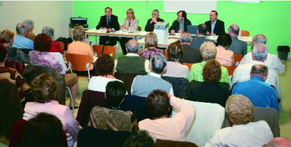
Unas 90 personas debatieron sobre los cambios de la educación

La “gent gran” coincide en resaltar que la educación es tarea de todos