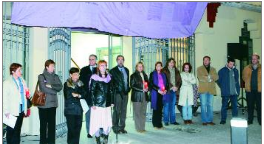
Imatge d'arxiu de la concentració de rebuig a la violència que va tenir lloc l'any passat

Des de l'Ajuntament, amb la col·laboració del Consell Municipal de Dones i les entitats adherides a la campanya, s'han fet diferents propostes: una caminada popular per tots els barris, un cinefòrum de la pel·lícula Caos , de Coline Serreau, xerrades sobre el paper de les dones en l'actualitat i sobre la llei contra la violència de gènere, l'acte de record a totes les dones assassinades en el darrer any, etc. A més, el 23 de novembre Can Negre acollirà una lectura de fragments