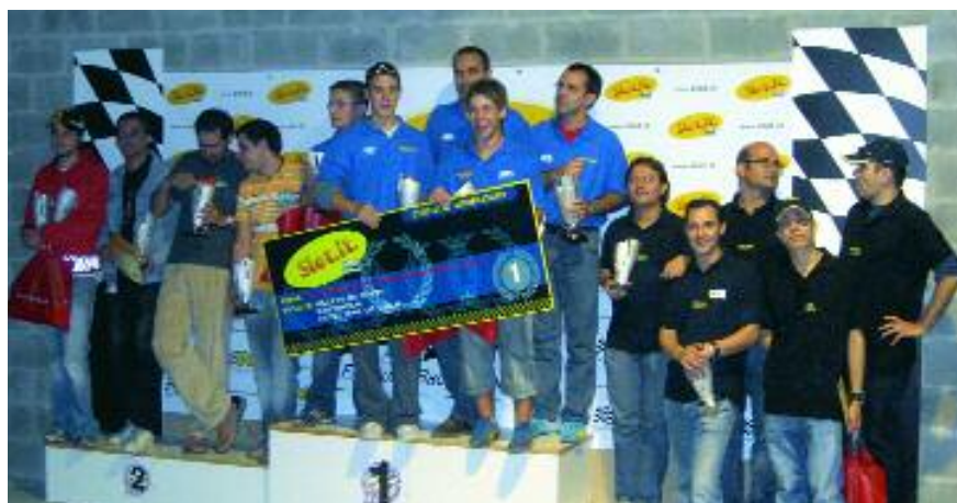
L'equip de l'Slot Car Sant Joan al més alt del pòdium

L'equip del club Slot Car-Mospmis de Sant Joan Despí es va proclamar campió d'Espanya de Resistència el passat 22 d'octubre.