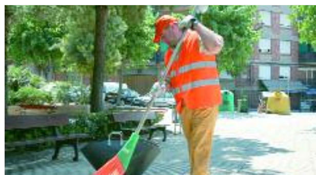
A l'esquerra, uns ciutadans observen el funcionament dels nous contenidors, exposats a la fira. El servei de neteja viària s'intensificarà amb la nova contracta

El procés de renovació s'ha iniciat aquest mes i finalitzarà a la primavera