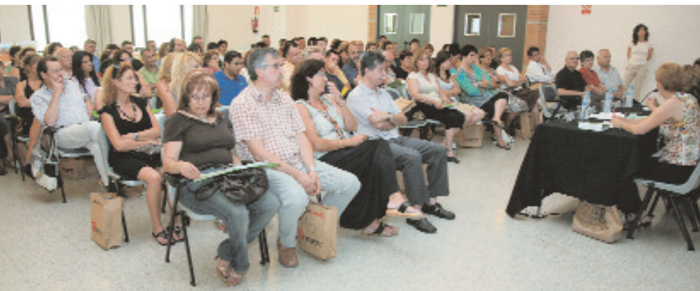
Uno de los momentos de la presentación del catálogo de servicios

La unión hace la fuerza y, en este sentido, los comerciantes de Sant Joan Despí, en colaboración con el Ayuntamiento, siguen trabajando en iniciativas que refuercen y potencien el tejido comercial de la ciudad. Otro paso más en este sentido es el nuevo catálogo de servicios para los asociados que ha presentado la Associació de Comerciants de Sant Joan Despí