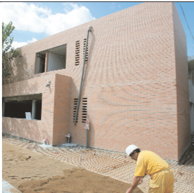
Las obras de la nueva escuela Sant Francesc d'Assís continúan a buen ritmo y el alumnado podrá iniciar las clases en el nuevo edificio el próximo curso

En todas las escuelas se realizarán mejoras en la instalación eléctrica.