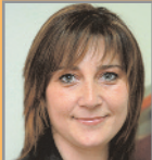
Dolors García Foment de l'Ocupació i Comerç