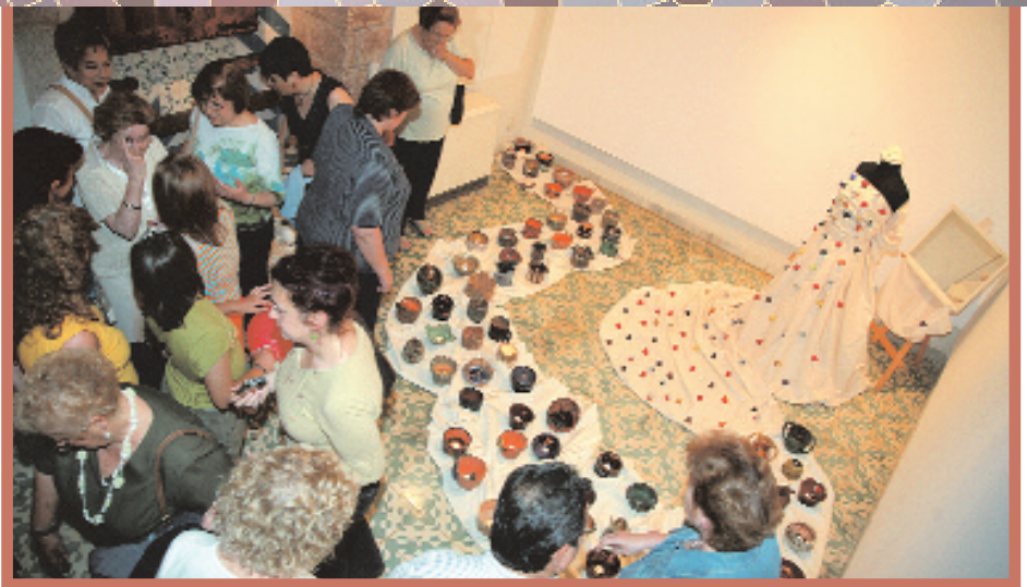
Foto de l'exposició de treballs de l'alumnat de l'Escola Municipal d'Art i que tenia les noves tecnologies com a fil conductor. Aquesta imatge havia d'il·lustrar la informació que sobre el tema s'oferia en l'anterior número del Butlletí i que, per una errada tècnica, es va substituir per una altra. Aquesta mostra es va poder veure fins a mitjan juny

Del 3 al 10 de setembre, al Centre Cívic Sant Pançaç