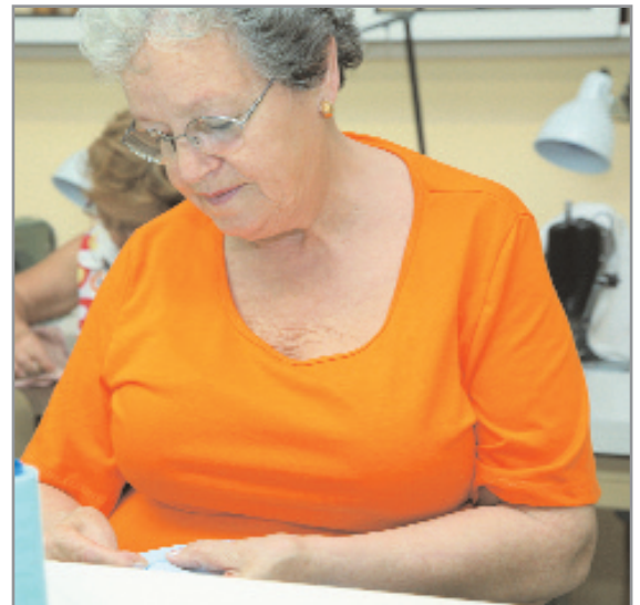
Los talleres ofrecen muchas posibilidades de formación

Más información sobre horarios e inscripciones, en el Área de Servicios a la Persona (teléfono 93 477 00 51).