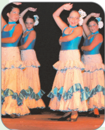
La plaça del Mercat va acollir una nit plena de color, ball i sentiment, divendres, 22 de juny