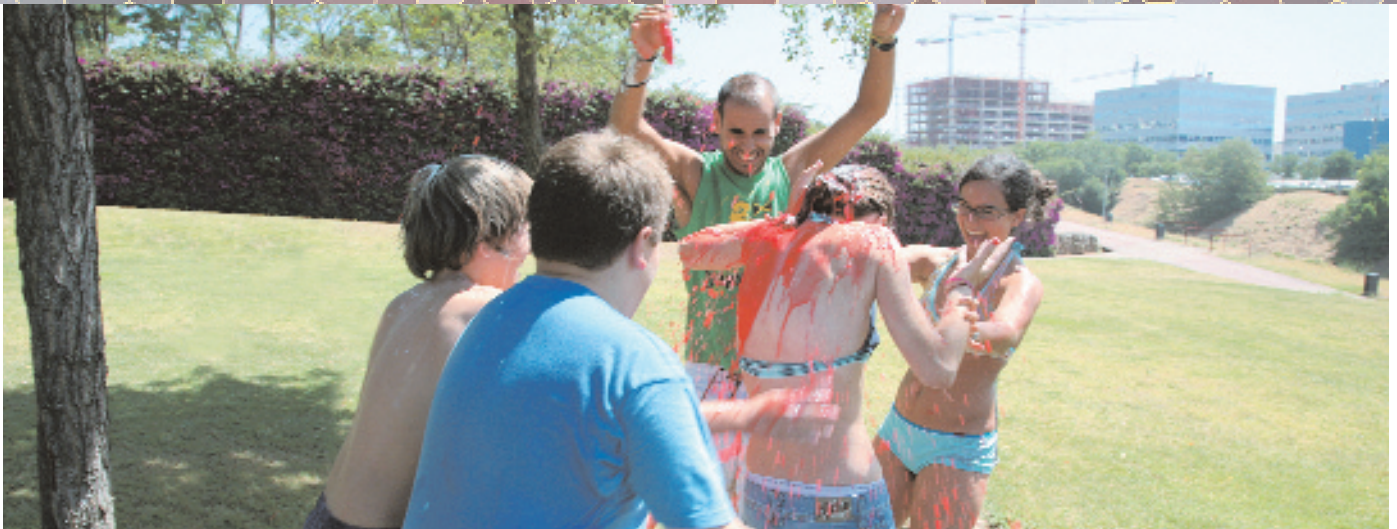
Els nois i noies del casal van participar en una gimcana molt refrescant al parc de la Fontanta