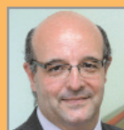
Ferran Liesa Esports