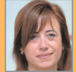
Gemma Guàrdia Educació i Família