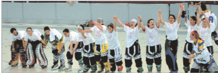
Se desató la alegría tras la consecución del campeonato estatal

Más emoción imposible y más alegría al final, también. El Club Hoquei Línia Jujol llegaba al último partido, en el Poliesportiu del Mig, como líder, sin haber perdido ni un solo partido. Se enfrentaba al Valladolid Panteras, segundo a tres puntos de las santjo-nenses, con las que había perdido su único partido, el de la ida. Los dos equipos eran los únicos que podían ganar la Liga de Primera Nacional ya que el tercero, el Sant Andreu, se encontraba a 9 puntos del segundo y ya había concluido sus partidos. Al Valladolid solo le servía ganar y hacerlo por más de tres goles de diferencia (en la ida el resultado fue de 3-5 para el Jujol). Las pucelanas se pusieron con un inquietante marcador a su favor de 1-3, pero las de Sant