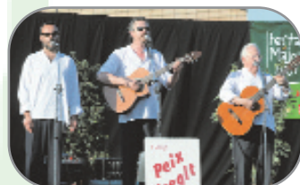
La música ha estat un element destacat de la Festa Major. A les imatges, un moment de l'actuació de l'Orquestra Montgrins, el concert de La Troba Kung Fu, l'actuació del Circ Cabaret i, en l'àmbit més tradicional, les havaneres, sarsuela i sardanes