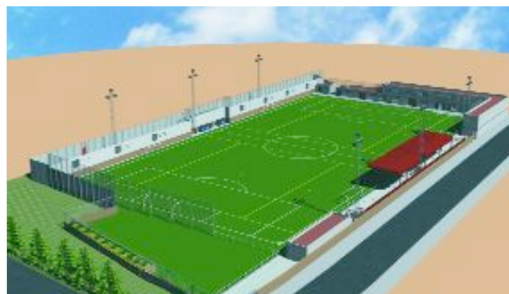
Imagen virtual de los campos de fútbol con el césped