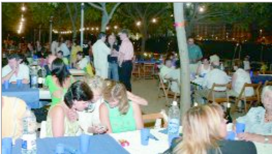
Un momento de la cena solidaria organizada por la Colla Elmo en el parque Fonsanta

La Colla Elmo recauda cerca de 2.000 euros que destina a la reconstrucción de una guardería de Tindouf