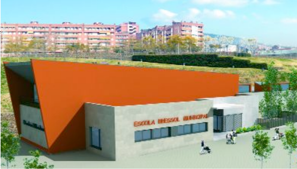
Imagen virtual de la nueva 'escola bressol' municipal que ha comenzado a construirse junto al parque Fontsanta