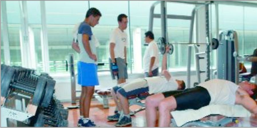
A partir del proper dia 17 de juliol es poden començar a fer les renovacions dels abonaments

Noves inscripcions: a partir del 14 de setembre