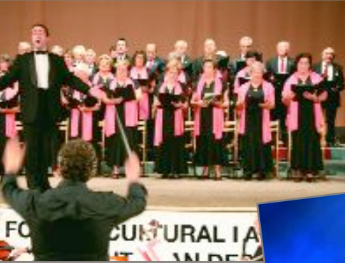
tes revetlles celebrades a la cert de sarsuela de Festa Major