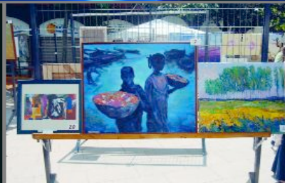
Imatges dels espectaculars focs artificials, de la mostra de pintors al carrer i de l'actuació plena de swing de Carajillo's Happy Band