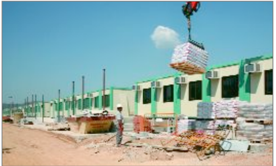
Els alumnes començaran el proper curs als mòduls construïts al carrer de la Creu d'en Muntaner

Així doncs, s'han instal·lat deu mòduls prefabricats que reuneixen totes les condicions d'il·luminació i ventilació reglamentàries per poder realitzar les classes de la manera més adequada. Els mòduls, que disposen d'aire condicionat i calefacció, acolliran nou aules, a més d'una sala de psicomotricitat, lavabos, i un espai