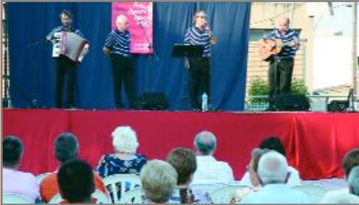
La festa va portar a la ciutat espectacles de tota mena, com les havaneres de la plaça del Mercat (a dalt) i els espectacles infantils que es van fer a tots els barris de Sant Joan Despí (imatges de la dreta)

Ciudadans i ciutadanes de totes les edats van fer possible una Festa Major molt participativa