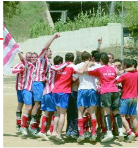
La UE Sant Joan Despí logró el regreso a Primera Territorial