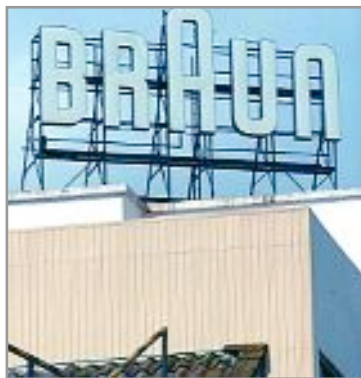
El ple de l'Ajuntament va aprovar una moció de suport als treballadors per unanimitat

El Ple municipal de l'Ajuntament de Sant Joan Despí va aprovar el 25 de maig una resolució contra el tancament de l'empresa Braun, situada a Esplugues de Llobregat, molt a prop del límit amb el terme municipal de Sant Joan Despí. La fàbrica d'electrodomèstics ha anunciat la seva voluntat de tancar en dos anys la seva factoria d'Esplugues, on treballen 761 treballadors i treballadores, una cinquantena dels quals són veïns i veïnes de Sant Joan Despí. Amb aquest acord, l'Ajuntament demana