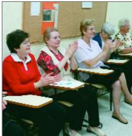
Cada taller té un preu de 21 euros

Cada taller té un preu únic de 21 euros que s'abonaran en el moment de formalitzar la matrícula. Les dones que vulguin participar podran rebre infor-