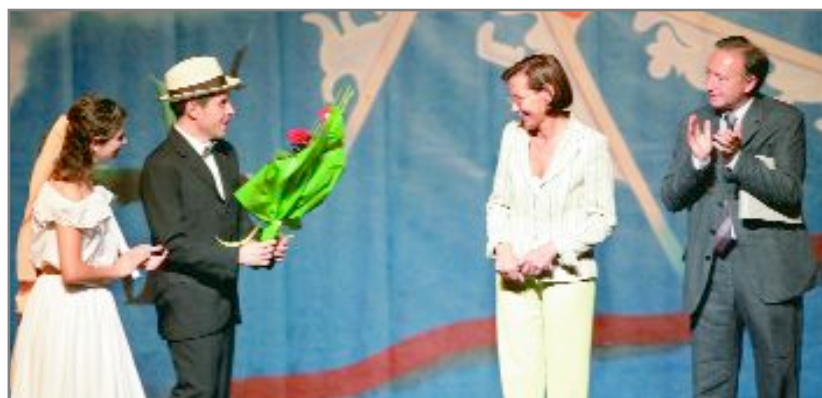
Tura va animar l'Esbart a seguir difonent el folklore català

cos de dansa i els grups infantils. El festival, que va comptar amb la presència de l'alcalde, Antoni Poveda i la consellera d'Interior de la Generalitat, Montserrat Tura –que va complir un compromís personal de venir a veure l'esbart santjoanenc–, entre d'altres representants institucionals, va estrenar un nou ball, una jota aragonesa. Durant el festival el cos de dansa, els grups juvenils i infantils van ballar més de 15 balls.