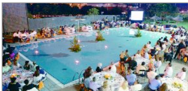
A la izquierda, foto de la cena de los técnicos y directivos de las escuelas . A la derecha, uno de los momentos de la jornada de actividades realizada en el Parc del Mil·lenari y Poliesportiu Salvador Gimeno