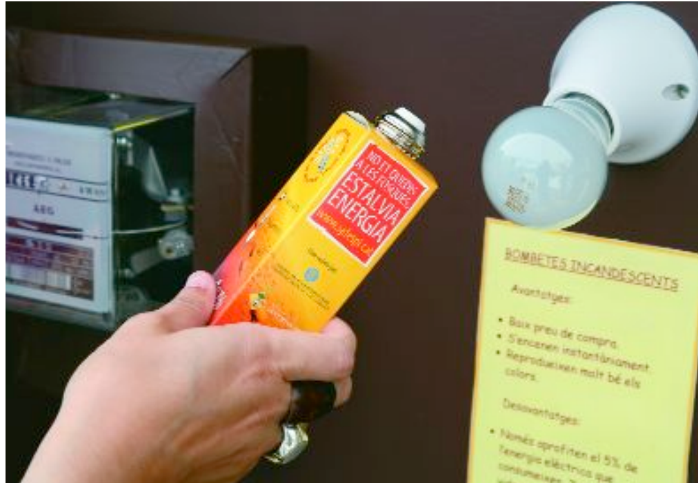
Els ciutadans i ciutadanes van rebre consells sobre l'estalvi energètic a casa

Una d'aquestes accions ha estat el lliurament als ciutadans i ciutadanes de més de 1.000 bombetes de baix consum. A més de rebre les bombetes, les persones que es van acostar fins als llocs on es feien els intercanvis van rebre consells sobre