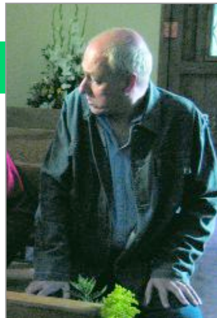
El 'Paco' de Ventdelplà serà el pregoner