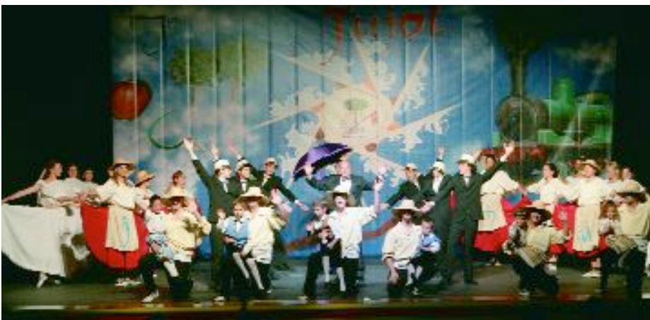
Un moment de l'actuació de l'Esbart Dansaire de Sant Joan Despí