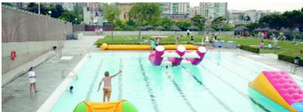
Una festa va donar el tret de sortida a les piscines d'estiu de la Font Santa

L'entrada puntual a la piscina costarà 3,90 euros de dilluns a divendres i 4,75 en la resta de dies. També hi ha un ampli ventall d'abonaments. Per exemple, una targeta de 10 banys costa 32 euros, però també hi ha abonaments de temporada (els individuals tenen un preu de 67,50 euros) o de mitja temporada. Per a més informació sobre els preus i les condicions, es pot trucar al 93 477 20 77. Les persones que s'apropin a les piscines trobaran una piscina gran, una infantil, solàrium, zona de pícnic, bar-cafeteria i fins i tot taula de ping-pong.