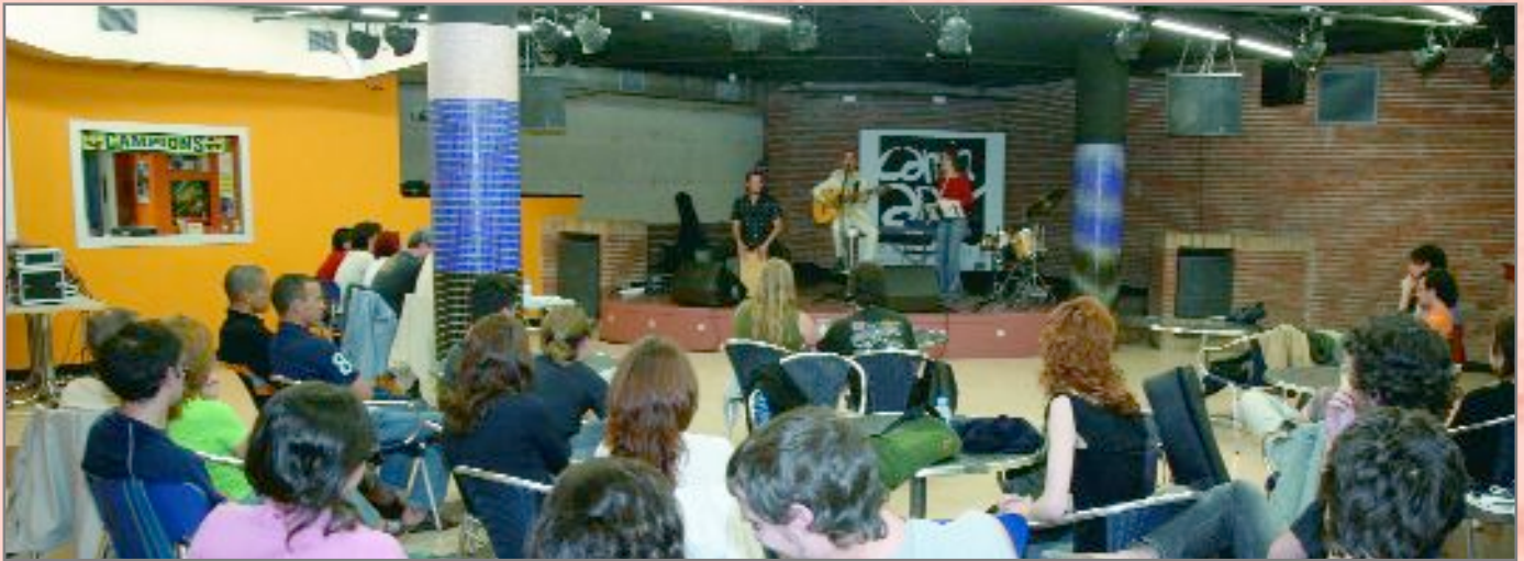
El grup Discípulos de Otilia van portar fins al Bulevard els sons de l'ska

La Setmana Jove, aquest any batejada com SenseXankles, ha estat tot un èxit de participació. Durant més de dues setmanes, els joves de la ciutat van poder gaudir i participar d'activitats tan diverses com concerts, teatre, xerrades i fins i tot conèixer de prop els diferents projectes solidaris i de cooperació, així com a l'entorn natural de la ciutat. Sens dubte, una de les activitats que