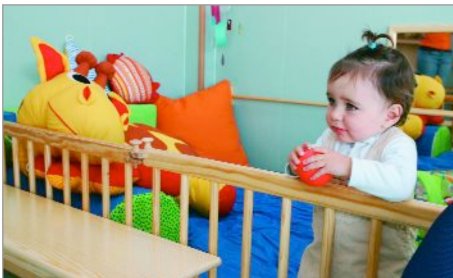
Més de 3.000 persones han realitzat diverses consultes durant el període de preinscripció

L'Ajuntament de Sant Joan Despí, seguint la línia d'apostar per les noves tecnologies per facilitar les gestions i els tràmits municipals a la ciutadania, ha incorporat aquest any la possibilitat de realitzar les preinscripcions a les escoles bressol municipals a través de la pàgina web sense la necessitat de personar-se en les dependències municipals ni presentar inicialment cap documentació. La resposta no ha pogut ser millor: el 85% de les persones que ha realitzat aquest tràmit ho ha fet a través de la xarxa. Durant els dies que ha durat la preinscripció (entre el 30 d'abril i el 2 de juny) més de 3.000 persones han visitat l'espai de la pàgina web destinat a ubicar tota la informació ( banner ). Les famílies no només han pogut fer el tràmit de la preinscripció, sinó que a través d'una clau personal també han seguit de prop els diferents tràmits del procés, com ara