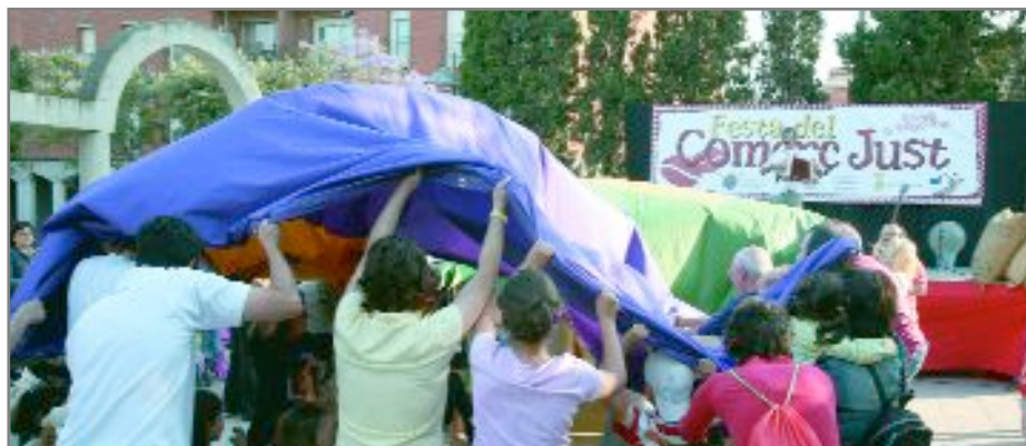
En acabar, els infants van enlairar globus que portaven a dins els seus desitjos

Centenars de persones es van acostar fins a la plaça de l'Ermida el 3 de juny per participar en la Festa del Comerç Just. L'activitat va néixer amb l'objectiu de donar a conèixer entre la població aquests tipus de productes que ajuden a fomentar una vida més digna entre les persones dels països d'origen d'aquests articles. Una de les activitats que va aplegar més gent va ser l'espectacle d'animació "Amb el cafè...deixa't d'històries!", un muntatge interactiu musical i educatiu que explicava als més petits la realitat