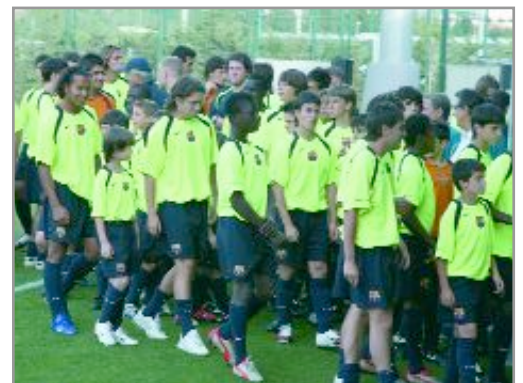
A dalt, el president blaugrana i l'alcalde santjoanenc brinden pel futur dels joves jugadors del Barça que, a baix, entrenen en un dels camps de la ciutat esportiva Joan Gamper