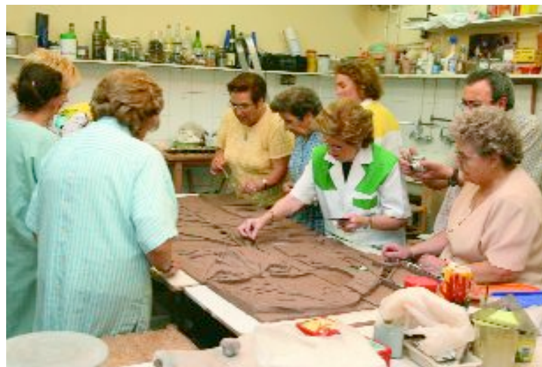
Els del taller de ceràmica preparant un mosaic sobre l'artista malageny

L'exposició es podrà veure fins al 16 de juliol.