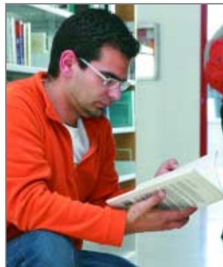
Al certamen pot participar qualsevol persona major de 18 anys

El jurat estarà presidit pel tinent d'alcalde de Cultura i Participació