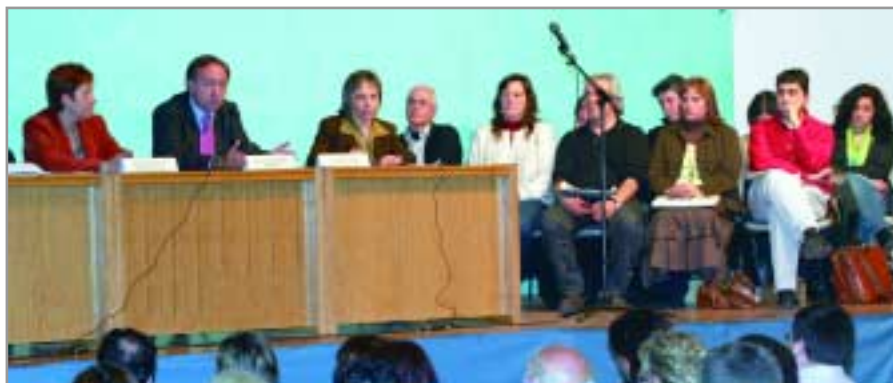
Presentació del projecte als membres del Club Ciclista Sant Joan Despí

Prop d'un centenar de botigues ja s'hi han adherit