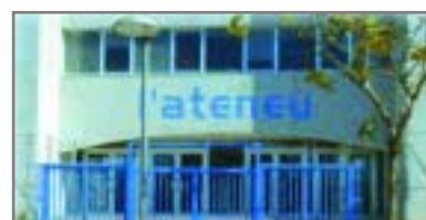
Els instituts de secundària Ferrer i Guàrdia, Salvador Pedrol i l'Ateneu