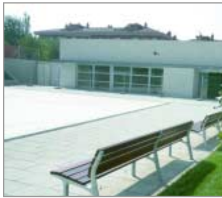
Centre cívic Torreblanca. Rubió i Tudurí, 5 93 477 22 68 • cctorreblanca@sjdespi.net

Curs de cuina de primavera: del 19 d'abril al 5 de juliol.