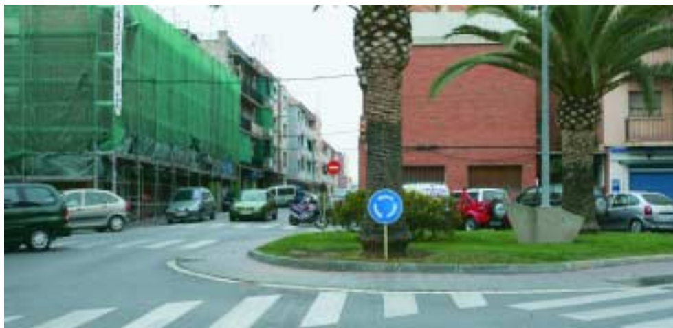
Continúa el Plan de Mejora Urbana: la calle de Extremadura y la plaza de Espanya serán los próximos puntos de actuación en el barrio de Les Planes

bles, aprovechando el período de vacaciones, para evitar perjuicios tanto a los comerciantes como a las y los consumidores.