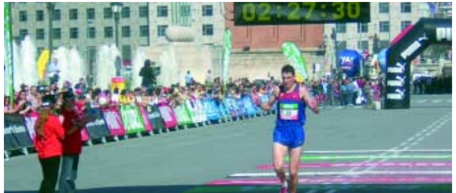
Cepeda corre en la sección de atletismo del FC Barcelona desde hace tres años

-Tenía 12 años, el colegio organizó una carrera, me gustó y empecé a cor-