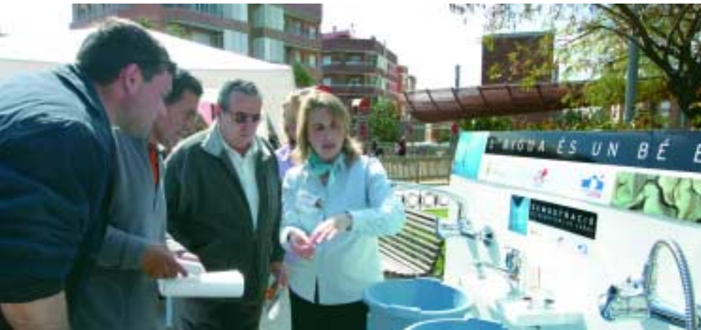
Amb els reductors de cabal que s'instal·len a les aixetes dels domicilis es pot estalviar fins a un 50% de l'aigua que gastem

L'Ajuntament va repartir més de 1.100 reductors de cabal d'aigua entre la ciutadania