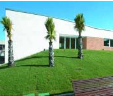
Centre cívic Gaudí. Pl. de l'Estatut, 5 93 477 31 34 • ccgaudi@sjdespi.net

L'Antoni Gaudí i el Torreblanca posen en funcionament un nou cicle de propostes formatives amb cursos, tallers i altres activitats lúdiques