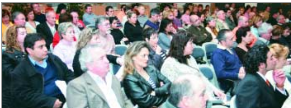
El centre cívic de les Planes es va omplir per la presentació de la nova associació

Farem campanyes de fidelització i de promoció, premiant la compra a les nostres botigues. Però pensant també en la ciutat, en el ciutadà, que la gent surti més al carrer a passejar i a comprar. I que trobi a Sant Joan Despí tot allò que necessita.