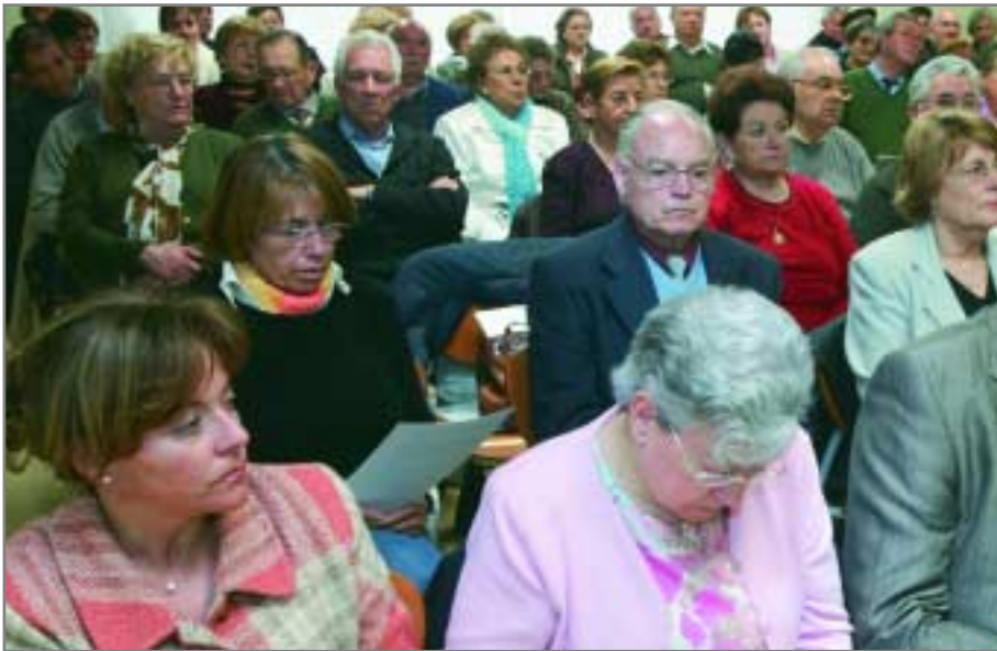
Imagen de la sesión de clausura de la jornada del año pasado, dedicada a la participación activa de las personas mayores en todos los ámbitos de la sociedad

La actividad se organizará en el centro cívico de Torreblanca el próximo 25 de abril desde las 9.30 a las 17 horas