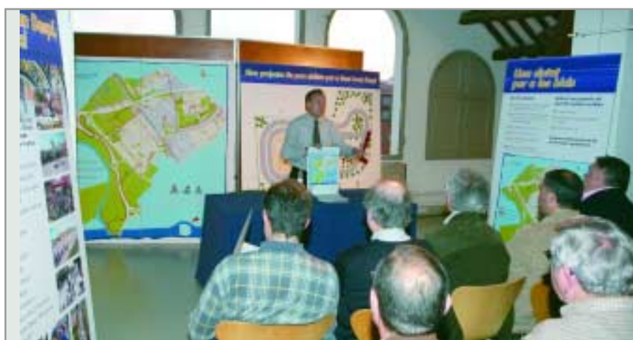
Presentació del projecte als membres del Club Ciclista Sant Joan Despí

-En bici, a tot arreu: l'objectiu és aconseguir potenciar la utilització de la bicicleta als desplaçaments urbans; per això es facilitarà que es pugui anar en bici a tots els centres cívics, instituts i poliesportius, col·locant aparcaments de bicicletes allà on no