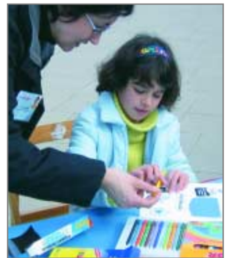
Una nena participant a un dels tallers per conscienciar sobre el bon ús de l'aigua

Centre. Amb representacions de contes d'aigua amb jocs i màgia, els infants van rebre consells bàsics per gastar menys aigua i poder apreciar aquest bé. A més, també es va fer una exposició, es va projectar el documental Niños de agua i es va fer una xerrada col·loqui on es van repartir tríptics amb consells per a un bon ús de l'aigua.