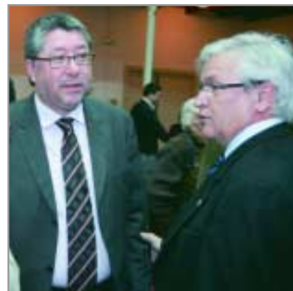
Antoni Balmón i Joan Clos, alcaldes de Cornellà i Barcelona, respectivament