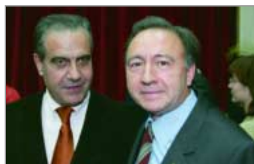
El president de la Diputació de Barcelona i alcalde de l'Hospitalet, Celestino Corbacho, felicitant al nou alcalde