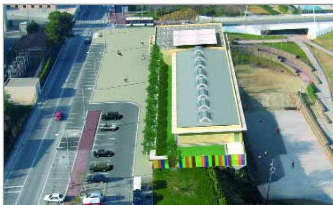
La nueva guardería municipal tendrá un patio para cada aula, además de otro común

puesta en funcionamiento, en 2007, Sant Joan Despí tendrá cerca de 500 plazas públicas de guardería, sienta “el municipio del Baix Llobregat que tiene más plazas de escoles bressol ” , aseguró el alcalde, Antoni Poveda. La oferta pública de guarderías en la ciudad pasa en la actualidad por las 367 que ofrecen El Timbal, el Sol Solet, la Pomera y las aulas del Gegant del Pi (ver cuadro adjunto). La alternativa privada, con tres centros en funcionamiento, suma 127 plazas. Según el actual censo municipal, en Sant Joan Despí residen unos 1.300 niños y niñas de 0 a 3 años.