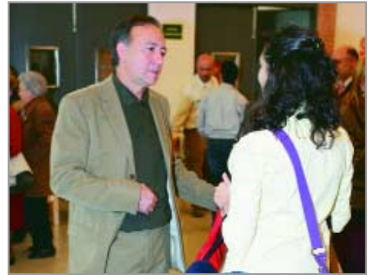
L'alcalde, en dos dels seus primers actes: la presentació de l'escola bressol i la el 25è aniversari de la Unió Petanca Sant Joan Despí

Sí. Crec sincerament que la clau per assolir els objectius marcats passa per connectar amb la realitat i, per tant, amb els seus actors, els ciutadans i ciutadanes. Treballaré per tenir un govern local més participatiu i comunicatiu, fent més pròxima i àgil l'Administració local. Jo mateix, com a alcalde, intentaré estar el màxim possible al carrer,