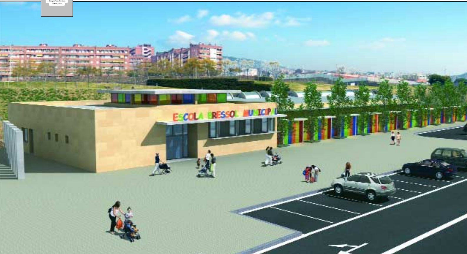
Imagen virtual de la nueva guardería municipal, que comenzará a construirse antes del verano