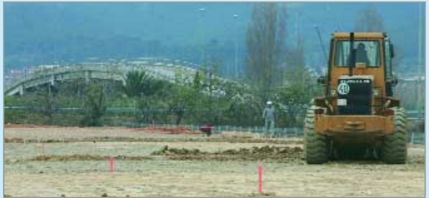
Ja s'està treballant en l'adequació del terreny per instal·lar les aules provisionals de l'escola Sant Francesc d'Assís mentre durin les obres

Pel que fa a l'etapa de secundària no obligatòria (batxillerat i cicles formatius de grau mitjà i superior), la preinscripció es farà del 15 al 26 de maig i el període de matriculació s'ha establert entre els dies 3 i 7 de juliol.