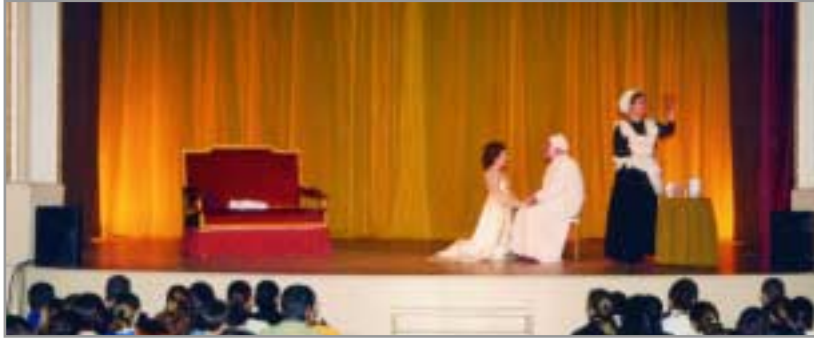
Hocus Pocus és el grup de teatre amateur de Sant Joan Despí

El grup de teatre de Sant Joan Despí representa, els dies 16 i 17 de desembre 'No hay ladrón que por bien no venga'