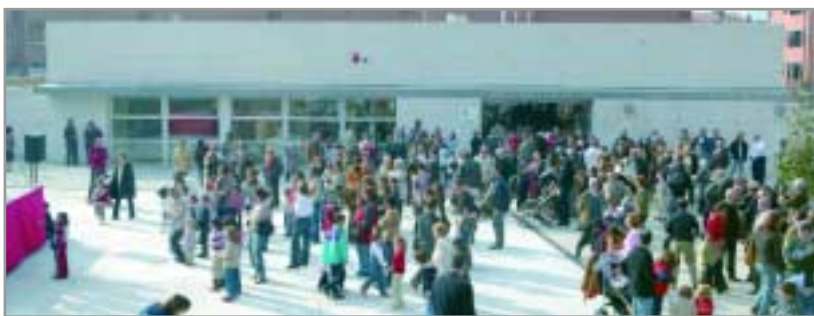
El centre cívic s'ha convertit ja en un punt de referència i trobada al barri de Pla del Vent-Torreblanca

Exposició i jam session a l'equipament obert ara fa un any