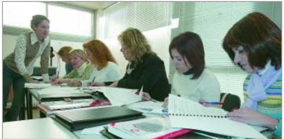
El Departament de Promoció Econòmica, Ocupació i Comerç treballa per la igualtat laboral

Els joves que cerquen la primera feina; les dones que necessiten reci-