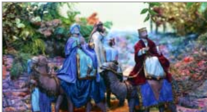
L'Exposició de Pessebres torna a l'ermita del Bon Viatge