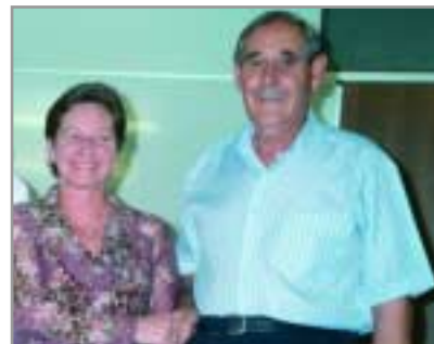
El 8 d'octubre, l'associació d'amics del ball Chatango va organitzar un ball en benefici dels afectats per l'Alzheimer. S'hi van recaptar 687 euros que s'han lliurat a l'Associació de Familiars d'Alzheimer. A la foto, representants de les dues entitats

actuacions en directe (Foment, Cor La Flora, banda de les Planes, Semillero Azul, Coral d'avis, Hocus Pocus, Ràdio Despí, Taller de Country Espai Físic, CCA Vicente Aleixandre i Esbart Dansaire) i diferents estands d'entitats (esplais El Nus i El Castanyot, El Timbal, ASALRE, Grup Sardanista, Cinc Continents, Grup de Pintors, Club d'Escacs, Associació de Tir amb Arc, associacions de veïns, Colla