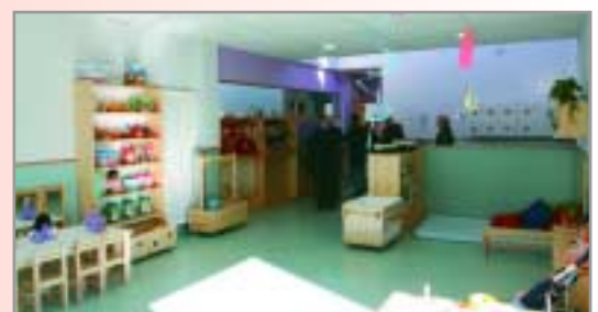
I un munt de detalls més