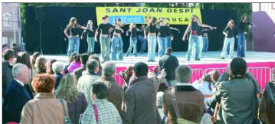
Durant tot un dia Sant Joan Despí va recaptar ajut per col·laborar amb La Marató

La plaça de l'Ermita va ser l'escenari d'una jornada de recaptació d'ajut per a la propera marató que organitza Televisió de Catalunya