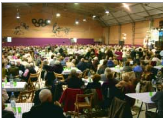
Diferents escenaris de la ciutat ens conviden a ballar per rebre l'any nou

Del 27 de desembre al 5 de gener, el Bulevard, casal de joves de Sant Joan Despí, organitza tallers nadalencs: còmic manga; reciclatge artístic; gravació d'un curtmetratge i bufandes i gorres de punt. Informa't al 93 373 91 07.