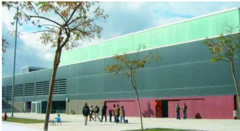
Vista exterior del poliesportiu municipal Salvador Gimeno

D'entre les conclusions que s'extreuen d'aquest informe, que s'ha centrat en dades corresponents a l'any 2004, destaca la bona resposta de la ciutadania vers les instal·lacions que tenim a Sant Joan Despí: un total de 44 persones per cada 100 habitants practiquen esport en algun dels equipaments existents al municipi una la mitjana es troba entorn el 20%. Això converteix la nostra ciutat en la població que té, per percentatge, més esportistes practicants a les instal·lacions esportives municipals. L'horari i l'àmplia oferta de places poden ser factors que afavoreixen aquesta situació i que també destaquen a l'estudi de la Diputació. Sant Joan Despí oferta 53 places per cada 100 habitants (quan la mitjana és de 34) i és la segona població amb més hores d'obertura de les seves instal·lacions, amb una mitjana de 80 hores a la setmana.