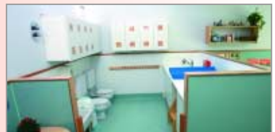
Lavabos a les aules