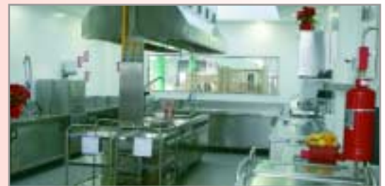
Cuina totalment equipada