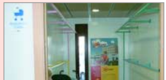
Aparcament per a cotxets