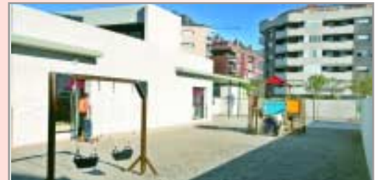
Sortida al pati des de les aules