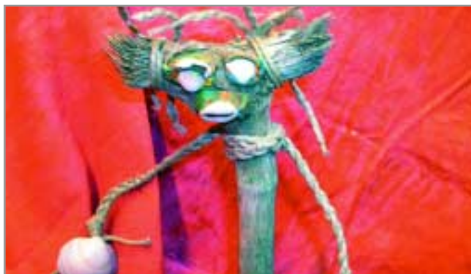
El món màgic dels titelles , al Centre Jujol-Can Negre

Una bona alternativa per aquests dies de festa és visitar les exposicions que s'organitzen a la ciutat, pensades per a tota la família. És el cas de la mostra El món màgic dels titelles , una exposició plena de fantasia que, amb la col·laboració de la companyia Penjim-Penjam, ens descobreix el fabulós món d'aquest teatre, de vegades molt desconegut (fins el 12 de gener, a Can Negre). Una altra proposta, coneguda ja de tothom, és l'Exposició de Pessebres que cada any des de fa quasi mig segle organitza l'Associació de Pessebristes de Sant Joan Despí a l'ermita del Bon Viatge (fins el 8 de gener). D'altra banda, els pintors locals del Grup Art 94 celebren el Nadal amb una exposició al carrer (plaça de l'Ermita) el 18 de desembre. També tenim la mostra de la triennial d'arquitectura del Col·legi d'Arquitectes a les golfes de Can Negre i una exposició de pintures de Berndt Diefenbach al centre cívic de Torreblanca.