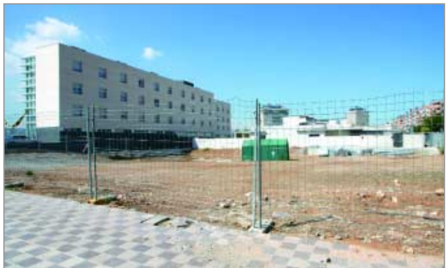
L'edifici d'habitatges per a joves s'edificarà a la zona del nou eixample del barri Centre, al costat de l'escola bressol Sol Solet, la residència de gent gran i un nou parc ja en construcció

Aquesta promoció d'habitatges de lloguer complementa l'oferta de pisos protegits que desenvolupa l'Ajuntament en aquests moments, amb 55