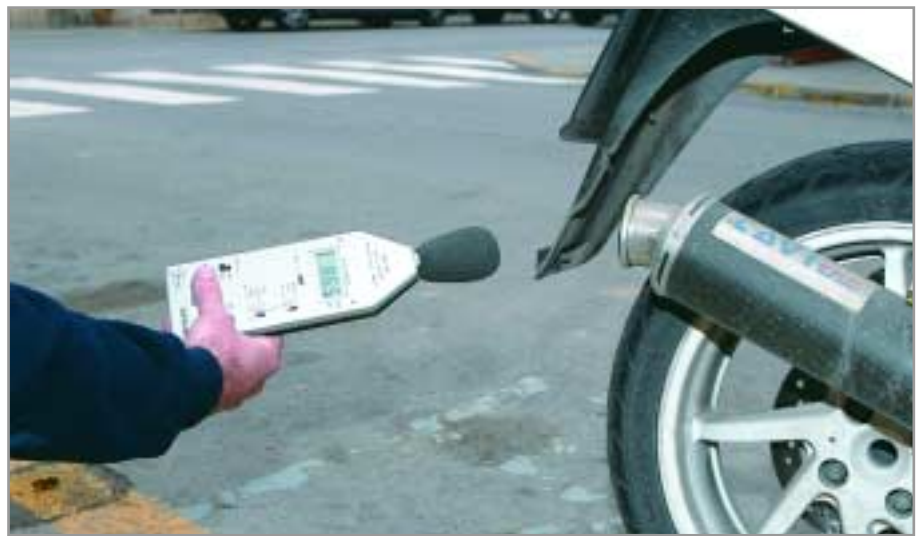
La Policia Local realitza periòdicament controls sonomètrics als vehicles

L'Ajuntament, des de fa temps ha pres mesures de pacificació del trànsit com, per exemple, la col·locació de passos de vianants elevats en les vies amb més problemes d'excés de velocitat. També es realitzen periòdicament controls sonomètrics, especialment a motocicletes i ciclomotors. Però, evidentment no es pot estar controlant tots els vehicles a totes hores. Aquesta no és la solució, tot i que, des del cos local de policia s'anuncien nous controls d'aquest tipus. També es treballa en canvis en la normativa actual, com ara la pròxima obligatorietat que els ciclomotors passin la ITV (Inspecció Tècnica de Vehicles). Però, per sobre de tot, el més necessari és que tots controlem el soroll del nostre vehicle i conduïm de manera assenyada i civilitzada.