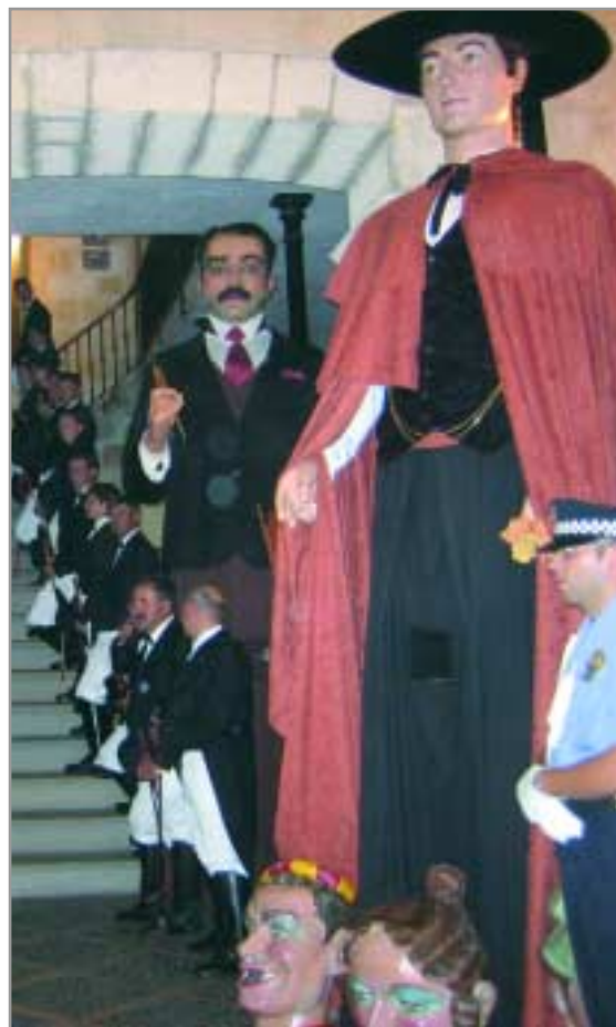
Jujol, amb un dels gegants d'Alaior, presidint l'entrada a aquest l'Ajuntament menorquí

dat un cop més palès aquest estiu. Jujol i Creació, els gegants de Sant Joan Despí han viatjat a Menorca per participar en les festes d'Alaior, a Menorca. Convidats per la Colla de Geganters d'aquesta localitat, la colla de la ciutat va viure uns dies –del 12 al 15 d'agost– molt intensos participant en tres cercaviles, entre elles, el popular jaleo (festa on els genets fan caminar els cavalls a dues potes). Van ser rebuts pel Consistori d'Alaior i els nostres gegants van presidir, conjuntament amb els de la població menorquina, l'entrada a la casa Consistorial.