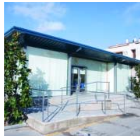
Hacienda habilitará una oficina informativa en el Departamento de Vía Pública

A partir del próximo 20 de septiembre, el Ministerio de Hacienda comenzará a enviar a los propietarios las notificaciones relativas a la revisión catastral que va a realizar en Sant Joan Despí. Esta actualización de los valores catastrales no supondrá grandes aumentos en el IBI (Impuesto de Bienes Inmuebles) ya que desde el Ayuntamiento se ha propuesto un coeficiente de incremento máximo del 4% en el uso residencial de primera vivienda. Para atender las consultas de la ciudadanía, la Dirección General del Catastro tiene previsto abrir, el 3 de octubre, una oficina informativa que se instalará en el Departamento de Vía Pública del Ayuntamiento (calle Major esquina con Frederic Casas).