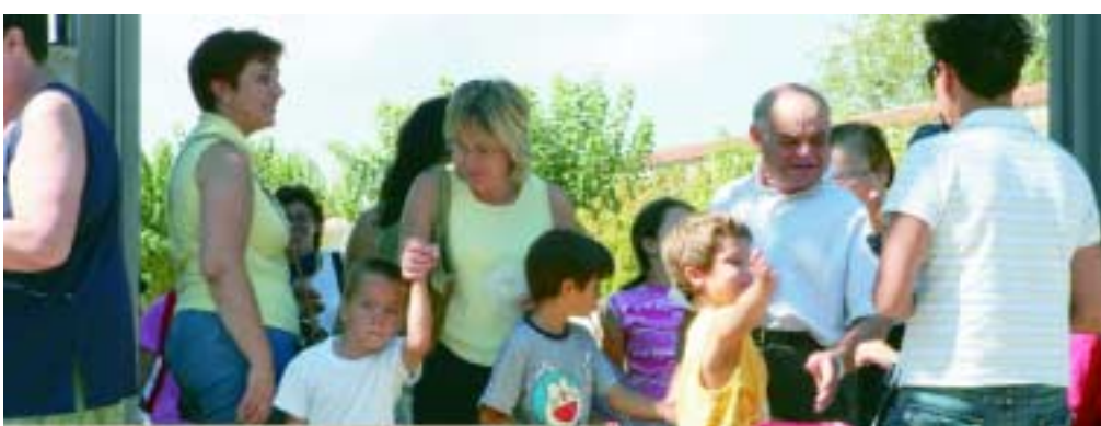
Ja s'han adjudicat les obres de remodelació del CEIP Sant Francesc d'Assís. A la imatge, la sortida dels nens i nenes d'aquest centre en un dels primers dies de classe

Aquest curs s'han incorporat al cicle escolar 328 nens i nenes de la ciutat. Un total de 2.435 alumnes estudien educació infantil i primària a Sant Joan Despí. La Generalitat ha adjudicat les obres de remodelació del CEIP Sant Francesc d'Assís