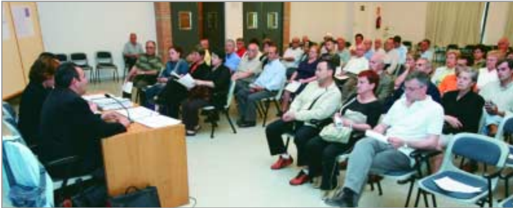
Un momento del encuentro entre los vecinos y vecinas, representantes de la AVV de les Planes y responsables municipales

El Ayuntamiento consultó a los vecinos y vecinas de las calles de les Planes que serán remodeladas en breve: València, Maria Fortuny y les Planes. La mayoría del vecindario optó por tener aceras más anchas en lugar de más coches estacionados