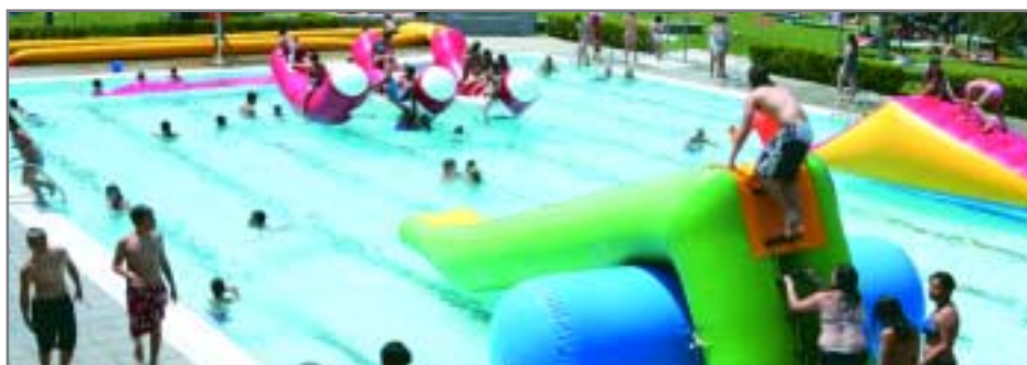
Les piscines recreatives Fontsanta van estrenar la temporada amb una festa aquàtica el passat 11 de juny

La piscina gran del complex de les piscines recreatives Fontsanta de Sant Joan Despí va ser l’escenari de la festa d’inauguració de la temporada de bany d’estiu. Activitats recreatives a l’aigua van servir per donar la benvinguda a la