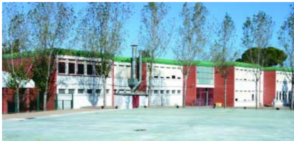
A dalt, pantalla vegetal a l'autopista AP-2. Sota aquestes línies, l'escola Pau Casals, on aviat es col·locarà una pantalla acústica per evitar l'impacte que produeix el soroll del pas dels trens

companyia ferroviària. D'altra banda, el Departament de Medi Ambient realitza actuacions de control i medicions de decibels (sonometries) quan es detecten situacions que poden incomplir la normativa o provoquen molèsties continuades. En aquest sentit, també la Policia Municipal realitza actuacions de medicions del soroll