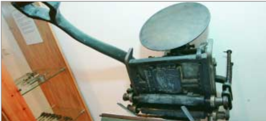
Una de les màquines que anys enrere es feien servir per a la impressió

Can Negre va acollir una mostra on es feia un repàs a la història del llibre i de la impremta, amb originals i màquinària del segle XIX