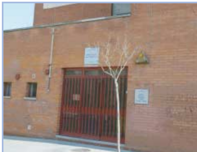
IES Jaume Salvador i Pedrol

Carrer de la Riera d'en Nofre, 1 Tel. 93 373 24 15 • Fax 93 477 15 60 correu electrònic: a8026567@centres.xtec.es