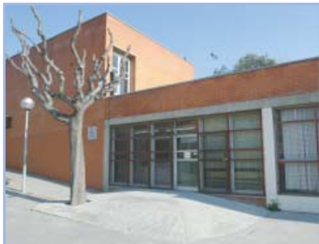
IES Francesc Ferrer i Guàrdia

Carrer de la Riera d'en Nofre, 1 Tel. 93 373 24 15 • Fax 93 477 15 60 correu electrònic: a8026567@centres.xtec.es