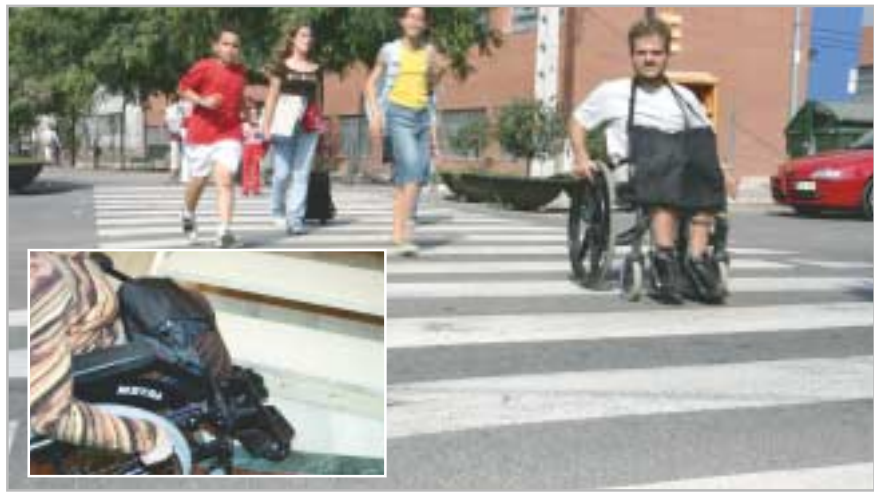
La ordenanza pretende mejorar la calidad de vida de las personas con discapacidad

Pese a las actuaciones que en los últimos años se realizan para adaptar los espacios públicos, todavía hoy las personas con discapacidad se encuentran con muchas barreras. La accesibilidad no sólo se debe reducir a las aceras, las calles o los equipamientos. Hay muchos más espacios de uso colectivo que siguen siendo un reto para, por ejemplo, quien va en silla de ruedas. Para avanzar en el camino hacia una mayor accesibilidad en Sant Joan Despí, el Ayuntamiento ha aprobado inicialmente una normativa destinada a mejorar las condiciones de vida de las personas con discapacidad o movilidad reducida. La última sesión del Pleno municipal dio luz verde a la Ordenança de Promoció de l'Accessibilitat i de Supressió de Barreres Arquitectòniques, que establece las condiciones mínimas que han de cumplir, en este sentido, los edificios de nueva construcción y las rehabilitaciones que se realicen en edificios de viviendas, locales comerciales y de servicios, así como en las nuevas actividades económicas que se pongan en marcha en la ciudad. La normativa hace referencia a la supresión de las barreras arquitectónicas que se encuentren tanto en el acce-