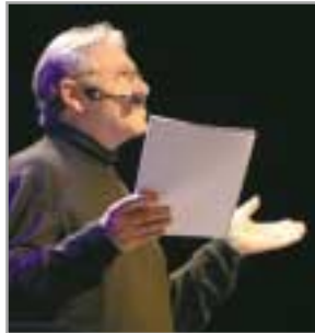
(No) en el nostre nom , el 3 de juny