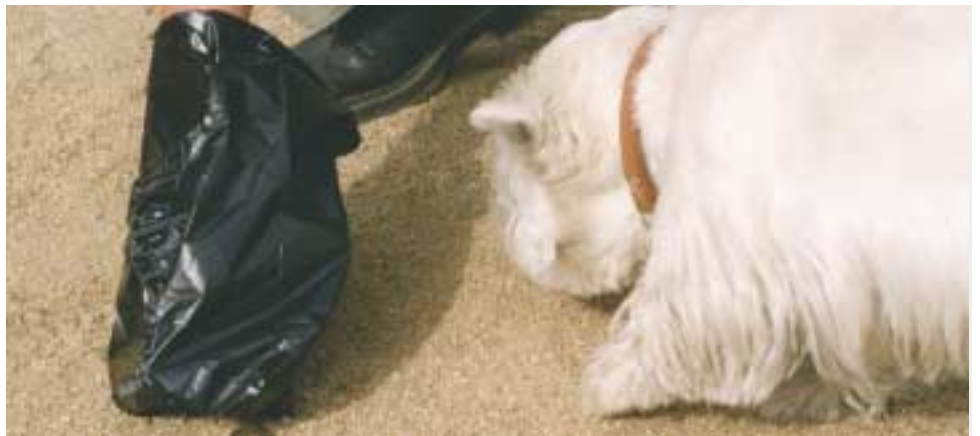
La campanya 'Sant Joan Despí + cívic' fomenta la bona convivència amb els animals de companyia

L'aplicació de la nova Ordenança del Civisme i la Convivència vol incidir encara més en la bona convivència