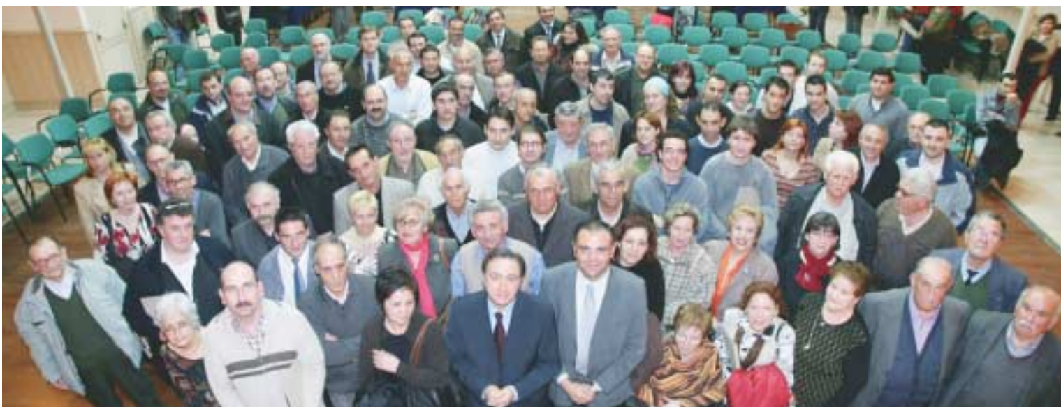
Fotografía de familia de las personas representantes de las entidades que firmaron, el 17 de marzo, convenio con el Ayuntamiento

El Ayuntamiento firma convenios de colaboración con las entidades de la ciudad para ayudar a su funcionamiento y potenciar la vida asociativa local