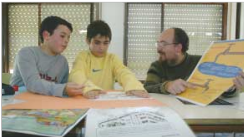
L'alumnat planteja i adopta mesures ecològiques per a la seva escola

L'Institut de Ciències de l'Educació de la Universitat de Barcelona agafa l'experiència de Sant Joan Despí com a un model d'aprenentatge i de servei a la comunitat