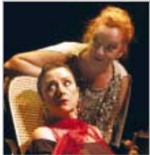
El cant de la sirena , el 6 de maig