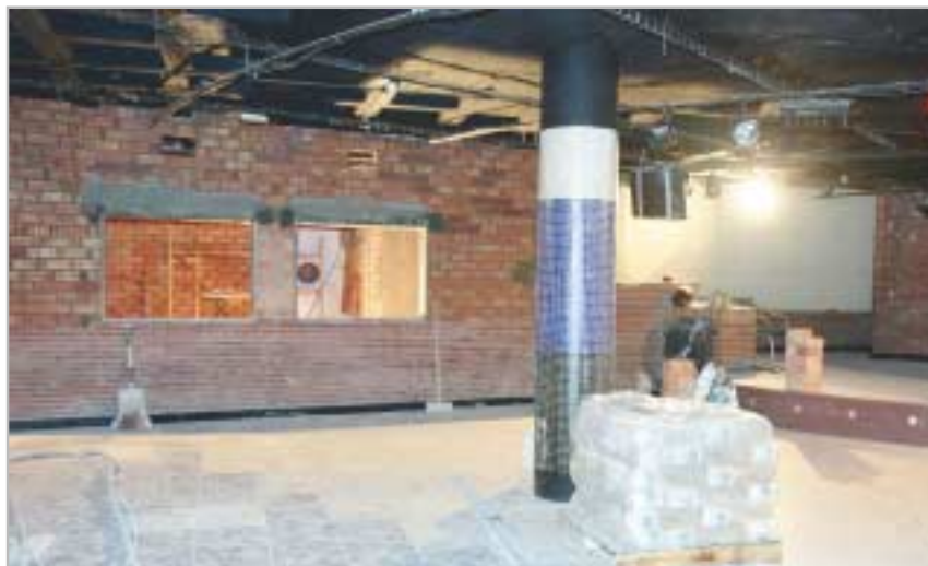
Aspectes que ofereix l'interior del futur casal de joves, ara en construcció

Els i les joves de la ciutat tindran aviat un nou equipament al seu servei, el casal de joves. Serà un punt de trobada i un espai d'activitats, sempre atenent les necessitats plantejades pels seus usuaris i usuàries. Mentre duren les obres, el jovent pot participar en una consulta per posar-li nom