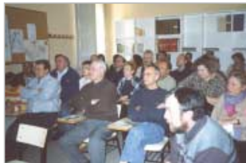
Assistents al curs de compostatge casolà

El consum d'aigua a nivell domèstic creix els darrers anys. Només a Sant Joan Despí es van gastar, l'any passat, més d'1,3 milions de metres cúbics. Amb motiu de la celebració del Dia Mundial de l'Aigua, el 22 de març, l'Ajuntament vol recordar la necessitat d'actuar conscientment pel que fa a la utilització de l'aigua, un bé escàs que no hem de malgastar. Per això, amb aquest Butlletí es distribueixen uns adhesius que ens recorden les accions que podem fer per estalviar-ne. Optar per la dutxa (50 litres de mitjana, davant els 300 d'un bany), regular el volum d'aigua de la cisterna del vàter (representa el 32% del consum domèstic i cada descàrrega gasta uns 10 litres) i de les aixetes amb mecanismes estalviadors ens ajudaran a fer servir l'aigua justa que necessitem. Accions que es fan ara especialment necessàries, a causa de l'escassetat de recursos hídrics als embassaments catalans.