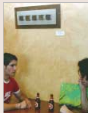
Les obres s'exposen en alguns locals molt freqüentats per la gent jove. A la fotografia, el bar Brother's

És l'anomenat museu virtual de l'Art Jove, apropant l'art a casa a través de les noves tecnologies. Si teniu inquietuds artístiques, no ho dubteu, presenteu-vos-hi. Les bases es poden aconseguir al Jovespí (centre Miquel Martí i Pol). A més, podeu guanyar 250 euros.