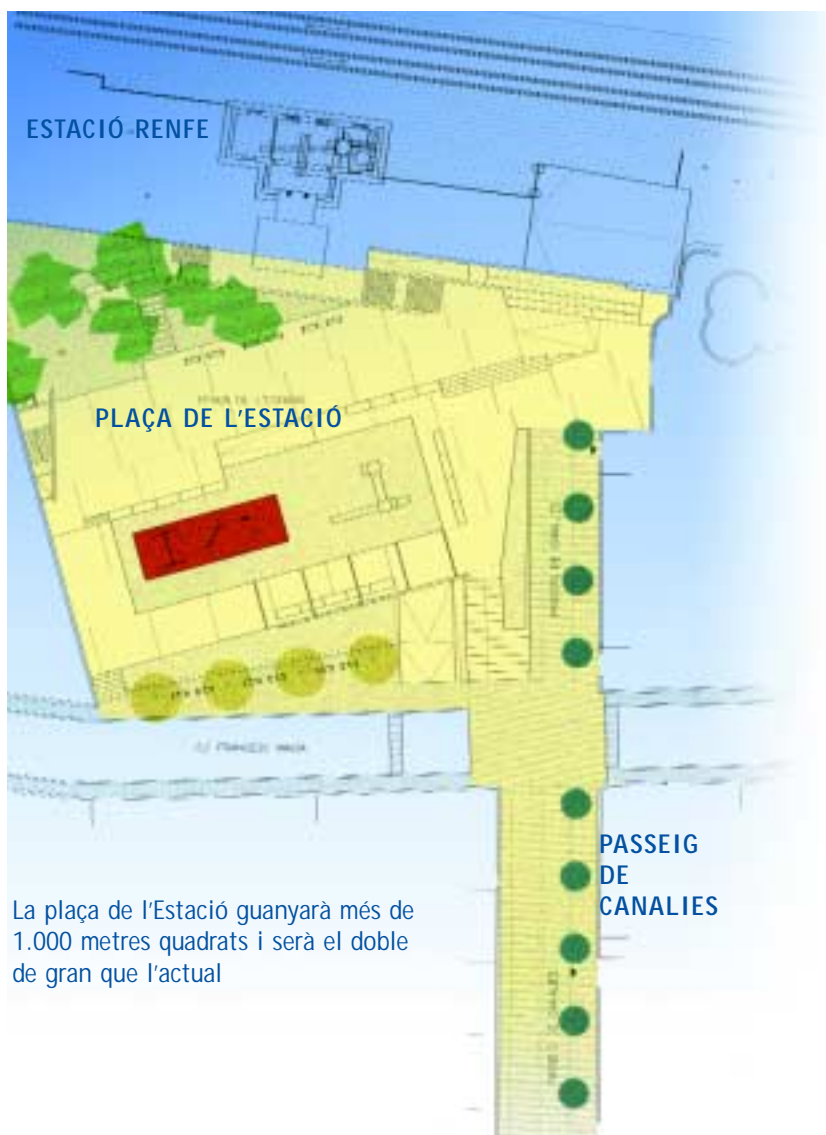
La plaça de l'Estació guanyarà més de 1.000 metres quadrats i serà el doble de gran que l'actual

La nova plaça de l'Estació gairebé duplicarà l'espai de l'actual, en incorporar més de 1.000 metres d'una finca confrontant. Passarà a tenir una superfície de 2.100 metres quadrats que garantiràn un accés més fàcil a l'estació, lliure de barreres arquitectòniques, que resoldrà el desnivell de l'entorn. Hi haurà dues zones diferenciades, un àrea de lleure amb jocs infantils i una pèrgola, i una altra zona d'estada on es col·locarà el monument a Anselm Clavé, que es man-