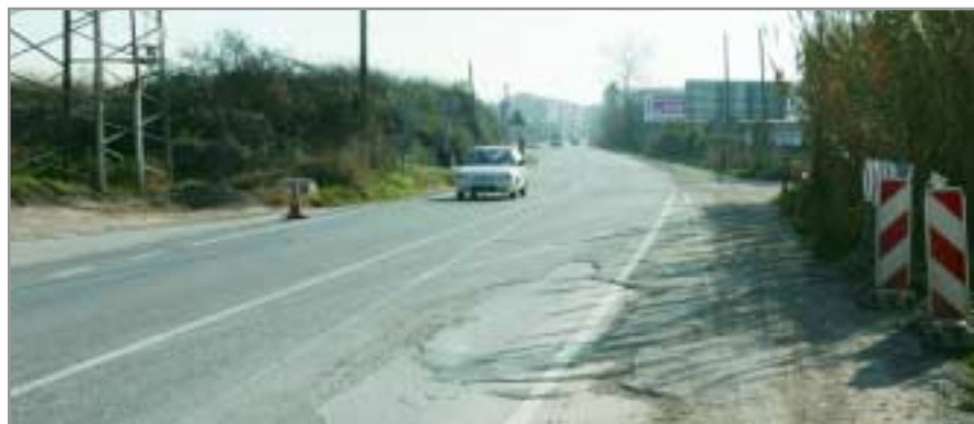
Aspecte actual de la carretera, que s'ha alleugerit de trànsit un cop oberta la connexió de la variant de la BV-2001 amb Sant Feliu

de Sant Joan Despí, ha manifestat que amb aquesta actuació la carretera "es converteix en una prolongació del carrer Major i es potencia la seva funció de passeig, cosa fins era impossible, en ser una via perillosa. Ara es facilitarà l'accés dels ciutadans i ciutadanes de les Begudes al Centre, així com a les escoles de la zona i a la Ciutat Esportiva". Les previsions són que les obres puguin començar a executar-se cap al final de l'any.