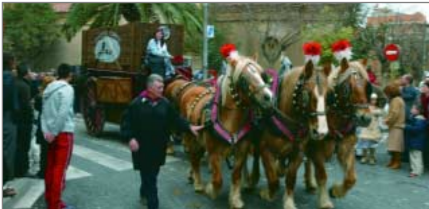
Els carros tirats de cavalls tornaran a ser els protagonistes dels Tres Tombs

El dia 30 de gener torna a celebrar-se aquesta festa tradicional recuperada a la ciutat per la Colla de Geganters