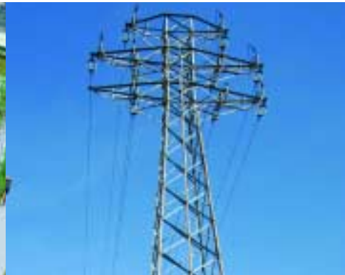
Las torres de alta tensión del parque Font Santa desaparecerán este año