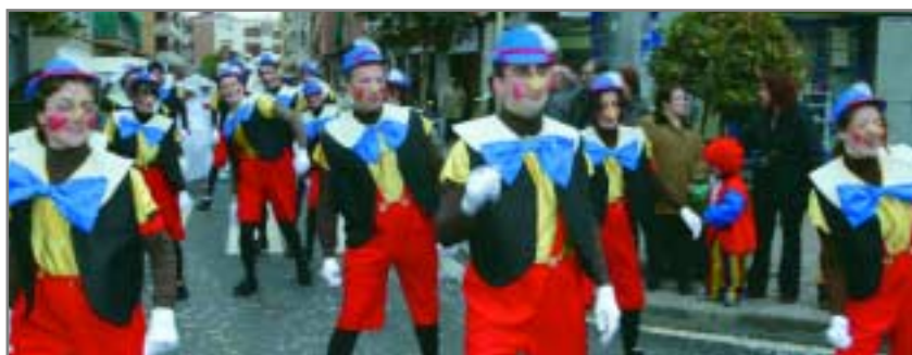
La rua de Carnaval canvia enguany el seu punt de sortida

La rua, dedicada enguany al món dels llibres, se celebrarà el dia 5 de febrer i sortirà de la rambla de Josep Maria Jujol