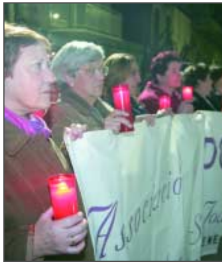
El circuit local contra la violència de gènere implica tots els estaments assistencials

Els i les professionals del circuit municipal de violència de gènere han detectat un increment de casos de dones que han sofert maltractaments físics i psíquics. Les treballadores socials de la població estan duent a terme una atenció individual i s'ha valorat que també és necessària una intervenció grupal, on poder incidir més en la seva problemàtica. La Regidoria de Serveis Socials i Dona, amb la col·laboració de la Regidoria d'Educació va iniciar l'octubre de 2004 el projecte Juntes diem prou! que té per objectiu donar suport psicosocial a aquestes dones, millorar la seva autoestima i aconseguir que se sentin protegides, garantint la màxima informació de serveis i recursos socials i assessorament legal de què disposen. Tot això es vol assolir a través de sessions setmanals de suport psicològic dirigides per una psicòloga del Departament d'Educació i a les