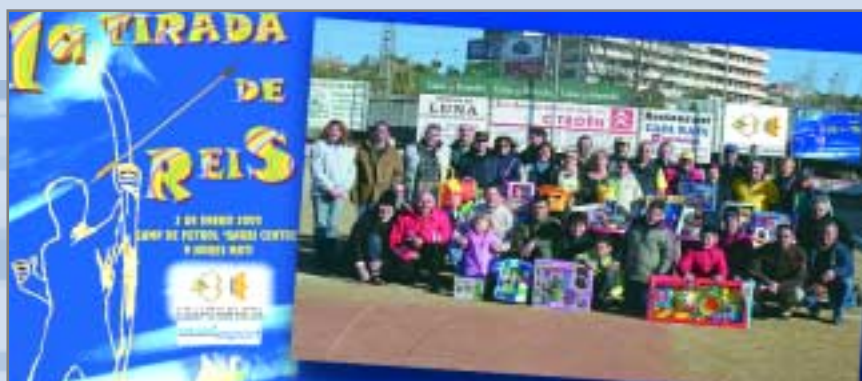
Participantes en esta primera edición junto con los juguetes recogidos