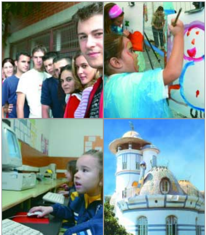
L'any 2005 serà el any del 'casal de joves', de millores en els centres educatius, de la apertura de la Torre de la Creu i de major oferta en 'casals d'estiu'

Entre las acciones programadas por el departamento se da prioridad a las acciones de detección y atención a la infancia y la adolescencia en situación de riesgo con servicios como el Centre Obert de Fusteria, actividades de ocio y el programa Maltractaments infantils, què fem? . Se pretende igualmente implementar la ayuda a domicilio con nuevos servicios de lavandería y limpieza, así como el transporte adaptado para personas mayores dependientes y para personas discapacitadas. También se desarrollará la campaña Contra la vio-