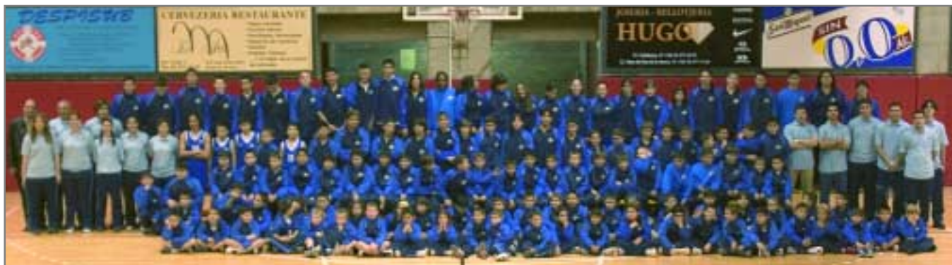
Enguany s'ha doblat el nombre de nens i nenes inscrits/es a l'escola esportiva del Bàsquet Club Sant Joan Despí

El club de bàsquet Sant Joan Despí registra un espectacular increment de nens i nenes a la seva escola esportiva, que aquesta temporada té 12 equips i 165 jugadors i jugadores. El primer equip enceta una nova etapa amb plantilla renovada i un nou entrenador