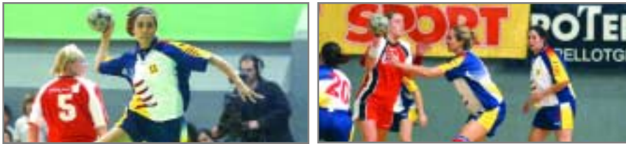
Las jugadoras de Sant Joan Despí durante el partido

Dos jugadoras de Sant Joan Despí participaron en el partido internacional Catalunya-Islandia, que se decidió en la prórroga