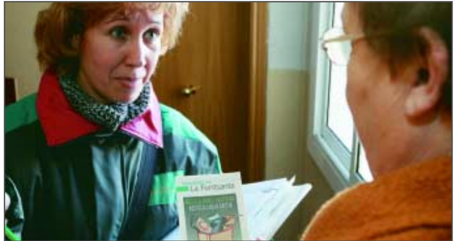
Informadors Ambientals en una de les seves visites de conscienciació ciutadana

Realitzen un 'porta a porta' fent feina d'informació i sensibilització sobre qüestions de reciclatge i la nova Ordenança de Civisme