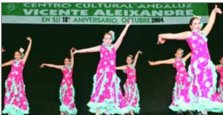
Un momento del festival celebrado el sábado, 6 de noviembre

Un año más, el Centro Cultural Andaluz celebró con éxito su aniversario. Un espectáculo en el Auditori Miquel Martí i Pol el 6 de noviembre (en el que además de los cuadros de baile locales actuó Suspiros del Sur) y un pic-nic en la zona de ribera el día 7 fueron las actividades que sirvieron para conmemorar su mayoría de edad como entidad al cumplir 18 años.