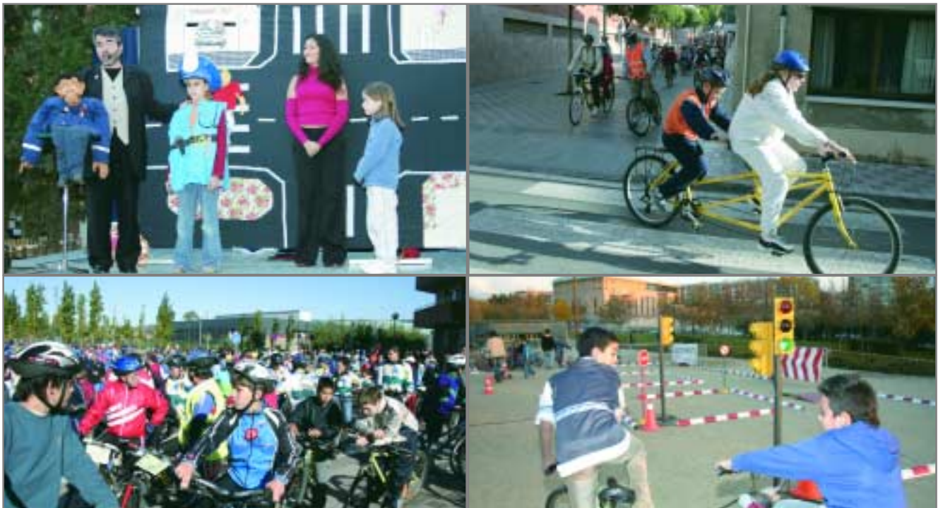
Imatges d'una mobilitat sostenible: d'esquerra a dreta i de dalt a baix, bicicletada amb l'alumnat del CEIP Pau Casals, animació als carrers, cursa popular en bici (per Sant Joan Despí, Esplugues, Cornellà i Sant Just) i circuit d'educació viària

Durant una setmana sencera, la ciutat s'ha emplenat de propostes per potenciar alternatives al cotxe a l'hora de moure's per Sant Joan Despí