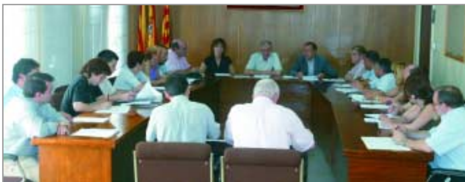
Todos los partidos con representación en el Pleno municipal votaron a favor de la reforma de la ordenanza, el pasado 11 de noviembre

Para garantizar el buen estado de nuestras calles y jardines, evitando que las malas acciones de unos pocos afecten a la mayoría, se modifica la Ordenanza del Civismo y la Convivencia, que incidirá más en el tema de los residuos mal depositados, los ruidos excesivos y las deposiciones de los perros en la vía pública