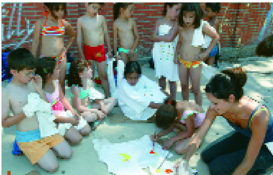
Pintada de samarretes en un dels casals de l'estiu passat

E n poc menys d'un mes acaba el curs escolar. Els pares, però, de manera majoritària encara trigaran a agafar vacances. Durant aquests dies, l'alternativa passa per portar els infants a espais on, a més de començar a gaudir del bon temps, desenvolupin alguna activitat que els agradi. A Sant Joan Despí, l'oferta per als nens i nenes durant aquestes primeres setmanes d'estiu ha anat creixent de manera continuada en els darrers anys i, amb vista a aquesta temporada, s'ha arribat pràcticament a oferir 2.000 places en les diferents propostes, des dels tradicionals casals d'estiu municipals, a les activitats que organitzen els equipaments esportius públics (com ara els campus dels poliesportius municipals o les estades esportives del Tennis Sant Joan). A això, a més, s'han de sumar les propostes d'algunes escoles i d'altres centres d'esplai. Concretament, els casals d'estiu municipal ofereixen un total de 600 places en el període que va del 21 de juny al 30 de juliol. Els diferents torns dels campus esportius del Francesc Calvet i el Salvador Gimeno sumen un total de 559 places i el Tennis Sant Joan calcula que pot acollir fins a 300 nens i nenes en la seva oferta d'estades multiesport, tennis i piscina, tennis jove i espai musical més piscina.