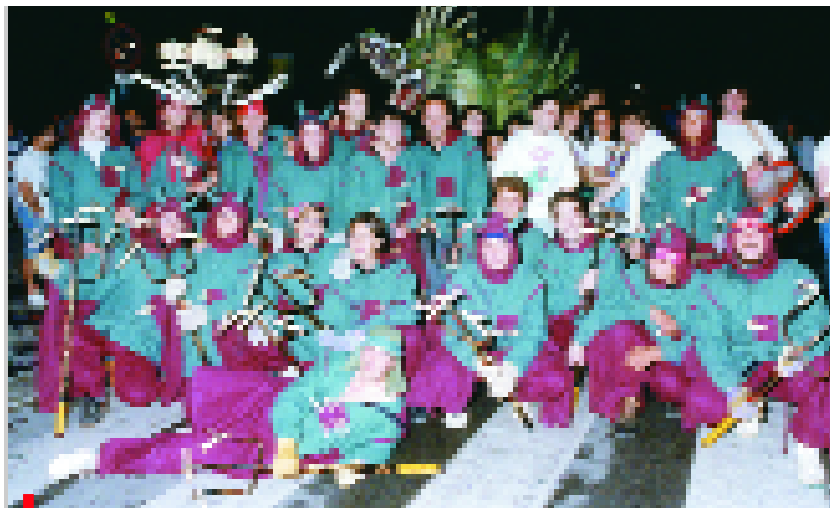
La Colla de Diablers, en una imatge de 1991

La Colla de Diablers de Sant Joan Despí celebra aquest any el vintè aniversari. Dues dècades omplint de foc, fum i ritme diferents esdeveniments de la ciutat i que, d'aquí ben poc, els podrem tornar a veure animant amb el seu popular correfoc la Festa Major. La colla va nèixer el 1985 impulsada des del casal Picasso, on encara es reuneix cada dimecres a la nit. L'any 1989 van presentar en societat al seva primera bèstia de foc, el drac Braulio, de 4 metres de llargada i amb 19 punts de foc. Vint anys després, més d'una vintena de persones continuen mantenint viu l'esperit de la Colla de Diablers, que celebrarà un sopar-concert d'aniversari per Festa Major i que ja treballa en la construcció d'una nova bèstia.