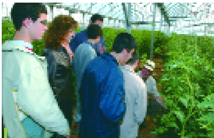
Els membres de l'Associació Estel descobreixen les feines del camp de la mà de l'Associació de Fruita Dolça

Els pagesos membres de l'associació de Productors de Fruita Dolça de Producció Integrada i l'Associació Estel estan duent a terme un programa de col·laboració per tal de posar en contacte les persones discapacitades amb el món agrícola. A més, amb aquesta iniciativa, es treballa en la integració social d'aquestes persones a la vegada que coneixen de primera mà la figura i la feina del pagès i, concretament, la tasca que desenvolupa l'Associació de la Fruita Dolça a Sant Joan Despí. Plantades, reg, collita de verdures i fruites, captura de talps... són algunes de les activitats que els membres de l'Associació Estel desenvolupen amb els pagesos. A la fotografia es recull un moment de la visita realitzada als camps del municipi el passat 13 de maig.