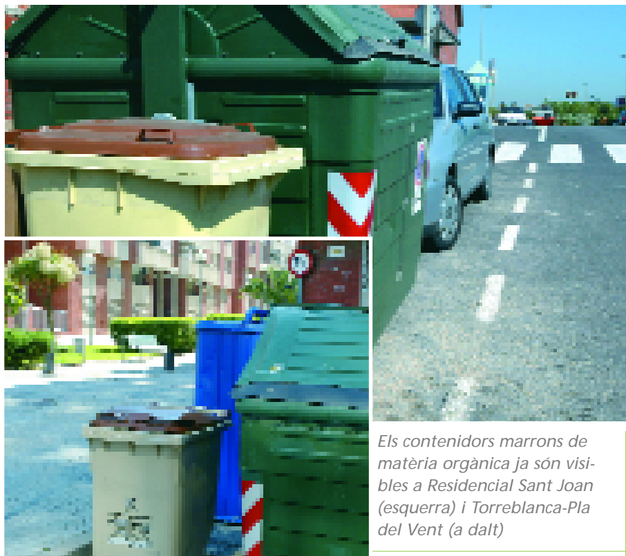
Els contenidors marrons de matèria orgànica ja són visibles a Residencial Sant Joan (esquerra) i Torreblanca-Pla del Vent (a dalt)

Durant la primera setmana de funcionament del servei, en aquestes noves zones on funciona s'han recollit tres tones de restes orgàniques.