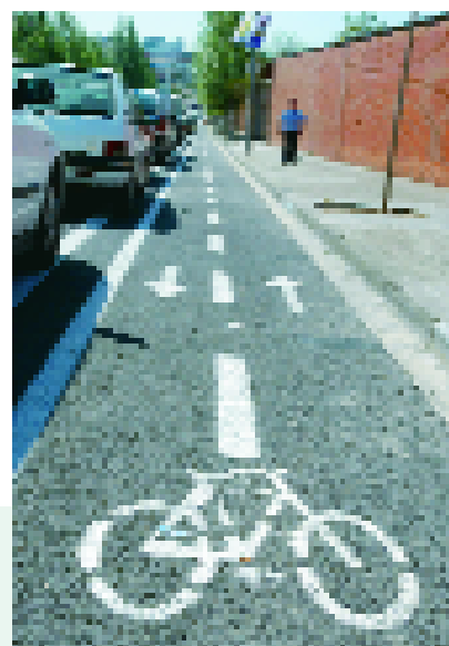
Avenida de la Generalitat

S ant Joan Despí es una ciudad que apuesta claramente por la bicicleta como elemento deportivo, de ocio y de transporte urbano. Somos uno de los municipios de la comarca con la red más extensa de carriles-bici, además de incidir directamente en su utilización a través de iniciativas populares como la campaña Primavera en Bici, que lleva 10 años ya invitando a la ciudadanía a coger la bicicleta por la ciudad.