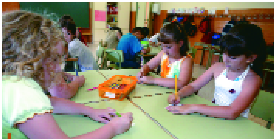
Els casals d'estiu combinen activitats lúdiques i formatives

Aquest any, l'oferta dels casals d'estiu municipals arriba a les 600 places, 150 més que el curs passat