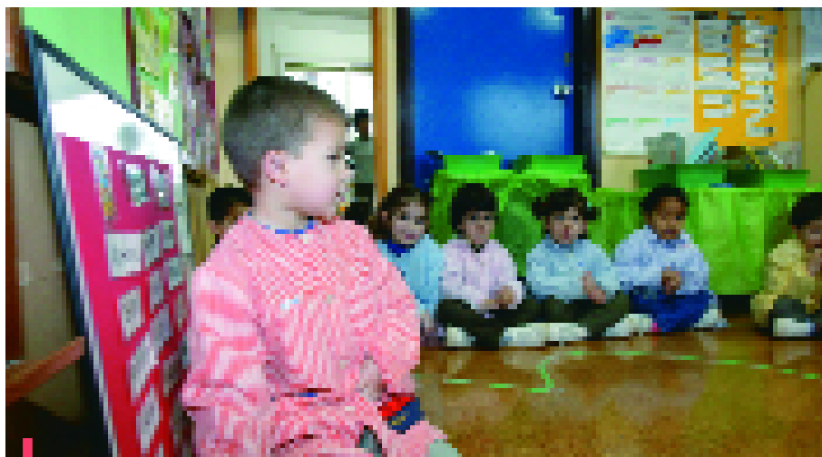
Un cop feta la preinscripció, comença la matriculació

Suficients per respondre a la demanda existent: s'han cursat 287 preinscripcions per al curs 2004-05, d'un total de 300 possibles