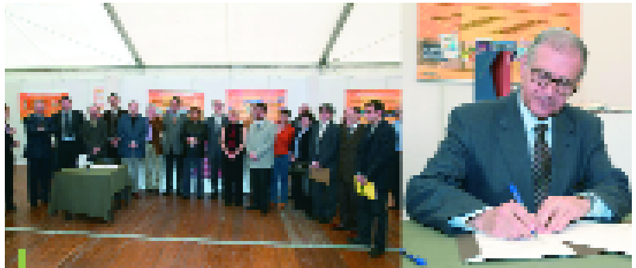
El protocol de col·laboració es va signar el 13 de maig, Dia del Sol

L'Ajuntament de Sant Joan Despí va ser pioner en l'aprovació d'a-