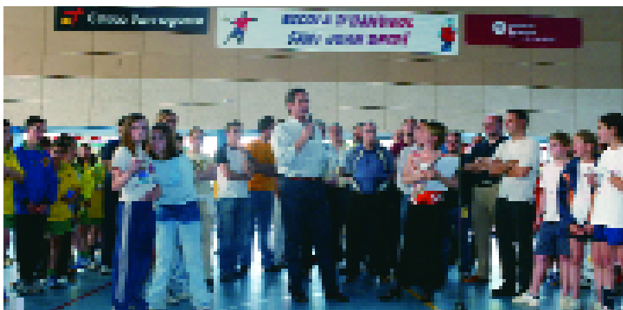
Más de 400 chicos y chicas participaron en la segunda edición del torneo

El pabellón Salvador Gimeno fue, el pasado 16 de mayo, una auténtica fiesta del balonmano. Se celebró la segunda edición del Torneo de Mini Handbol que organiza la Escola de Handbol y el Club de handbol, en colaboración con el Ayuntamiento, y que este año reunió a unos 400 chicos y chicas llegados de 13 equipos de toda la geografía catalana e