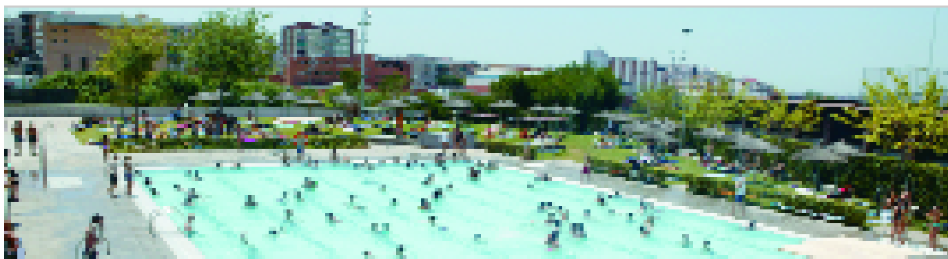
El 12 de juny comença la temporada de bany a les piscines FontSanta, amb una festa i un preu d'entrada especial

La temporada de les piscines recreatives FontSanta comença el proper 12 de juny i es perllongarà fins al 5 de setembre