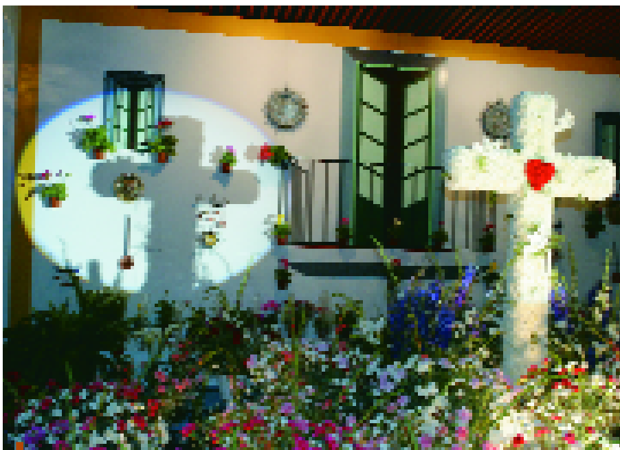
La plaza del Mercat acogi , un a o m s, la celebraci n de la Cruz de Mayo y luci  la decoraci n realizada por los miembros del Centro Cultural Andaluz Vicente Aleixandre