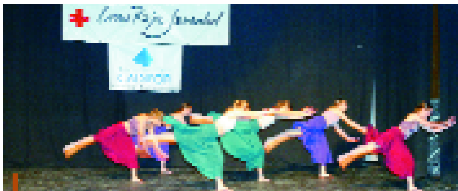
La Gala Solidaria de Creu Roja Joventut se destinó este año a ayudar a Irán

Más de 350 personas se reunieron el pasado 8 de mayo en el auditorio Miquel Martí i Pol de Sant Joan Despí a instancias de Creu Roja Joventut. El objetivo era recoger ayuda para las víctimas del terrible terremoto de la ciudad iraní de Bam, que desoló en su práctica totalidad esta ciudad milenaria dejando tras de sí la escalofriante cifra de más de 45.000 fallecidos.