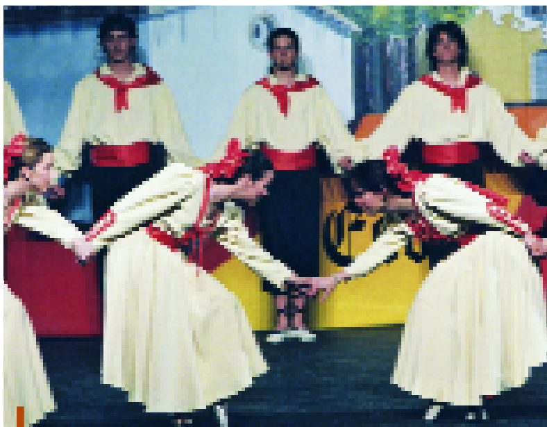
El ball m s tradicional es mant  viu a la ciutat gr cies a l'Esbart

L'Esbart Dansaire de Sant Joan Desp , fidel a la seva cita, va celebrar el passat 15 de maig el seu Festival de Primavera a l'Auditori. Unes 250 persones van gaudir dels diferents balls, entre els quals destac  el Mortizol, una dansa de vetlla que ballaven per primer cop (i que va completar-se amb una int rpret de bell canto i la guitarra de Dani Cano); la Festa de la Pagesia; el Jaleo, inspirat en passes menorquines i, especialment, Els Aires de la Terra Alta, una dansa plena de color i molt espectacular ja que els dansaires van passar entre el p blic tot repartint clavells. Tamb , com  s costum, hi van participar els quadres infantils i juvenils de l'entitat. La propera cita de l'Esbart a la ciutat ser  per la Festa Major. A l'estiu tenen previst participar en el Festival Internacional de M rcia i a la Fira de M laga.