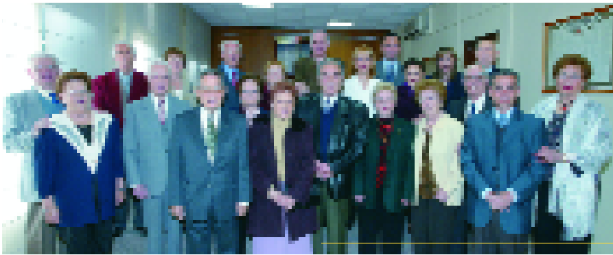
Las parejas que celebran sus bodas de oro fueron recibidas por el alcalde, Eduard Alonso. La imagen inferior muestra un momento de la exhibición de los talleres de 'gent gran'

La 'gent gran' de Sant Joan Despí, un año más, celebró como se merece su particular final de curso. La Setmana de la Gent Gran volvió a responder a las expectativas, consiguiendo un alto nivel de participación. Como cada año, las propuestas más lúdicas contaron con una importante afluencia de público, como el espectáculo Tots actüem , a cargo de los alumnos y alumnas de los talleres de 'gent gran', y el multitudinario Dinar de Gent Gran . Pero cabe resaltar como, cada vez más, las actividades de carácter cultural consiguen una mayor demanda. Prueba de ello fueron, por ejemplo, las visitas al Caixa Fòrum o al Museu de la Xocolata, ambos en Barcelona, para las que ha habido incluso lista de espera. Un gran interés también ha suscitado entre los mayores de Sant Joan Despí la excursión programada para el próximo 2 de junio para visitar el Museu Dalí de Figueres con motivo de la celebración del Any Dalí . Estos ejemplos demuestran el interés de los mayores de Sant Joan Despí por seguir aprendiendo. Una buena ocasión son los talleres de 'gent gran', que el mes próximo abren su periodo de inscripción (ver cuadro adjunto).