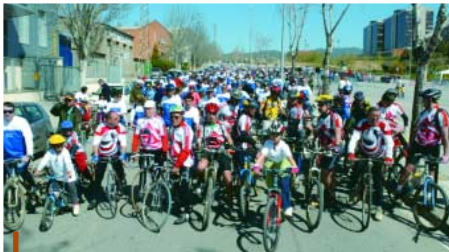
Amb el bon temps, la bicicleta esdevé el mitjà ideal per passejar o fer esport

L'arribada de la primavera i el bon temps és el moment ideal per a la pràctica esportiva a l'aire lliure. Anar en bici és una de les propostes que ofereix Sant Joan Despí, que des de fa ja una dècada celebra la campanya Primavera en bici amb l'objectiu de promoure l'ús d'aquest mitjà, a nivell esportiu i com una bona alternativa de transport. Les activitats programades s'adrecen a totes les edats, amb recorreguts senzills que permeten la participació de tota la família. Els carrils bici, els parcs i les zones naturals de la ciutat us esperen. Descobriu-les tot pedalant.