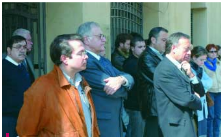
La corporación en pleno también se sumó a los diferentes actos en recuerdo de las víctimas y como muestra de la condena a la violencia terrorista

Todavía hoy se pueden ver en muchas terrazas, ventanas y establecimientos comerciales los lazos negros que llenaron nuestros barrios y que simbolizan el espíritu