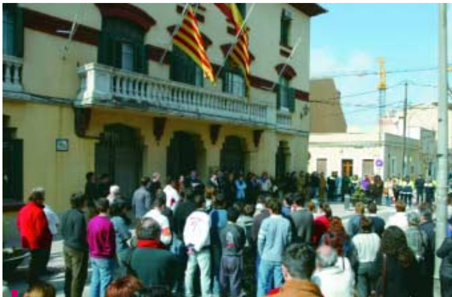
Imagen de una de las concentraciones realizada frente al Ayuntamiento

Los dramáticos sucesos del pasado 11 de marzo provocaron el rechazo unánime de toda la ciudadanía al terrorismo y la sincera solidaridad con el pueblo madrileño, que todavía hoy llora a las 202 personas que perdieron su