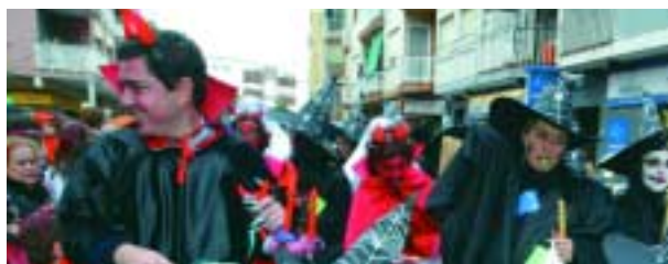
Dalí va presidir la rua, en què van participar 21 comparses

Tot hom pregava mirant el cel i, finalment, la pluja va deixar que el passat dissabte, 21 de febrer, se celebrés a Sant Joan Despí la rua de Carnaval. Les 21 comparses participants, a més de molts grups i persones a títol individual, es van llençar al carrer per viure la festa dels colors, la música, el ball i les disfresses, ingredients que van acompanyar la rua de carnaval per tota la ciutat, des de la plaça del Mercat al col·legi Sant Francesc d'Assís, amb Salvador Dalí com a mestre de cerimònies.