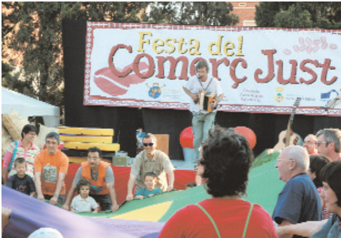
Imatge d'arxiu de la Festa del Comerç Just celebrada l'any passat

Dissabte, 9 de juny, festa del comerç més solidari a la plaça A. Machado