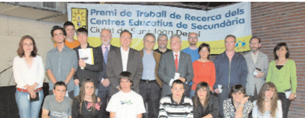
L'alumnat guanyador, el dia del lliurament dels premis al Bulevard

El 25 d'abril, el casal de joves El Bulevard va acollir el lliurament dels II Premis de Treballs de Recerca de Batxillerat de Sant Joan Despí que es realitza entre l'alumnat que estudia batxillerat per guardonar els millors treballs en els àmbits del Batxillerat científic i tecnològic, i de ciències socials, arts i humanitats. Els premis van néixer amb l'objectiu de potenciar i impulsar entre l'alumnat dels tres centres de la ciutat (J. Salvador i Pedrol, F. Ferrer i Guàrdia i l'Ateneu) els treballs de recerca sobre l'àmbit del batxillerat en què s'estan especialitzant.