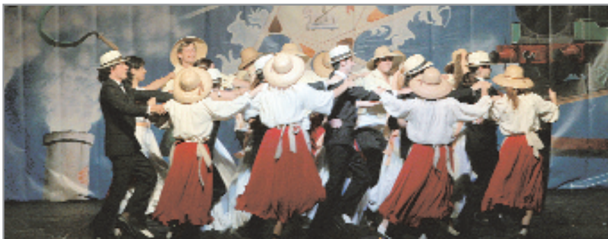
A l'Auditori descobrirem una nova jota de pastor

L'Esbart Dansaire de Sant Joan Despí organitza el 26 de maig a partir de les 22 hores el seu 30è Festival de Primavera a l'Auditori Miquel Martí i Pol amb algunes sorpreses. D'una banda, el Cos de Dansa realitzarà sis balls, tres dels quals són estrena. A l'auditori descobrirem una nova jota, un ball