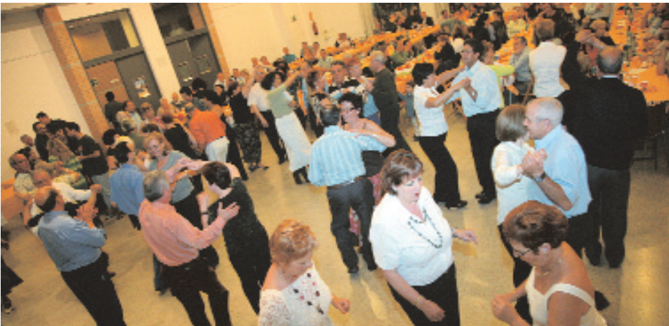
Despu3s de la cena, los asistentes disfrutaron de un baile

Camins Solidaris celebr3 el 21 de abril su tradicional cena solidaria en el centro c3vico de les Planes que este a3o ha tenido un significado especial ya que la entidad conmemora su d3cimo aniversario. El d3nero recaudado se destinar3 a un proyecto que, conjuntamente con la escuela de balonmano de Sant Joan Desp3, est3n desarrollando en Montevideo para crear escuelas que impartan esta disciplina deportiva.