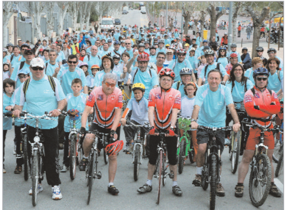
De nou hi ha hagut una gran participació a la sortida d'inauguració de la temporada

La temporada Primavera en bici, a més de la festa d'inauguració, consta de diferents sortides els diumenges al matí, concretament els dies 22 i 29 d'abril, i 13 i 20 de maig.