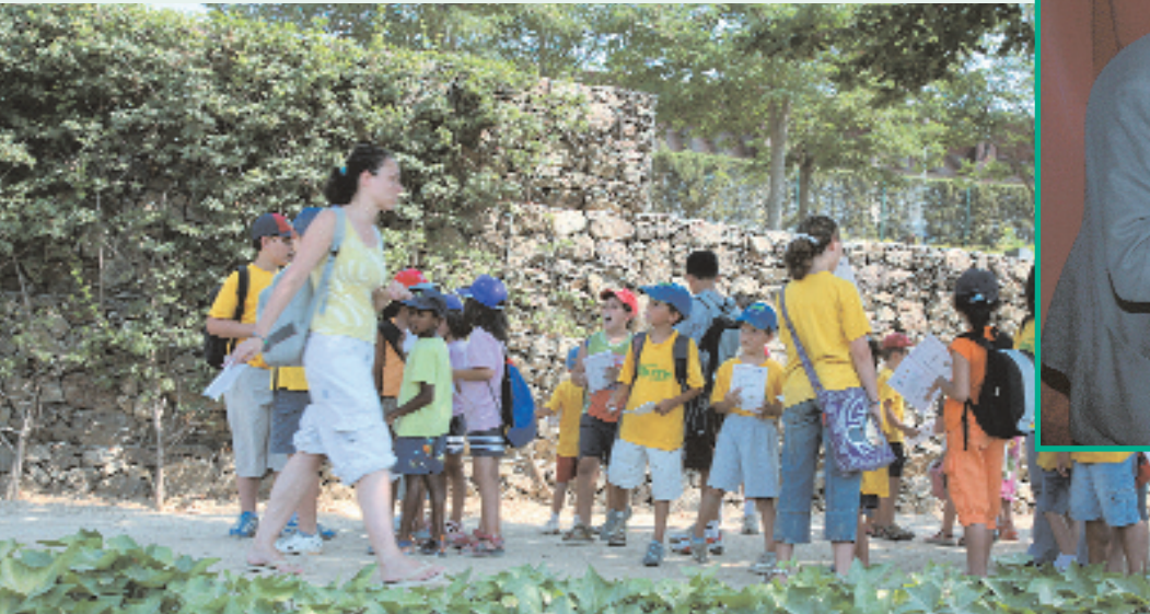
El parc de la Font Santa serà escenari de tallers de conscienciació adreçats als infants

Entre les activitats previstes es projectarà el documental d'Al Gore "Una veritat incòmoda"