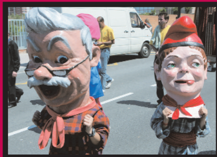
Cagrossos. Aquestes i més figures van envair els carrers de la ciutat diumenge 6 de maig.