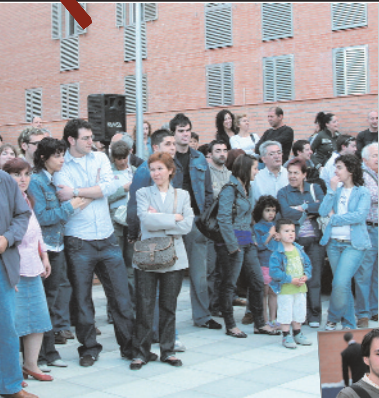
Arriba, imagen de las familias que participaron en el acto. A la derecha, una de las parejas que han conseguido un piso protegido, con el alcalde, Antoni Poveda