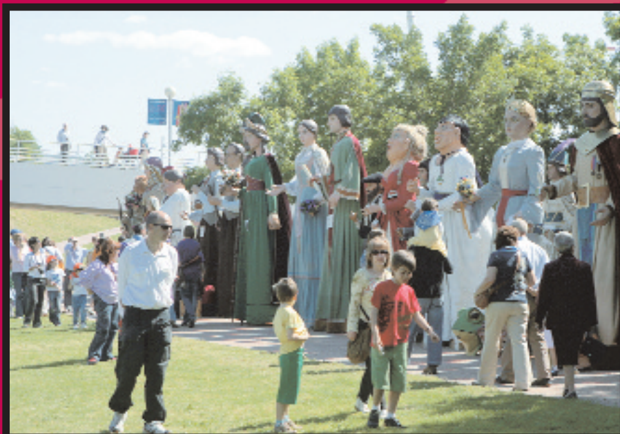
Plantada. El parc de la Fontsanta es va omplir de gegants