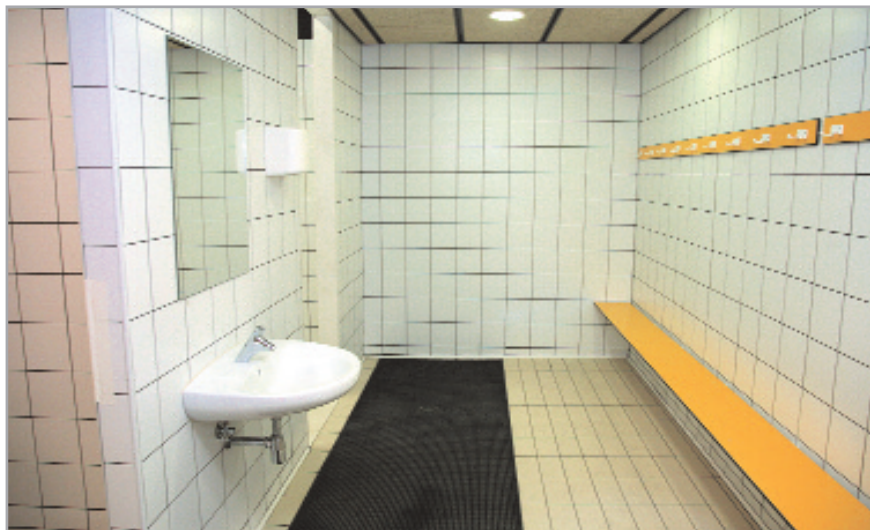
Els vestidors han guanyat en modernitat i confortabilitat

Primera fase per fer un poliesportiu gairebé nou