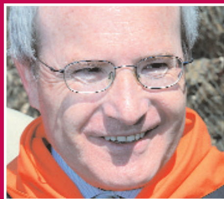
El president català, amb el mocador de la Colla Gegantera de Sant Joan Despí

José Montilla, president de la Generalitat