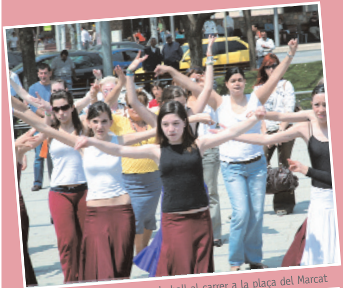
Classes obertes de ball al carrer a la plaça del Marcat