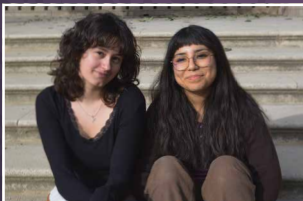
MÍMULUS Duo musical