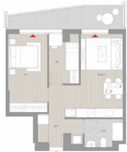
HABITATGE GENERAL 2 DORMITORIS