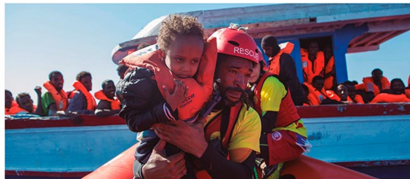
Tasques de salvament de Pro Activa Open Arms al Mediterrani