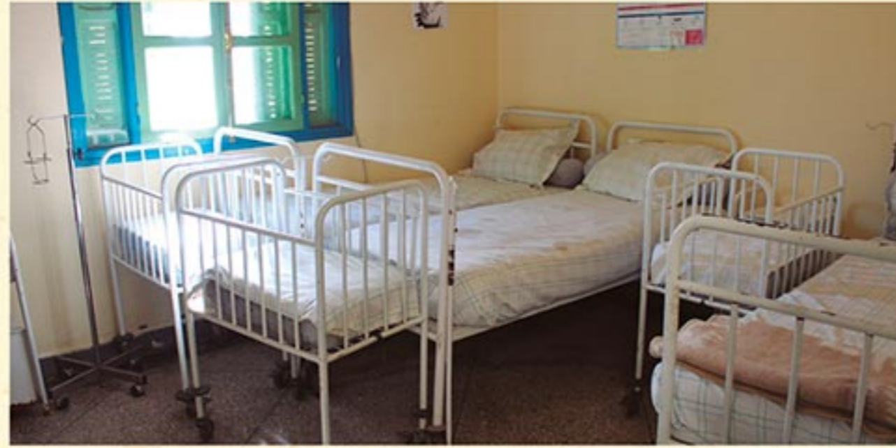
Centre maternoinfantil de Ras El Ain

L'Ajuntament de Sant Joan Despí, juntament amb uns altres quatre municipis, integra la Xarxa Baix Llobregat, que treballa en projectes de cooperació directa descentralitzada amb els municipis de l'àrea de Màrraqueix-Safi, al Marroc.