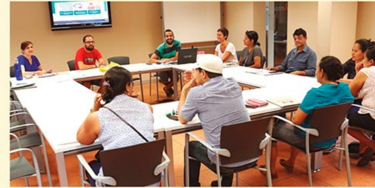
Sessió d'un curs de coneixement de l'entorn