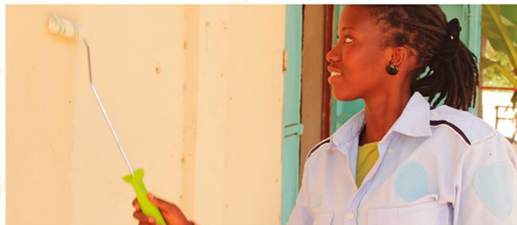
El projecte Fandema genera alternatives laborals per a les dones

el rol de la dona en la societat. Des de Sant Joan Despí, diverses entitats treballen per afavorir la igualtat de gènere i el desenvolupament de la dona africana ja sigui fent hortes comunitàries per a dones, projectes d'inclusió de dones discapacitades en grups esportius o formació professional per a dones joves. Sobre tot plegat reflexionarem en la primera Utopia.