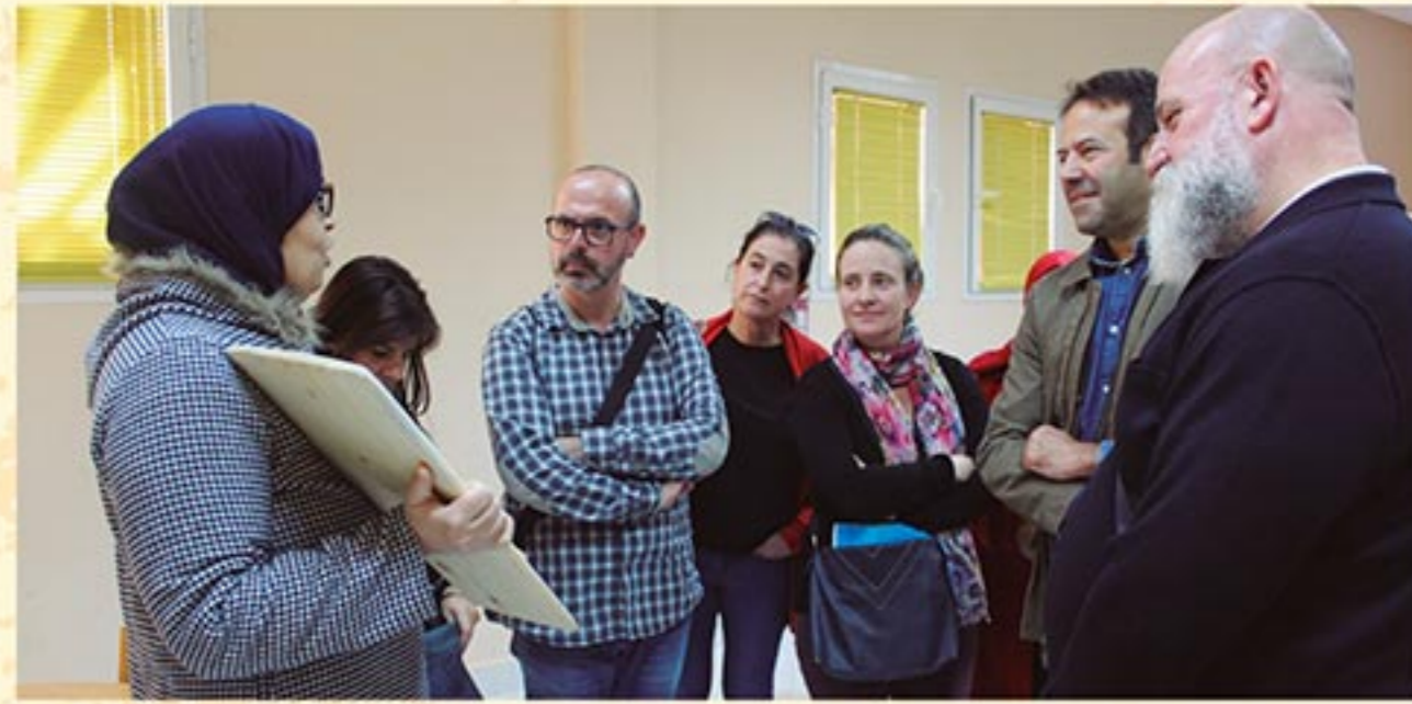
Fase de formació del projecte Jusur l'any 2019