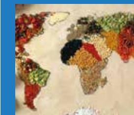
Plats del món

Divendres 24, 31 gener i 7 i 14 febrer, de 19 a 20.30 h Preu: 25 € (4 sessions) T'agrada ballar però et falta un impuls?